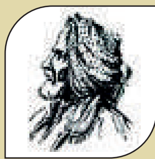
Hecî Qadirê Koyî

Emîş caran nîye qurban tufeylî bême ser xwanit