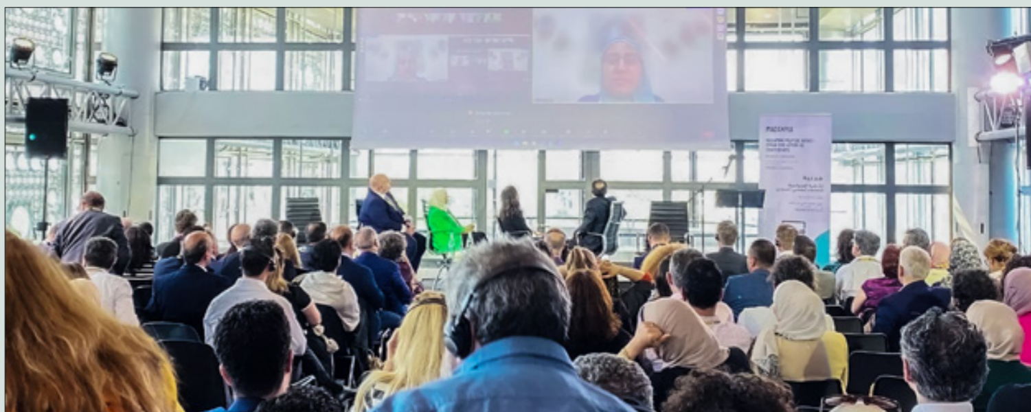
محادثات عبر الفيديو لعمليتي منظمات لم يتكهنوا من مغادرة سوريا خلال مؤتمر إطلاق مبادرة "عمليّة" للمجتمع المدني السوري - 6 حزيران 2023

تحتاج المنظمات السياسية والمدنية إلى العمل المشترك في الملف السوري، وقلما تحدث لقاءات بين هذه المنظمات، وهو سلوك فسره المحللون بـ"التنافسية" بين الطرفين، و"احتكار" العمل السياسي. الخبير المتخصص بشؤون إدارة منظمات المجتمع المدني، الدكتور باسم حتاحت، يرى أن عدم تكامل عمل المنظمات السورية السياسية منها والمدنية مرتبط بعدة أسباب، أولها "الانانية"، وعدم وجود برنامج سياسي للمعارضة السياسية تعمل فيه أدوات مدنية.