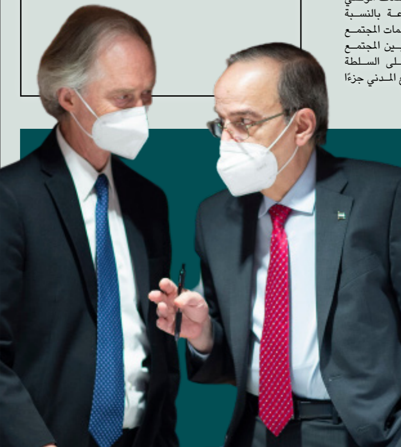
مبعوث الأمم المتحدة الخاص إلى سوريا جيم برينسون والرئيس المشترك عن وفد المعارضة مهدي البحرة في اجتماع اللجنة الدستورية في جنيف - 22 تشرين الأول 2021