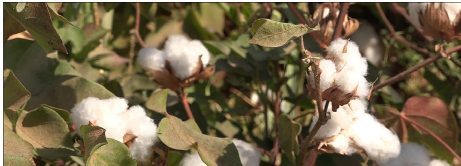
شجرة القطن - الرقة - 23 من أيلول 2021

الذهب 21 ▲ 500.000 الذهب 18 ▲ 429.000 المازوت = 7500 البنزين = 10000 الغاز = 125000 (للجرة) السكر (كغ) = 9000 الأرز (كغ) = 9500 الدولار أمريكي ▲ مبيع 9000 شراء 8900 يورو ▲ مبيع 9680 شراء 9568 ليرة تركية ▲ مبيع 358 شراء 379