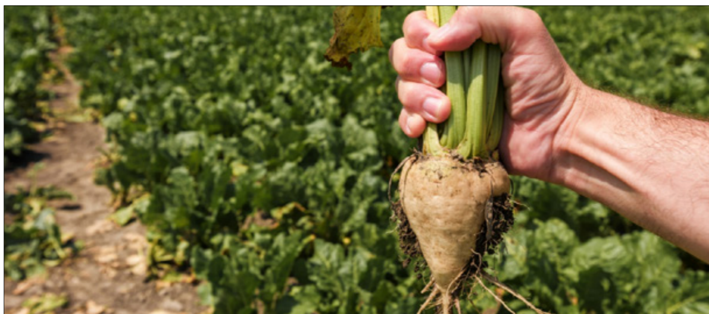
زراعة الشمندر السكري في سوريا (سانا)

الذهب 21 ▲ 500.000 الذهب 18 ▲ 429.000 المازوت = 7500 البنزين = 10000 الغاز = 125000 (للجرة) السكر (كغ) = 9000 الأرز (كغ) = 9500 الدولار أمريكي ▲ مبيع 9000 شراء 8900 يورو ▲ مبيع 9680 شراء 9568 ليرة تركية ▲ مبيع 358 شراء 379