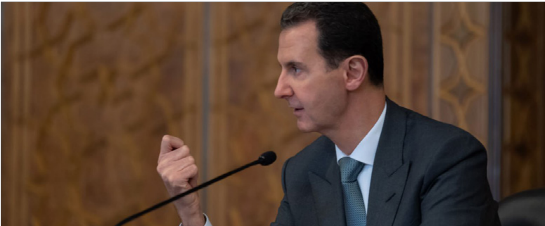
رئيس النظام السوري بشار الأسد (رئاسة الجمهورية)