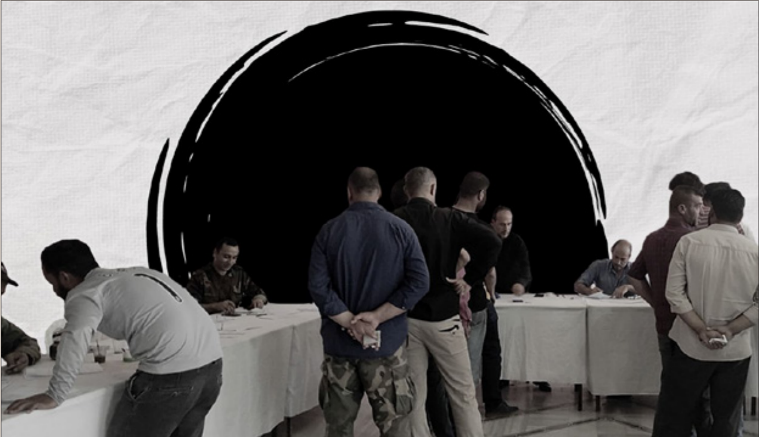
من مركز التسوية في ضمر الحوريات برعا الفد التحل عنبلصيا

ضغط المقاتلين الحيين على النظام في أرياف درعا لتخفيف الضغط عن درعا باشرف مقاتلون مدعوا بمهاجمة حواجز النظام عقب أيام بإجراء "تسوية" حُر بموجبها مقاتلون من أبناء المنطقة مجدداً باتجاه الشمال السوري.