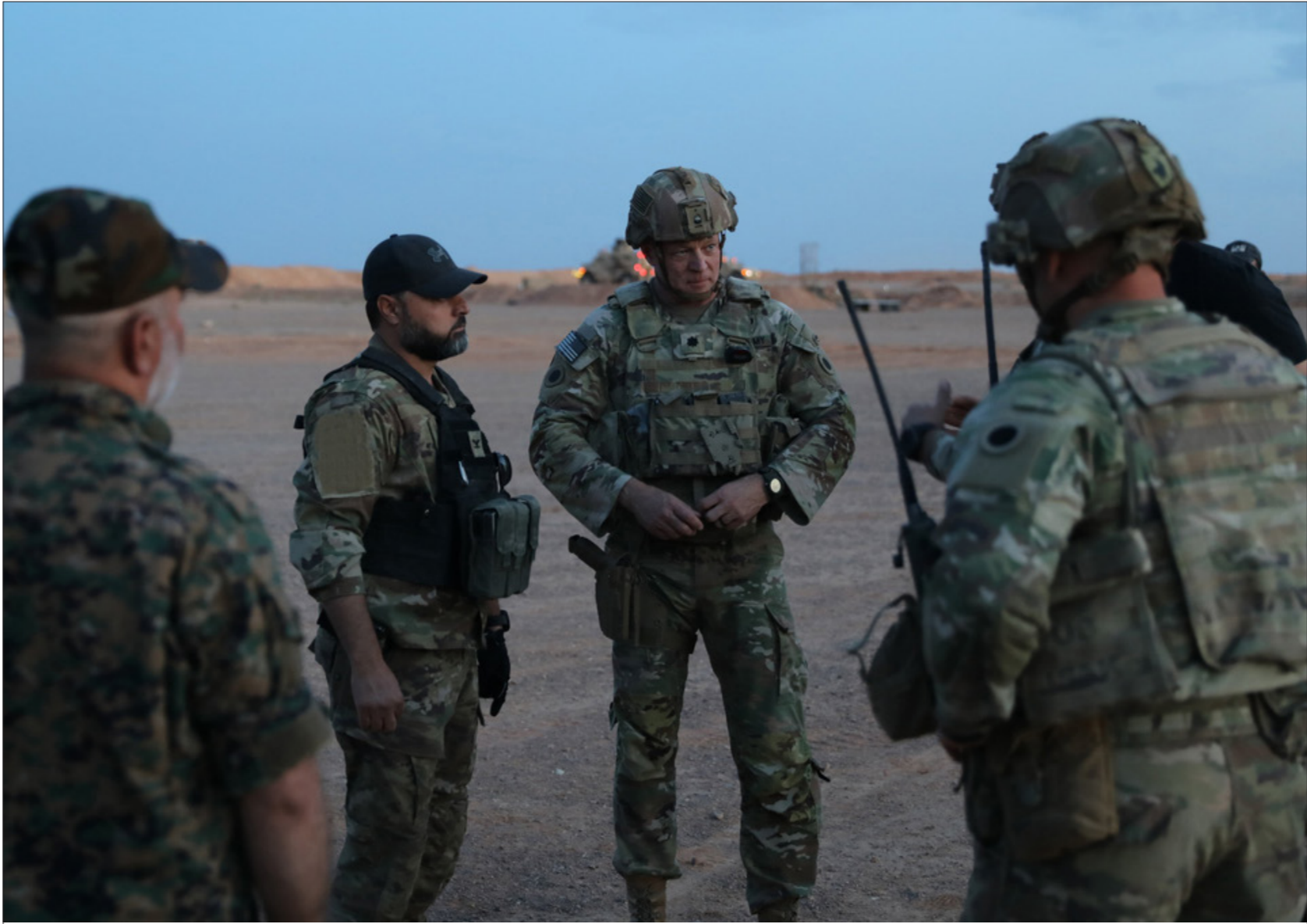
تدريبات عسكرية مشتركة بين جيش سوريا الحرة"والتحالف الدولي، من 20 من أيار 2023 للتحالف الدولي، سوريا)

عنب بلدي - السنة الثانية عشرة - العدد 590 - الأحد 11 حزيران / يونيو 2023