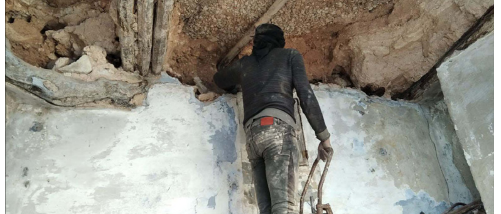
ترميم مهجر مقيم في مدينة إدلب لبيت استأجره حديثاً - 9 من حزيران 2023