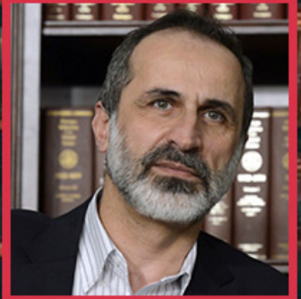
الشيخ معاذ الخطيب