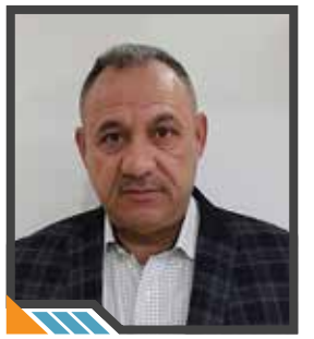
كاتب وباحث سوري