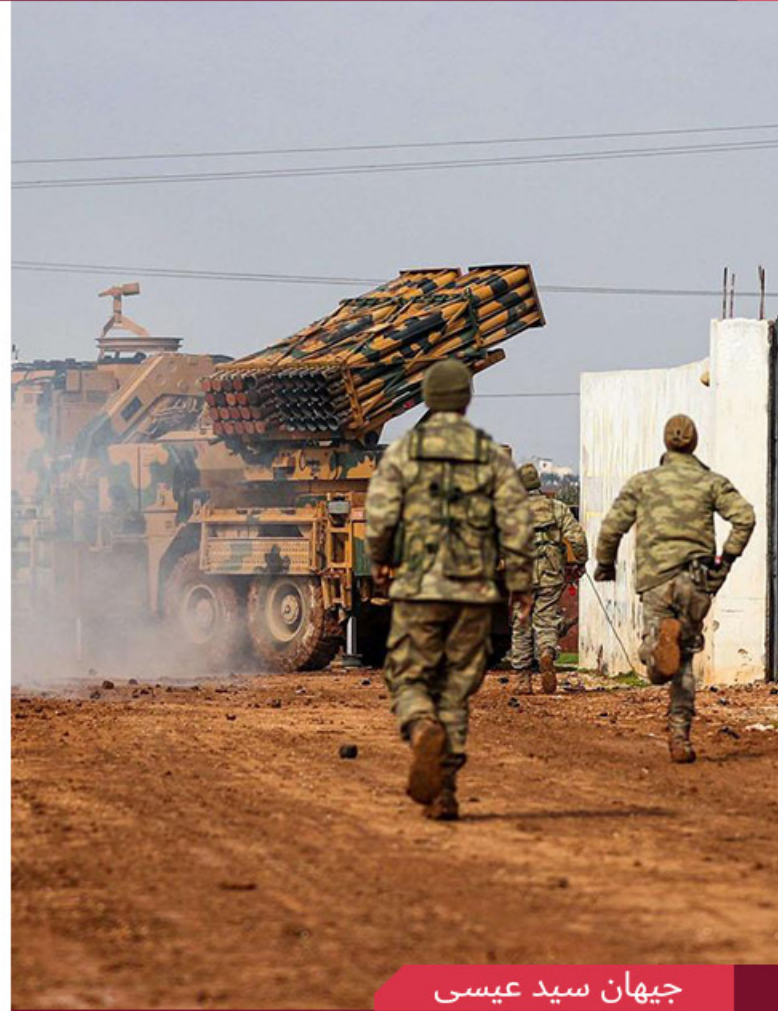
جيهان سيد عيسى