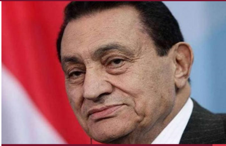
وفاة الرئيس المصري سابقًا (حسني مبارك) عن عمر ناهز 91 عامًا

توفي الرئيس المصري حسني مبارك يوم الثلاثاء الموافق لـ 25 فبراير من عام 2020. هذا وقد أعلن التلفزيون المصري عن وفاة الرئيس السابق عن عمر ناهز الـ 91 عامًا، وكان سبب وفاة مبارك مرض (الرفرفة الأذينية) ووفقًا لموقع "medicinenet" فالمرض عبارة عن عدم انتظام ضربات القلب. وتم تشييعه بجنائز مهولة من قبل النظام المصري الحالي عكس ما فعلوا مع الرئيس الراحل (محمد مرسي) الذي دفنوه ليلاً وسط تشديد أمني كبير.