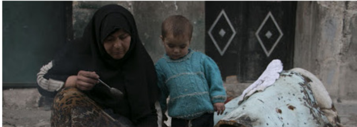
سورية تحتل المرتبة الأولى بالفقر عالمياً

توفي الرئيس المصري حسني مبارك يوم الثلاثاء الموافق لـ 25 فبراير من عام 2020. هذا وقد أعلن التلفزيون المصري عن وفاة الرئيس السابق عن عمر ناهز الـ 91 عامًا، وكان سبب وفاة مبارك مرض (الرفرفة الأذينية) ووفقًا لموقع "medicinenet" فالمرض عبارة عن عدم انتظام ضربات القلب. وتم تشييعه بجنائز مهولة من قبل النظام المصري الحالي عكس ما فعلوا مع الرئيس الراحل (محمد مرسي) الذي دفنوه ليلاً وسط تشديد أمني كبير.