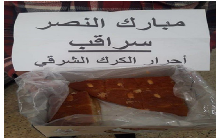
مدنيون في درعا يحتفلون بتحرير سراقب

أعلن والي هاتاي (رحمي دوغان) أن عدد الجنود الأتراك الذين استشهدوا في قصف الطيران السوري في إدلب بقرية بليون بلغ 33 جندياً. وصرح الوالي للصحفيين: "سبق وأن أعلنت للرأي العام استشهاد 29 جندياً تركياً وإصابة آخرين بجروح خطيرة" وتابع: "للأسف فإن أربعة جنود من أصحاب هذه الإصابات قد ارتقوا شهداء ليرتفع العدد إلى 33". وطمأن المجتمع التركي عن البقية بقوله: "أما الجرحى وعددهم 32 جندياً فهم يواصلون علاجهم بالمستشفيات، ولا خطر على حياتهم".