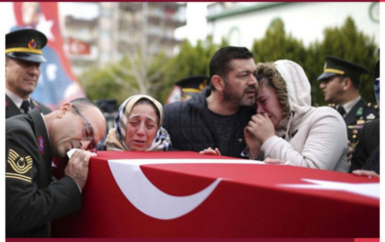
الحصيلة النهائية لشهداء الجيش التركي في إدلب

تستمر سورية في تصدر الترتيبات العامة في كل شيء سيئ منذ سنوات، فبعد تصدر سورية على مؤشر الفساد العالمي، احتلت المركز الأول لأفقر دولة في العالم. وحصلت سورية على نسبة بلغت 82.5% بحسب بيانات نشرها مؤشر موندي وغيرها، واعتمد الموقع بحسب ما ذكر وترجمته (صحيفة حبر) على كتاب حقائق العالم لوكالة المخابرات المركزية كمصدر للمعلومات. وجاء بعد سورية في الفقر مدغشقر ثانياً بنسبة 75.3% وزمبابوي ثالثاً بنسبة 72.3% فيما كانت سيراليون بالمرتبة الرابعة عالمياً بنسبة 70.2% ونيجييريا في الخامسة بنسبة 70.0%