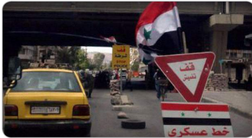
الخميس 17 ربيع الأول 1441هـ / 14 تشرين الثاني 2019

وتشهد محافظة درعا عمليات اغتيال لعناصر النظام المجرم وهجمات تستهدف حواجزه المنتشرة في المحافظة دون معرفة الفاعلين.