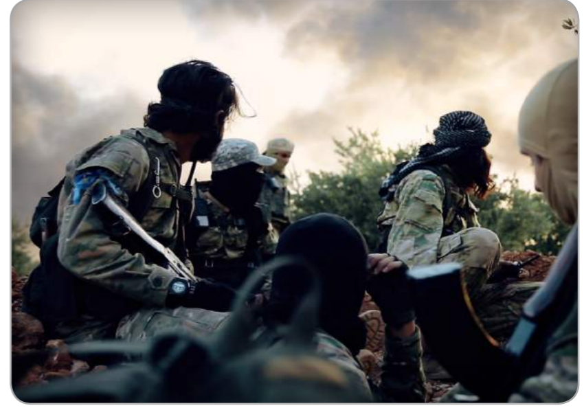
الخميس 17 ربيع الأول 1441هـ / 14 تشرين الثاني 2019

شمال اللاذقية، وصف بالأعنف منذ ساعات الصباح الباكر من يوم الخميس، تكبدت خلاله عشرات القتلى والجرحى.