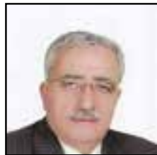
■ منصور الأتاسي

لنقطة انطلاق لموازنة الضغوطات التي تحاول الحكومات التركية تشكيلها على الغرب من خلال تنامي القوة الاقتصادية والعسكرية التركية، والتلويح بين فترة وأخرى بورقة قوافل اللاجئين التي يمكن أن تطرق أبواب أوروبا مجددًا إن تغافل عنها حرس الحدود التركي. أما السياسي منصور الأتاسي رئيس حزب