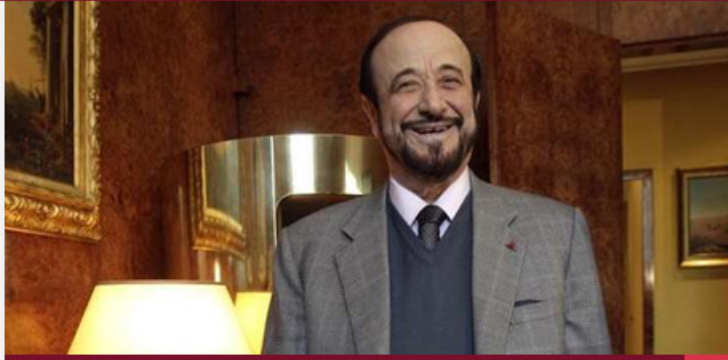
فرنسا تُقاضي رفعت الأسد بسبب أمواله المهربة

نقل مصدر قضائي يوم الأربعاء أن رفعت الأسد عمّ رئيس النظام السوري بشار الأسد سيمثل للمحاكمة في فرنسا فيما يتصل بامتلاكه لأصول عقارية تصل قيمتها إلى ملايين اليوروات وذلك بأموال جرى تهريبها من سورية. وترى سلطات قضائية فرنسية أن رفعت الأسد (81 عاماً) امتلك على نحو غير قانوني عقارات في عدة دول وذلك بأموال من سورية وهو ما نفاه مراراً.