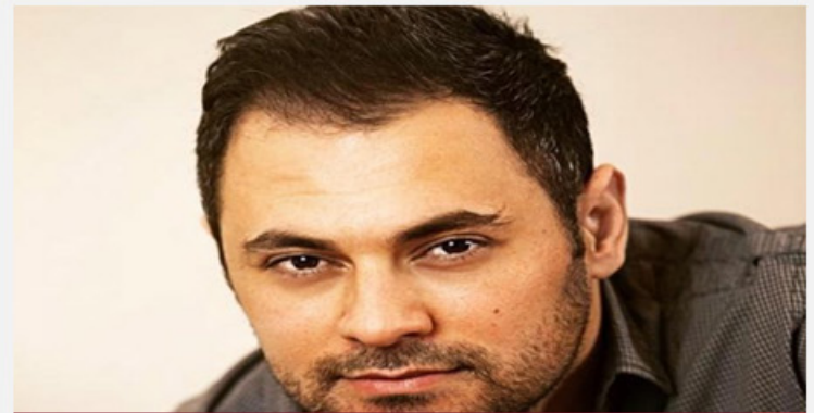
فنان يغادر دمشق هرباً من حكم الأسد

وأسفرت الاشتباكات بين الجانبين عن وقوع قتيلين في صفوف الحرس الثوري، وجرح 4 عناصر من الشرطة العسكرية.