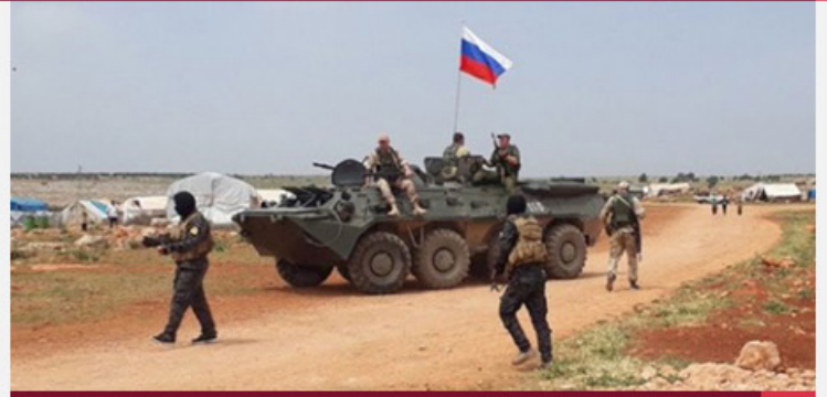
قتلى وجرحى باشتباكات بين قوات روسية وإيرانية