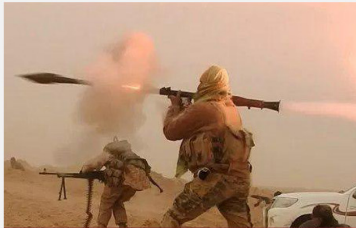
35 قتيلاً للنظام وميليشيات إيران بهجمات لداعش في البادية السورية

نقل مصدر قضائي يوم الأربعاء أن رفعت الأسد عمّ رئيس النظام السوري بشار الأسد سيمثل للمحاكمة في فرنسا فيما يتصل بامتلاكه لأصول عقارية تصل قيمتها إلى ملايين اليوروات وذلك بأموال جرى تهريبها من سورية. وترى سلطات قضائية فرنسية أن رفعت الأسد (81 عاماً) امتلك على نحو غير قانوني عقارات في عدة دول وذلك بأموال من سورية وهو ما نفاه مراراً.