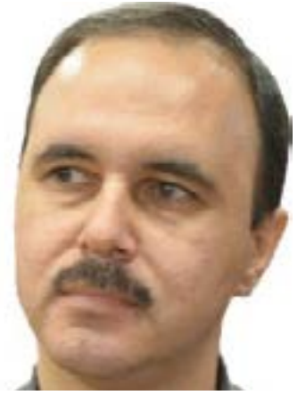
صحفي وكاتب سوري

أيام مضت على انتهاء عام حمل في طياته كثيراً من الأحداث، فمن إعلان ترامب قراره الأخير الخاص بالانسحاب من سورية، وسياساته والانفجارات الشعبية التي خرجت هنا وهناك في السودان وفرنسا والأردن ولبنان والعراق وغيرها، يمكن لنا أن نستشرف أن عام ٢٠١٩ لن يكون مريحاً وإيجابياً، بل سيكون عاماً صعباً على السوريين والشعوب المطالبة بحقوقها، وسنشهد المزيد من الانفجارات الشعبية في إطار نضال هذه الشعوب لتصل إلى حقوقها المنهوبة.