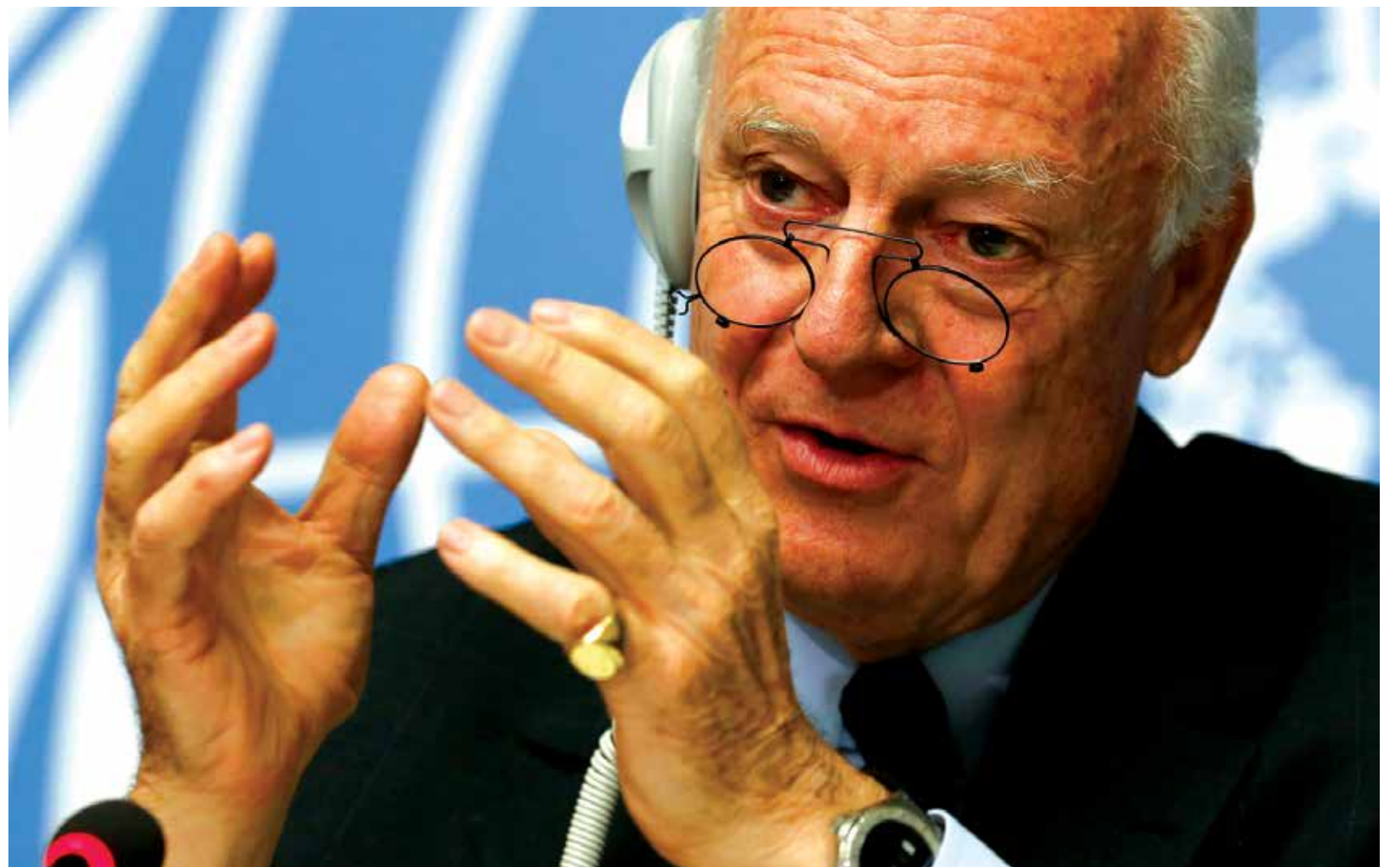
فشل في مهمته - انترنت

وعينت الأمم المتحدة الدبلوماسي النرويجي غير بيدرسون، مبعوثاً جديداً لها إلى سوريا، وذلك خلفاً للدبلوماسي ستيفان دي مستورا، الذي فشل خلال سنوات وساطته الأممية في إيجاد حل لحمام الدم السوري. وقال الأمين العام للأمم المتحدة أنطونيو غوتيريش في اجتماع لمجلس الأمن الدولي: «تقرر تعيين الدبلوماسي النرويجي جير بيدرسن مبعوثاً جديداً للأمم المتحدة إلى سوريا» وأضاف غوتيريش: «عند اتخاذ هذا القرار، قمنا بالتشاور على نطاق واسع، بما في ذلك مع الحكومة السورية». واعتبر المسؤول الأممي، أن «بيدرسن سيدعم الأطراف السورية لتسهيل التوصل إلى حل سياسي شامل مقبول من الجميع يلبي التطلعات الديمقراطية للشعب السوري». ومن غير المعروف مصير هذا المبعوث الذي جاء في ظل التقدم الكاسح للنظام على جميع الجبهات وانحسار جبهة المعارضة السورية.