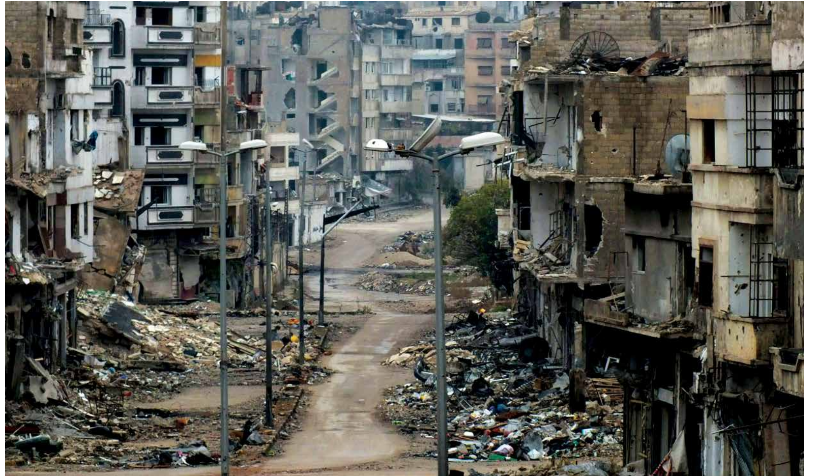
النظام دمر سوريا

وتابع «كما قام النظام أيضا بعملية مسح كاملة وواسعة النطاق وتزوير لسجلات الممتلكات في جميع أنحاء البلاد، بهدف منع السكان من العودة والمطالبة بأي حقوق. ففي 1 يوليو/ تموز 2013، مثلاً، قصفت قوات النظام السجل العقاري لمدينة حمص المركزية، وهو ما أدى إلى حريق هائل، لدمر العديد من سجلات الممتلكات في المدينة، وهو ما دفع سكان المدينة إلى الاعتقاد أنه كان متعمداً، لأنه كان الهيكل الوحيد الذي احترق في الجزء الأكثر أمناً من المدينة» وقال إنه «سجلت أيضا حرق سجلات الأراضي في كل من الزيداني وداريا ودرعا والقصير، فحرق السجلات لا يمنع فقط أصحاب الأملاك الخاصة الأصليين من استعادة ممتلكاتهم، لكنه يسمح أيضا بنقل الملكية للأفراد والجماعات الموالية للنظام. وفي بعض الحالات، شملت السجلات المدمرة أيضا فواتير الكهرباء والماء التي يمكن استخدامها لإثبات الملكية، كما تردت روايات كثيرة عن تزوير السجلات، بما في ذلك استخدام وثائق مزورة لتنفيذ بيع الملكية ونقلها إلى الملاك الجدد». وأشار إلى أن ذلك «ترافق ذلك مع إصدار قوانين ومراسيم قد تبدو «محاولة» لإصلاح القوانين العقارية، وتسريع إعادة الإعمار في ظل الحرب، لكنها لا تأخذ في الحسبان حالة الأشخاص النازحين أو المفقودين. ولذلك، أصبح بعضهم يعتبر أنها بالعكس وضعت من أجل استهدافهم، ومنع من العودة، عبر مصادر ممتلكاتهم وحرمانهم من حق الملكية الخاصة».