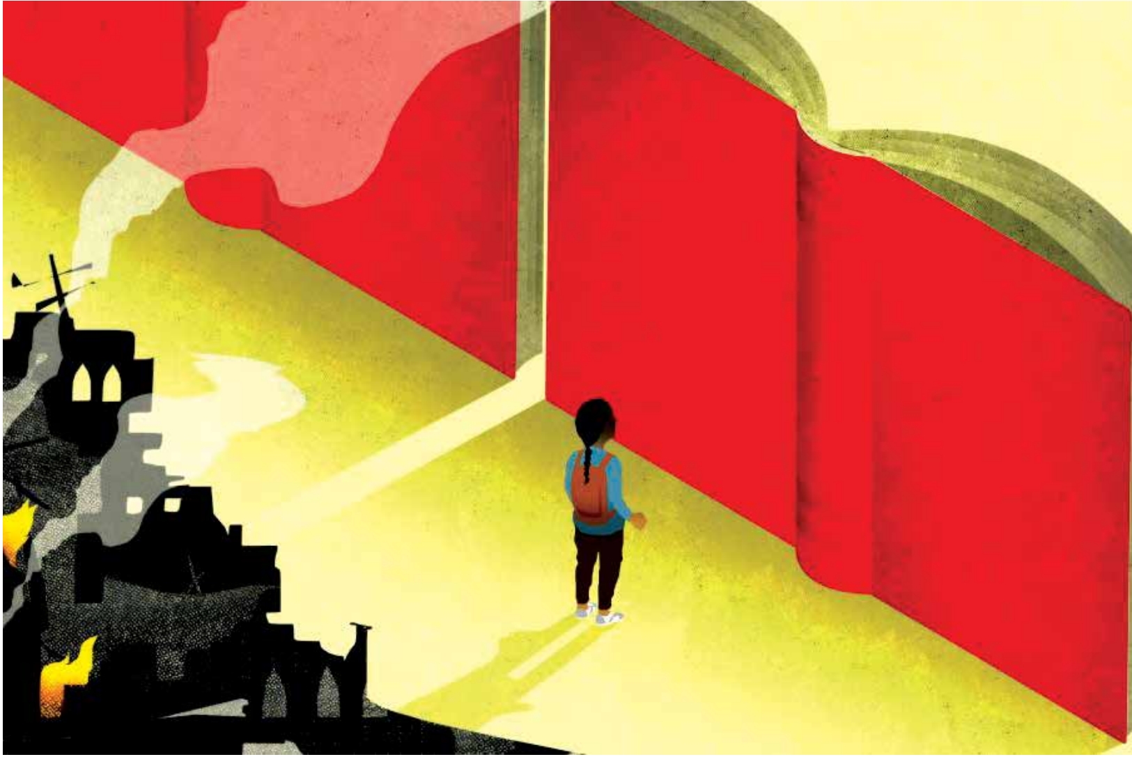
أقل من نصف الأطفال اللاجئين في سن الدخول إلى المدرسة في لبنان ملتحقون بالتعليم الرسمي - رايتس ووتش