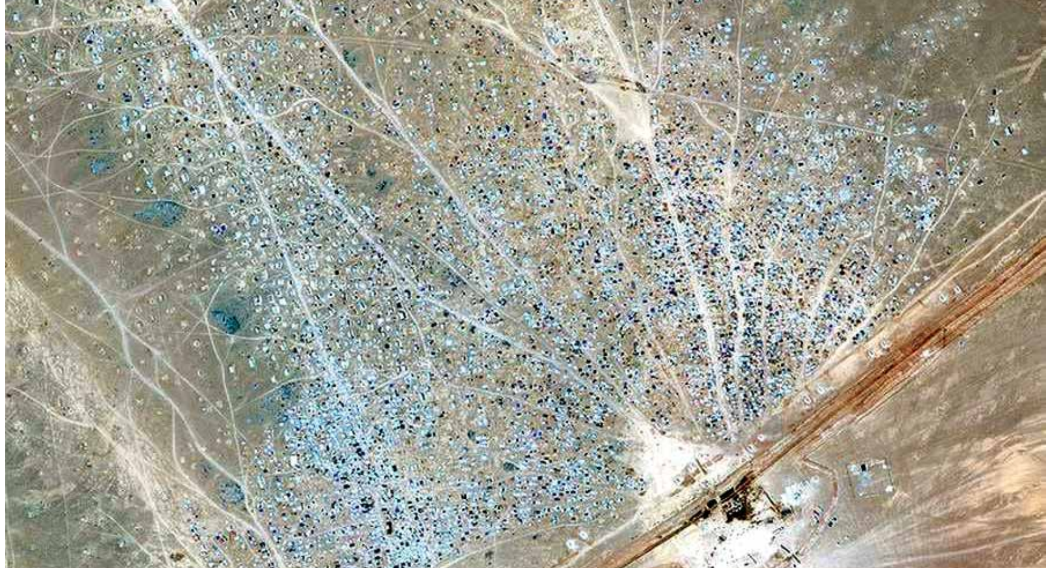
النظام استهدف المدارس بشكل متعمد - انترنت

وفي أعقاب الهجوم أغلق الأردن حدوده مع سوريا معننا المنطقة «منطقة عسكرية مغلقة»، ومنع مرور أي مساعدة إلى هذا المخيم. وأتذاك، لم تسمح عمان بالإمرار بعض المساعدات الإنسانية نزولاً عند طلب الأمم المتحدة.