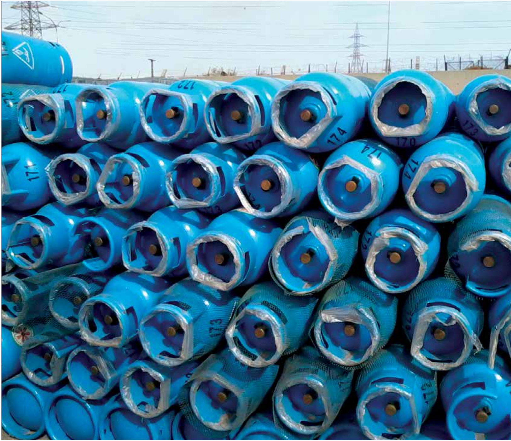
ضباط النظام يهربون الغاز

اليوم، كما تقوم بتحديد عدد لترات الوقود من البئزين والمازوت، وأخيرا كان الحل حول أزمة الغاز منع بيع العائلة أكثر من اسطوانة واحدة كل خمسة عشر يوما.