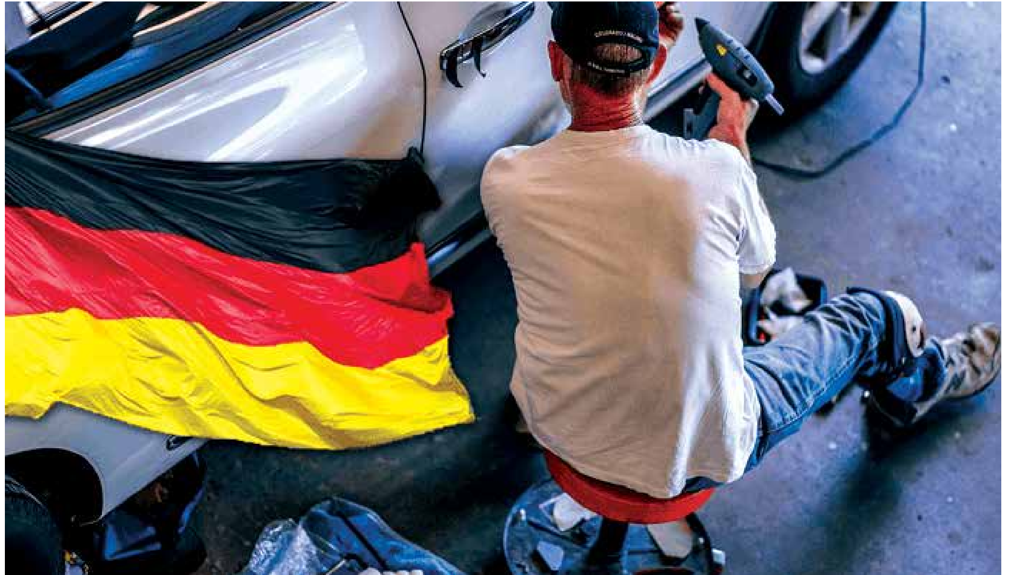
يجب الخضوع للاختبار - انترنت

وليس من السهل وضع موطن قدم في سوق العمل الألماني بدون أوراق رسمية. وفي الماضي لم يكن هناك نظام موحد في كل ألمانيا لقياس المهارات العملية في كل مهنة. وبحسب «مهاجر نيوز» في هذه الأيام يحاول المكتب الاتحادي للعمل ومؤسسة بيرتلسمان تغيير ذلك؛ إذ ابتكروا اختبارا