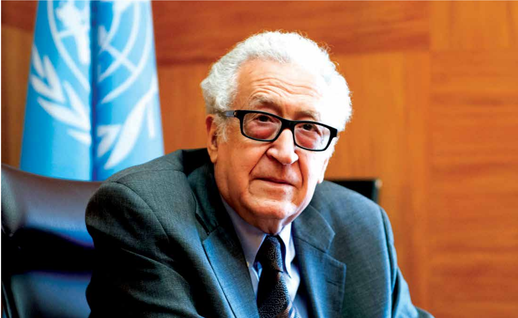
جاء خلفاً لكوفي عنان - انترنت

مر ما يقارب ثمان سنوات على عمر الثورة السورية، التي بدأت باحتجاجات شعبية واسعة، وتطورت بعدها لانتجته نحو التسليح، في السنوات الأولى للثورة، توافقت المظاهرات الحاشدة في البلدات والمدن السورية، مع تقدم واسع للمعارضة السورية المسلحة على الأرض والنحسار المناطق التي يسيطر عليها نظام الأسد. أما في مرحلة ما بعد عام ٢٠١٥، فقد عاد النظام للتقدم من جديد، مستفيداً من عاملين رئيسيين وهما التدخل العسكري الروسي المباشر إلى جانب النظام، إضافة إلى ظهور تنظيم «داعش» في شمال وشمال شرق سوريا، وتمده على حساب المعارضة وإرهاقها، حتى انتهى الأمر باستعادة النظام لمعظم المناطق التي خسرها لصالح المعارضة سابقاً في حين انحصرت الأخيرة في الشمال السوري بمحافظة حلب وإدلب.