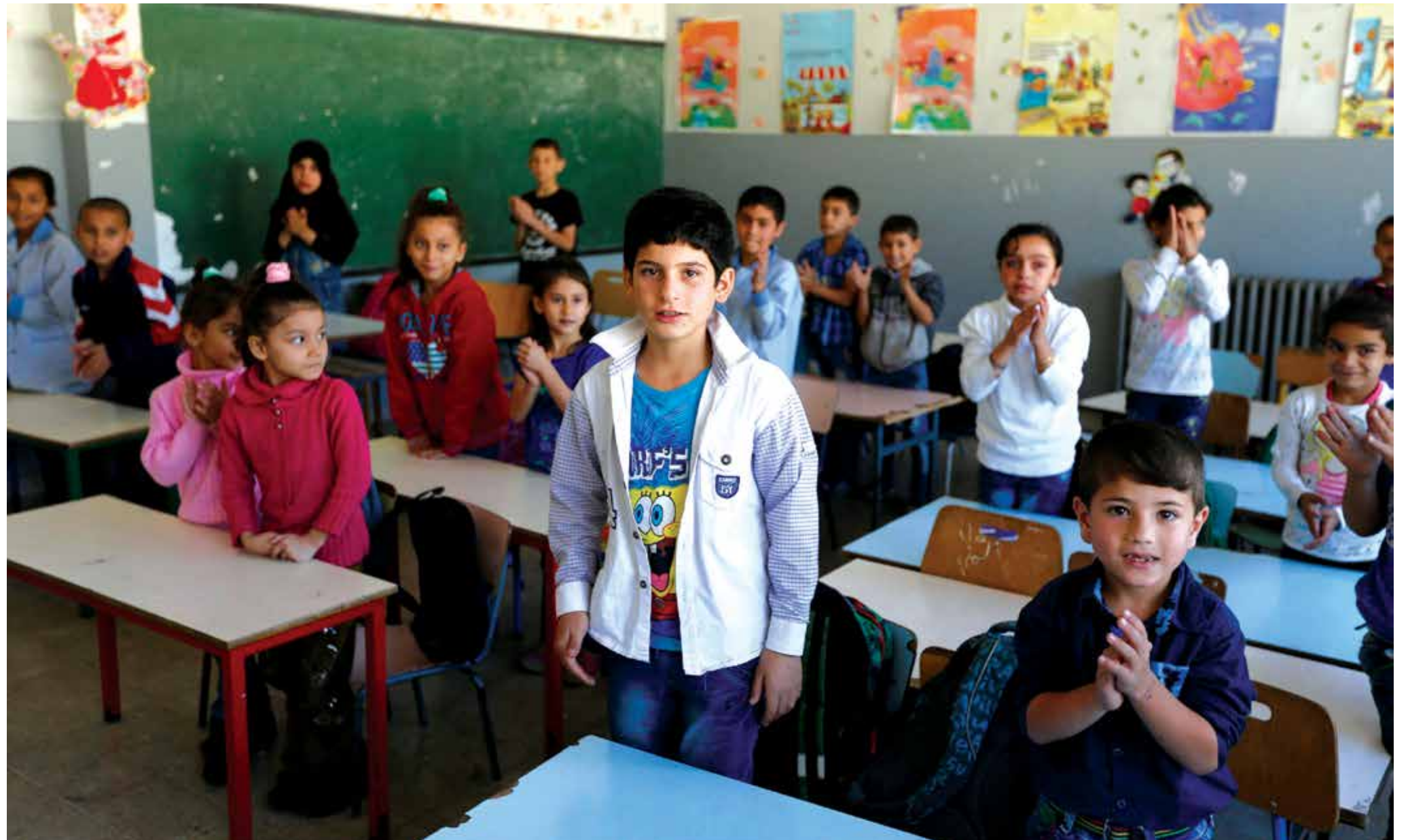
أغلقت الحكومة اللبنانية العديد من البرامج

وفي سبتمبر/أيلول، قررت الوزارة أنها لن تقبل الطلاب السوريين الجدد، ولكنها