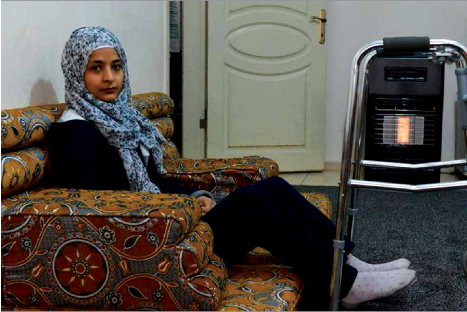
تمكنت من المشي

ويتلقى آلاف السوريين العلاج في تركيا ومن بينهم آلاف الأطفال الذين