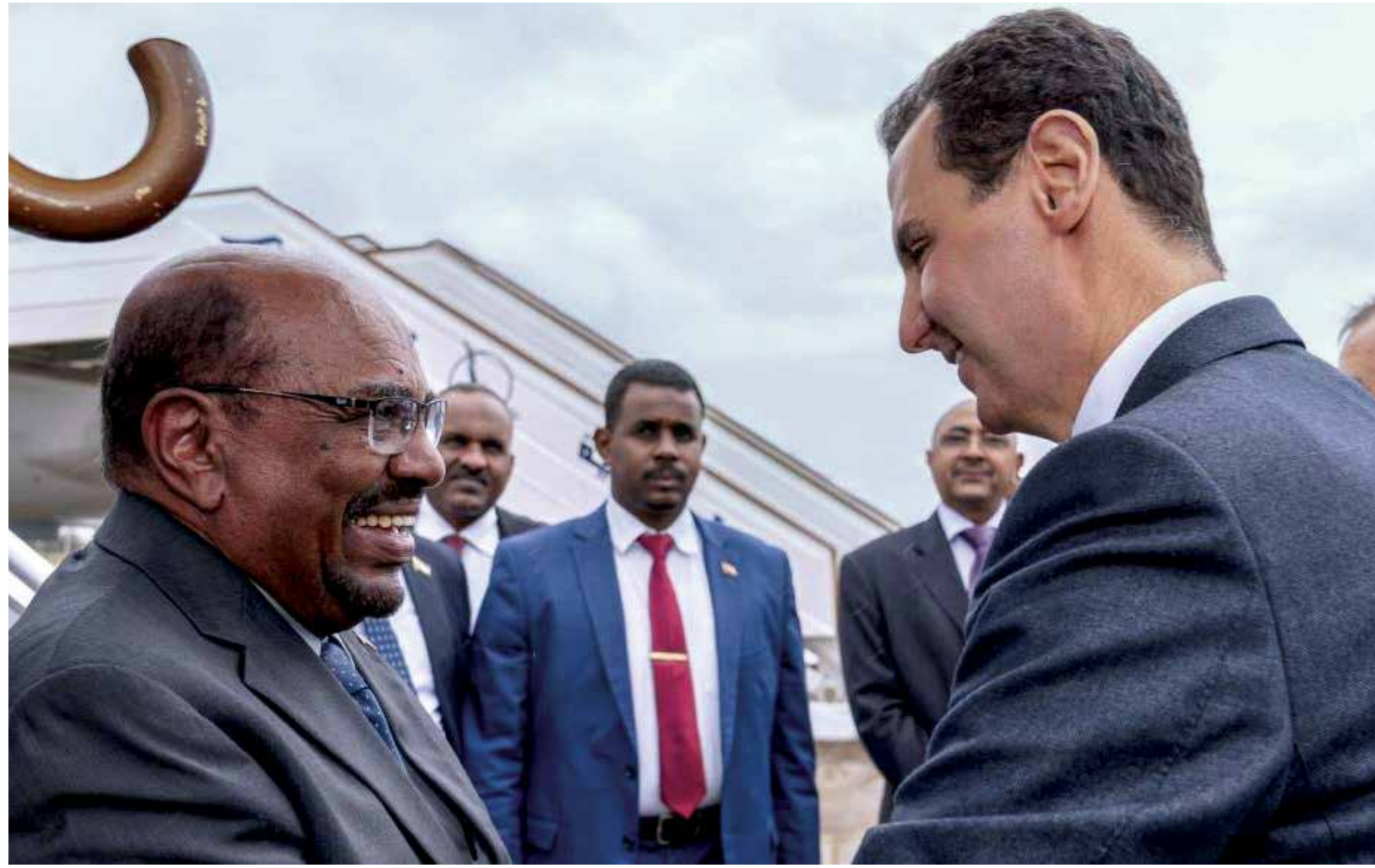
الزيارة الأولى منذ اندلاع الثورة ضد الأسد - انترنت

بالدوحة « سنتخذ كل التدابير اللازمة من أجل سلامة حدودنا، ليس من أجل مصالحنا فحسب، بل من أجل وحدة الأراضي السورية أيضاً».