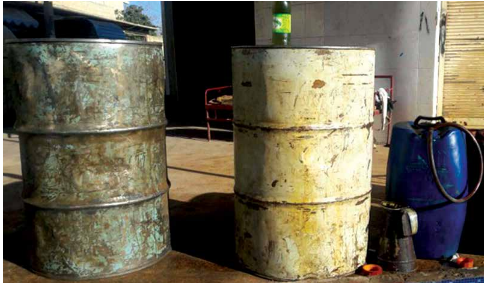
سعر برميل المازوت ٥٢ ألف ليرة - انترنت

وشنكى مديون لـ«صدى الشام» معاناتهم مع انقطاع المحروقات بسبب ارتفاع أسعارها، تزامنا مع هجمة برد قارس على المنطقة.