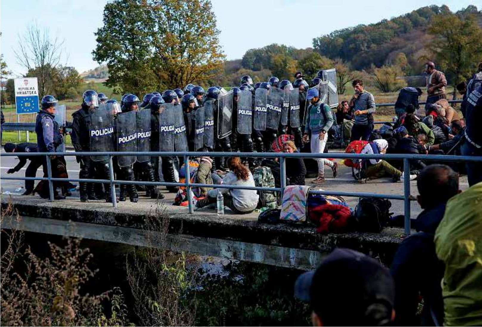
الشرطة الكرواتية - انترنت

وأخذ بيانات مفصلة عنهم كأسمانهم وبلدانهم الأصلية وأعمارهم والطرق التي سلكوها للوصول إلى كرواتيا. ولم يتم إعطائهم نسخ عن البيانات التي جمعت عنهم. وأفاد المهاجرون أنهم احتجزوا في غرف لا يوجد فيها أثاث لفترات تراوحت بين ساعتين و24 ساعة، ليتم نقلهم لاحقا إلى المنطقة الحدودية. وثلاثة من الذين استجوبهم التقرير قالوا إنهم طلبوا اللجوء في كرواتيا إلا أن رجال الشرطة تجاهلهم أو ضحكوا في وجوههم.