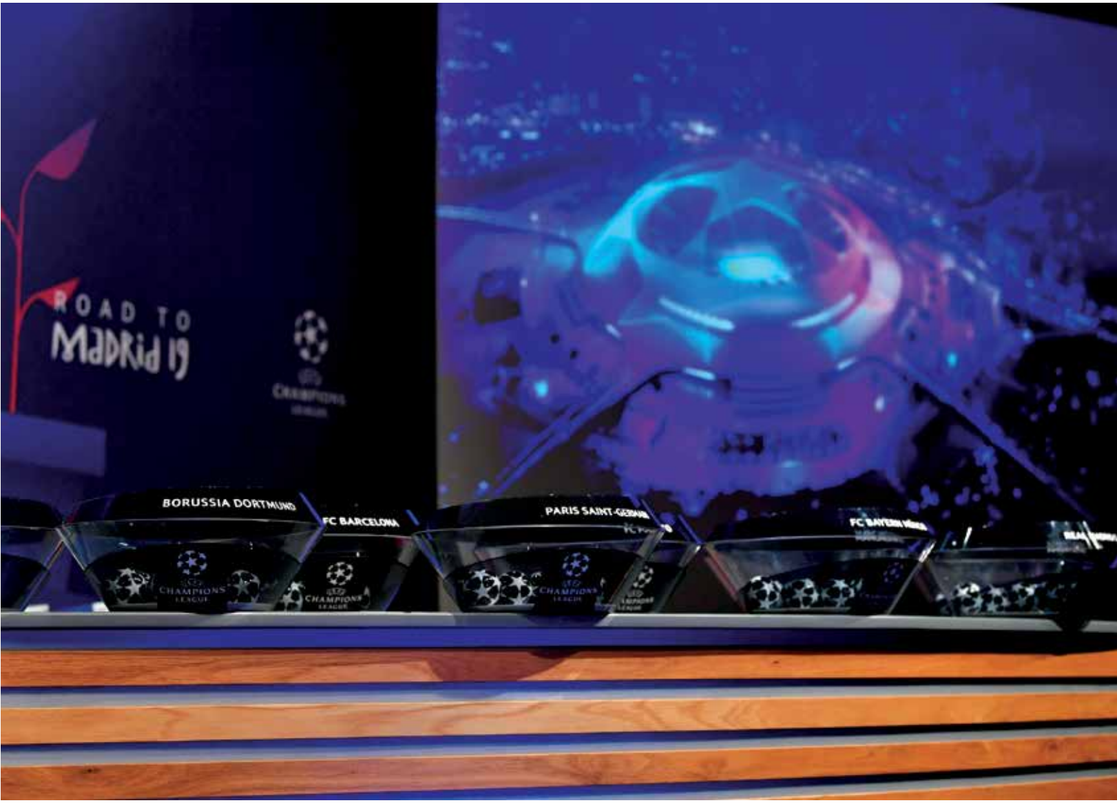
أقيمت القرعة في نيون السويسرية - أنترت