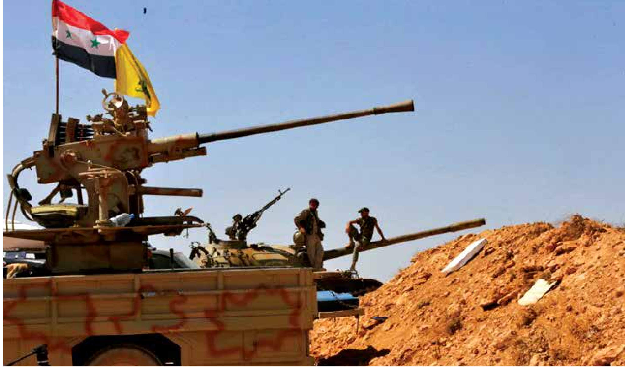
صفقة بين موسكو وطهران

وخلال حديثه عن المقاتلين الجدد والألعاب الإلكترونية، أكد فنيش على ضرورة استخدام تقنيات جديدة للتأثير على عقول الشباب والمراهقين وإعادة كتابة التاريخ فيما يتعلق بالأسباب والكيفية التي دخلت بها حركة المقاومة إلى سوريا. وأورد الموقع أن هذه الإستراتيجية تم اعتمادها من قبل تنظيم «داعش»، في أواخر سنة 2014، حيث قام اتباع التنظيم بتطوير نسخة جديدة للعبة «جراند ثفت أوتو»، والتي تضي حرقيا «سرقة السيارات الكبرى». وفي هذه اللعبة، عرض الأشخاص الذين قاموا بتطوير هذه النسخة على اللاعبين القيام بمجموعة من المهام بالنسبة عن «الذنب الوحيد» الذي يرتدي وشاح رأس أسود اللون، وقميصا بنفس لون الشاح وسراويل خاصة. ومن المهام الموكلة للذنب الوحيد: مهاجمة الشرطة والجيش.