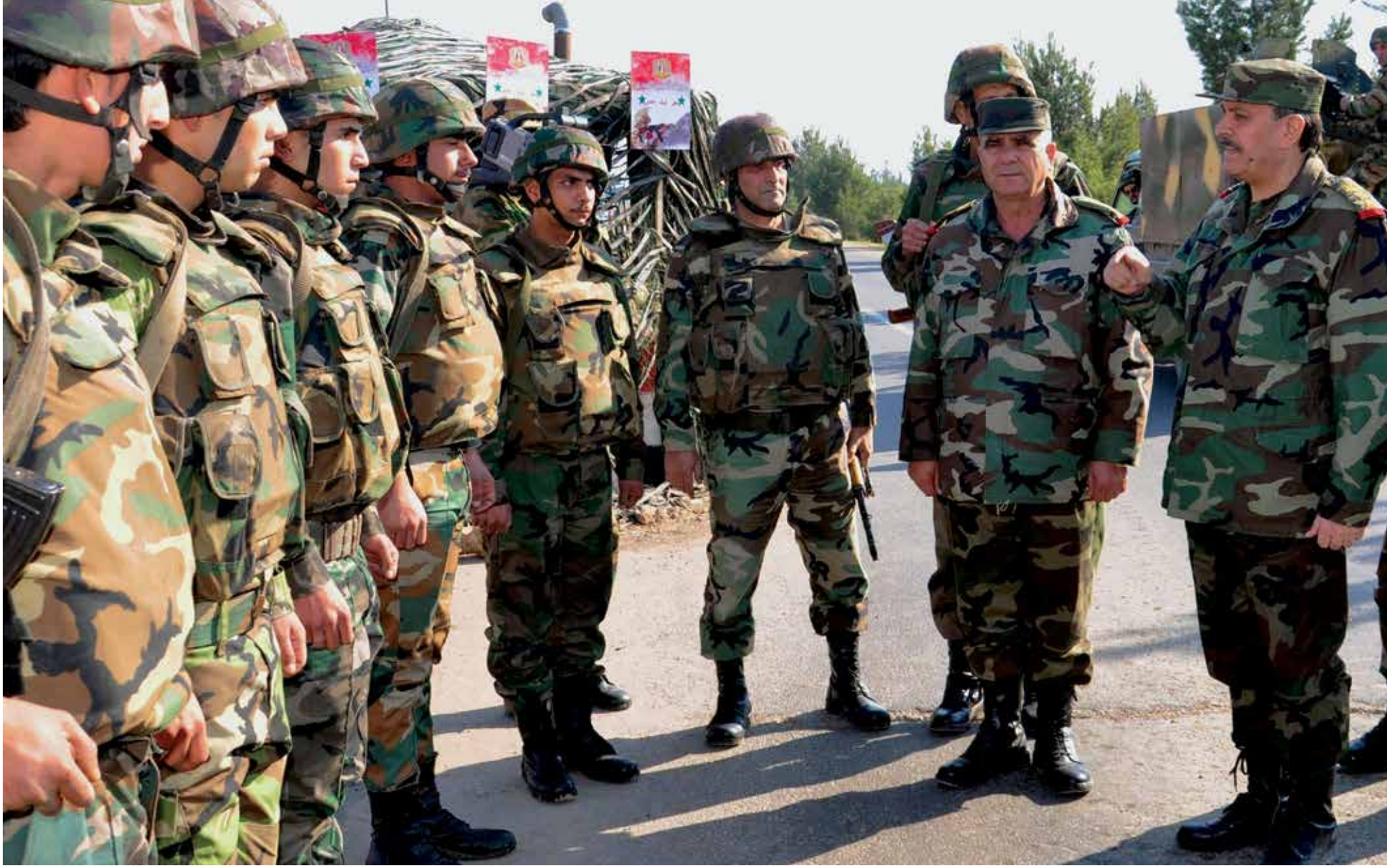
النظام يلاحق الشباب بالاحتياط والتجنيد