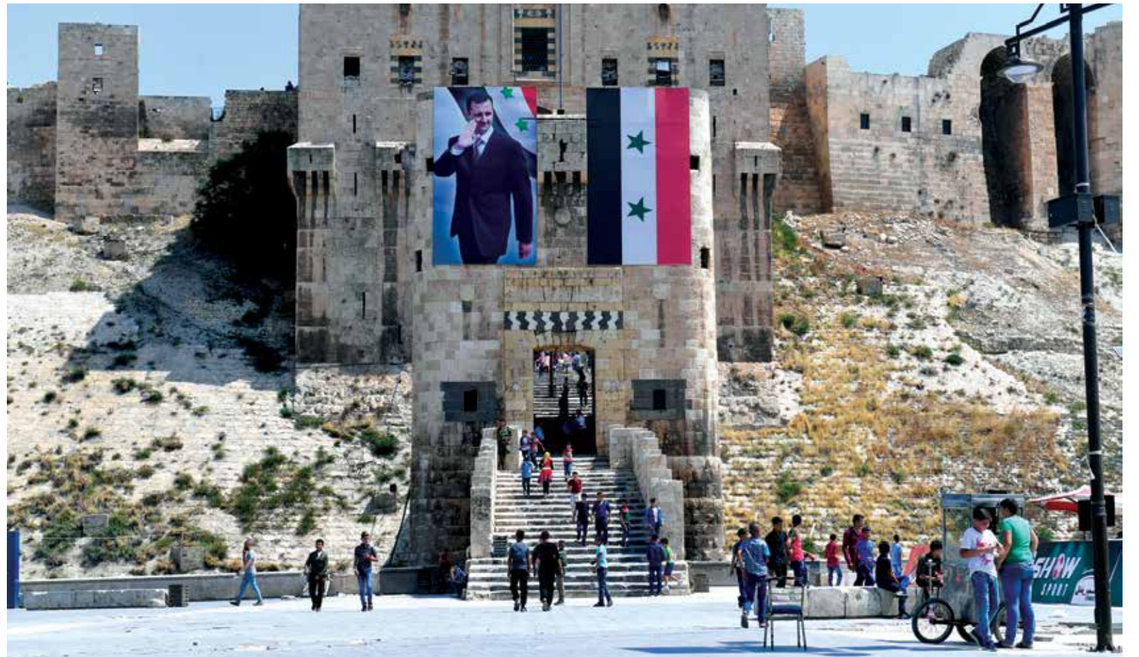
ميليشيات النظام تسيطر على حلب

ونقل الموقع في تقرير عن مصادر قولها إنه «بتمركز عشرات الحواجز في مداخل المدينة الرئيسية، وتحيط بالتجمعات الصناعية والتجارية، وتنتشر بشكل خاص على الطرق التجارية، وتعود الحواجز في الغالب لميليشيات «لواء الباقر»، و«لواء