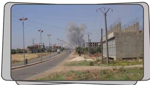
الغارات الجوية التي استهدفت بلدة المسيفرة شرق مدينة درعا