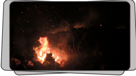
اندلاع حريق ضخم في جبل العقبة الواقع على طريق «حارم - كفر تخاريم» بريف إدلب الغربي