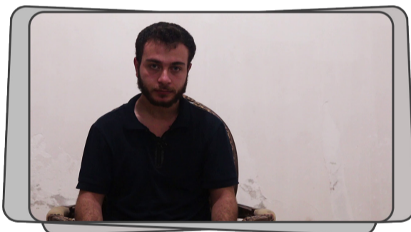
الجهاز الأمني التابع لهيئة تحرير الشام يلقي القبض على أحد عملاء النظام المجرم أثناء محاولته عبور المناطق المحررة منطلقاً من تركيا باتجاه مناطق سيطرة النظام