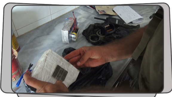
تحرير الشام تضبط مواد أولية وعبوات وأحزمة ناسفة معدة للتفجير من أوكار الخوارج بريف إدلب