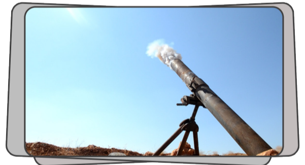
سرية المدفعية التابعة لهيئة تحرير الشام تستهدف بقذائف الهاون تجمعات النظام المجرم في قرية باشمرة شمال حلب