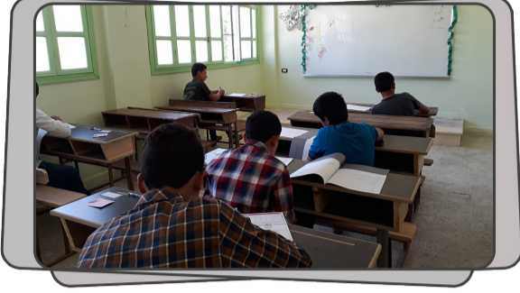
تأدية الامتحانات لطلبة الشهادة الإعدادية في ريف إدلب الجنوبي