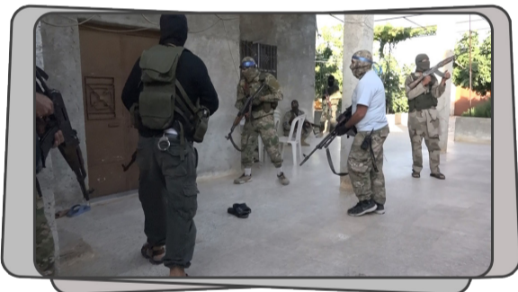
الجهاز الأمني لـ تحرير الشام يدهم أوكار الخوارج في ريف مدينة إدلب