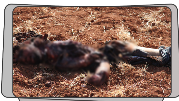
جثة الخارجي الذي فجر نفسه بحزامه الناسف بعد محاصرته من قبل مجاهدي تحرير الشام