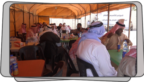
تشكيل مجلس شورى القبائل والعشائر السورية برعاية الهيئة التأسيسية للمؤتمر السوري العام