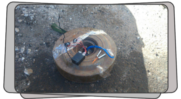
سرية الهندسة التابعة لهيئة تحرير الشام تفكك عبوة ناسفة مزروعة بدبابة لأحد الفصائل في مدينة إنخل شمال درعا