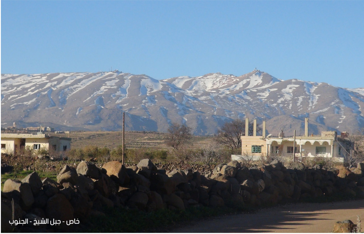
خاص - جبل الشيخ - الجنوب

القوم بعرضهم المغتصب، وأرضهم المحتلة، فلا خير في حياة لا كرامة فيها، ولا حديث عن أمنٍ عند ضياع الحرية. كانت درعا، ولا زالت، أمل الثورة وقلبها النابض بالحياة.. وإنها لأجدر بكسر هجمة النظام، وإعادة الأمل والروح القتالية إلى الشعب السوري المضطهد، والأمة الإسلامية بأسرها. صبرا أهل حوران، صبرا فإن موعدكم النصر بإذن الله.