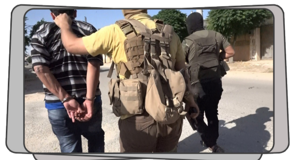
أحد عناصر الخوارج في قبضة تحرير الشام بعد مدهمة أوكارهم بريف إدلب