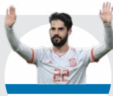
فرانك ريبيري لاعب نادي ريال مدريد