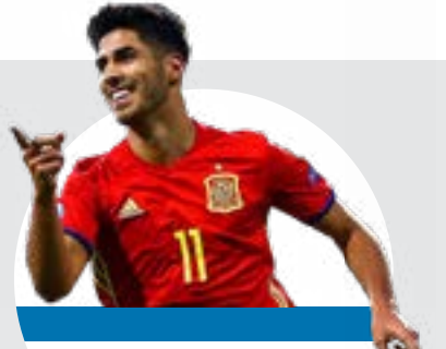
ماركو أسينسيو لاعب نادي ريال مدريد