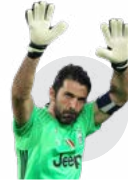
جان لويجي بوفون