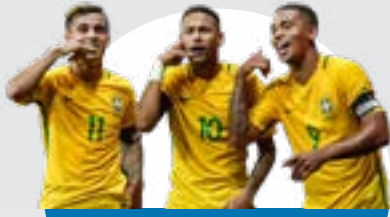
البرازيل في المرتبة الثانية