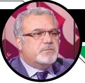
فادي ترامب وقرار