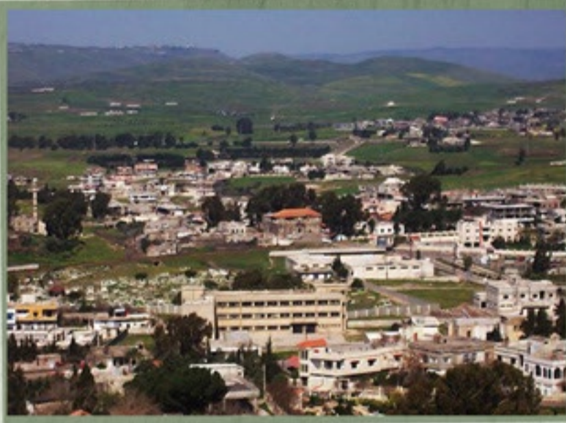
ساحة باب الدريب عام 2013

أحكم الحصار حول تلكلخ بالحواجز والشبيحة ومفارز الأمن ، كما تعرض نشطاؤها و أئمة مساجدها للتعذيب والاعتقال ، قصفت تلكلخ مرتين تزامناً مع قصف الرستن وريف حماه عام 2012 والحملة غير المسبوقة التي تعرضت لها بعد اجتياح القصير حيث تمكن النظام مدعوماً بميليشيات من حزب الله