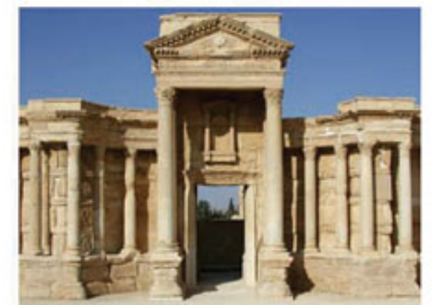
تدمير آثار مدينة تدمر ص (٢)