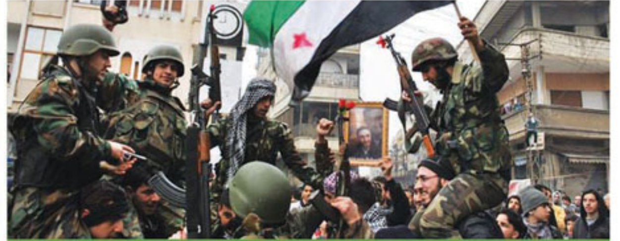
أهم عمليات الجيش الحر ص (٦)