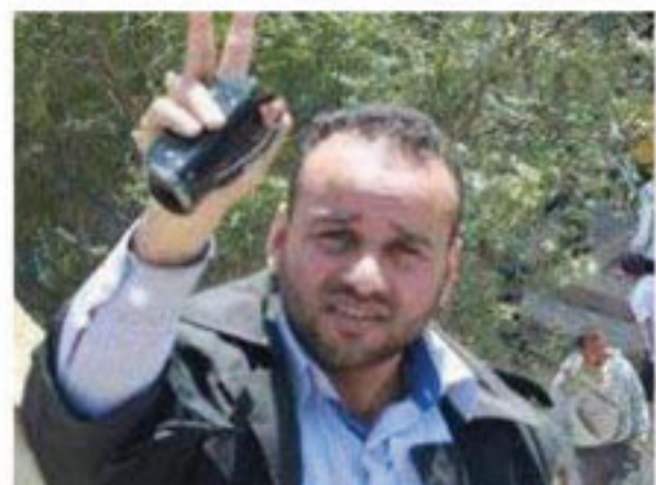
شهداء الحقيقة ص (٩)