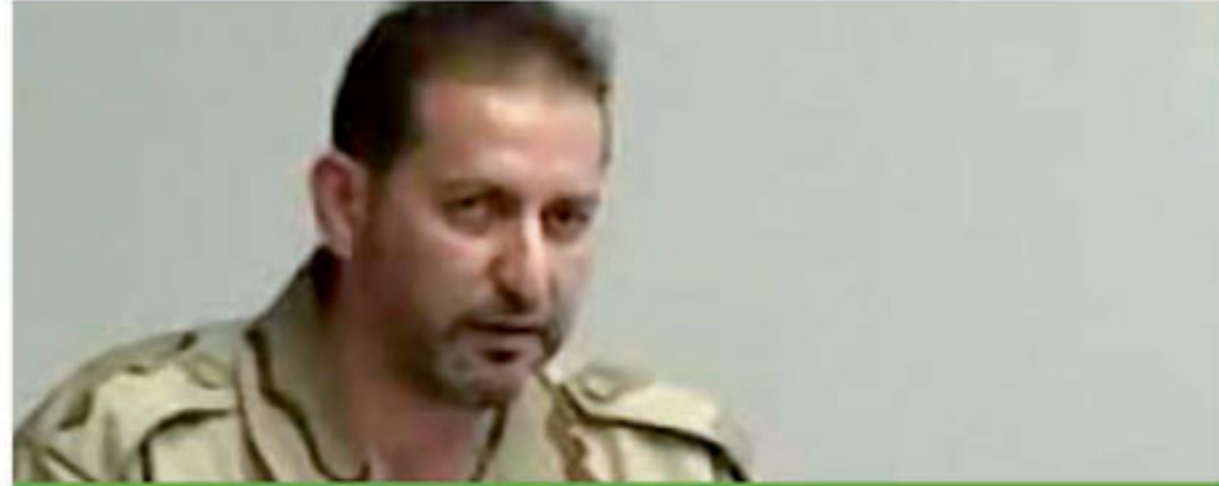
نبض الشارع الحمصي ص (٤)

ثورية - مستقلة - نصف شهرية تصدر عن المركز الإعلامي التخصصي - حمص العدد السادس عشر ٢٠١٣/٥/١٥