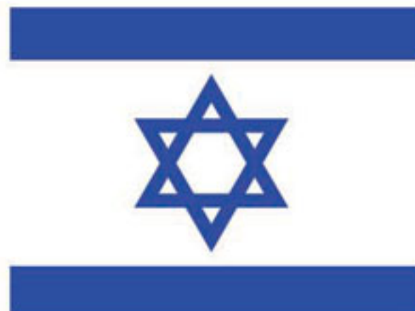
الغارات الصهيونية على الثورة ص (٧)