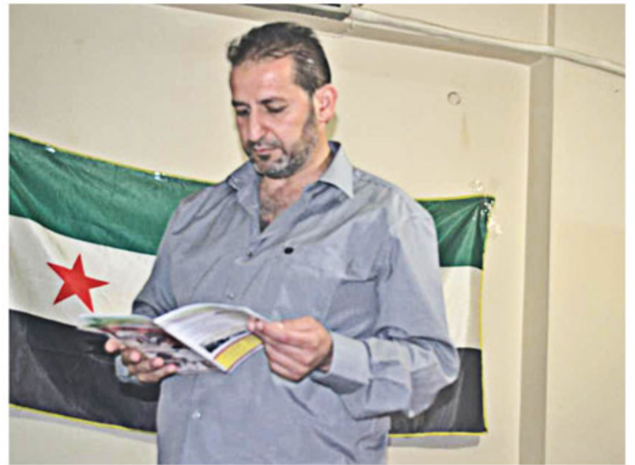
أثناء زيارة العقيد لمكتب نقابة محامي سوريا الاحرار