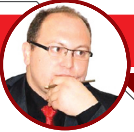
محمد زاهد جول

كاتب ومحلل تركي - رئيس بيت الإعلاميين العرب في تركيا