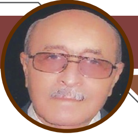
دير الزور تذبج