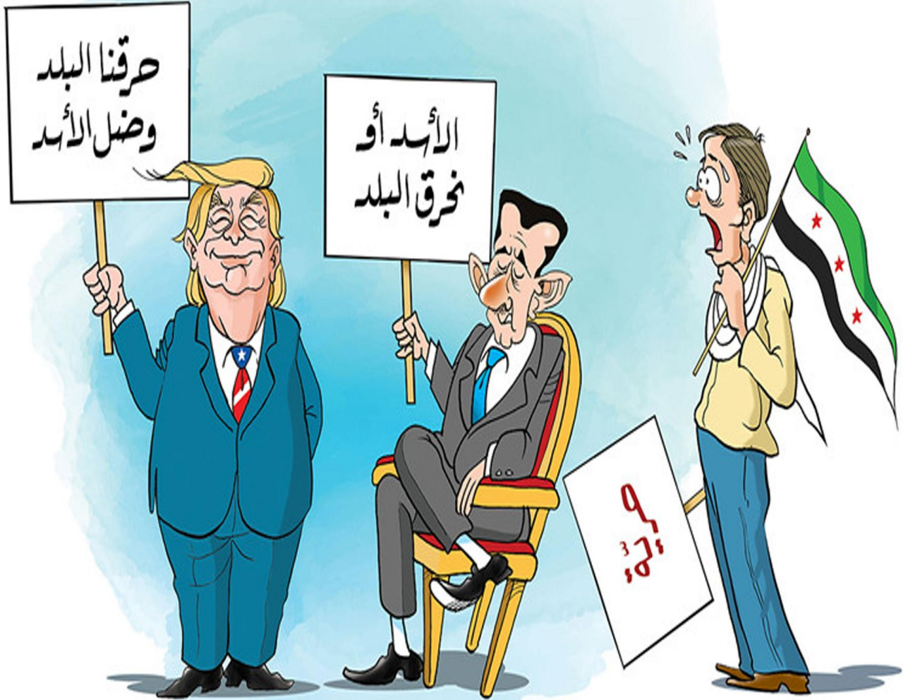
الأسد.. أو نحرق البلد.. كاريكاتير بريشة د. علاء اللقطة - صحيفة نبأ