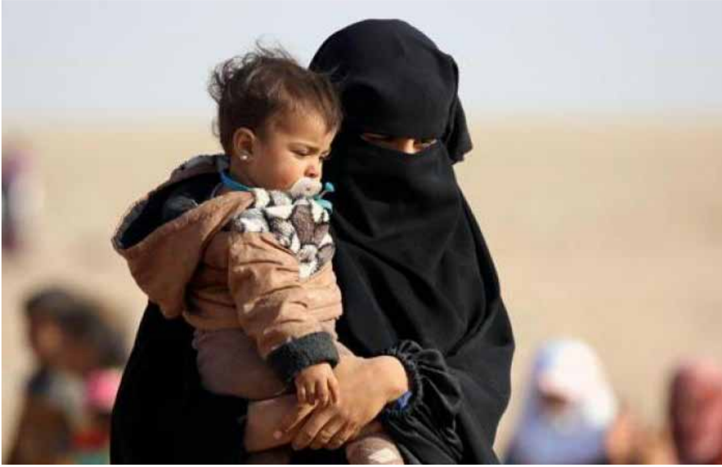
صورة تعبيرية لسيدة سورية في ريف حماة

وفي ظل تزايد المسببات التي تساهم في لجوء أحد الطرفين إلى الطلاق، سعت المحاكم الشرعية في المناطق المحررة إلى محاولة الصلح قبل منح حكم الطلاق، وقال المصدر المطلع في