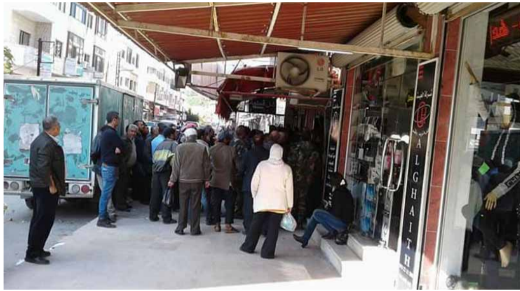
ازدحام في مدينة القدموس بريف طرطوس للحصول على المتة