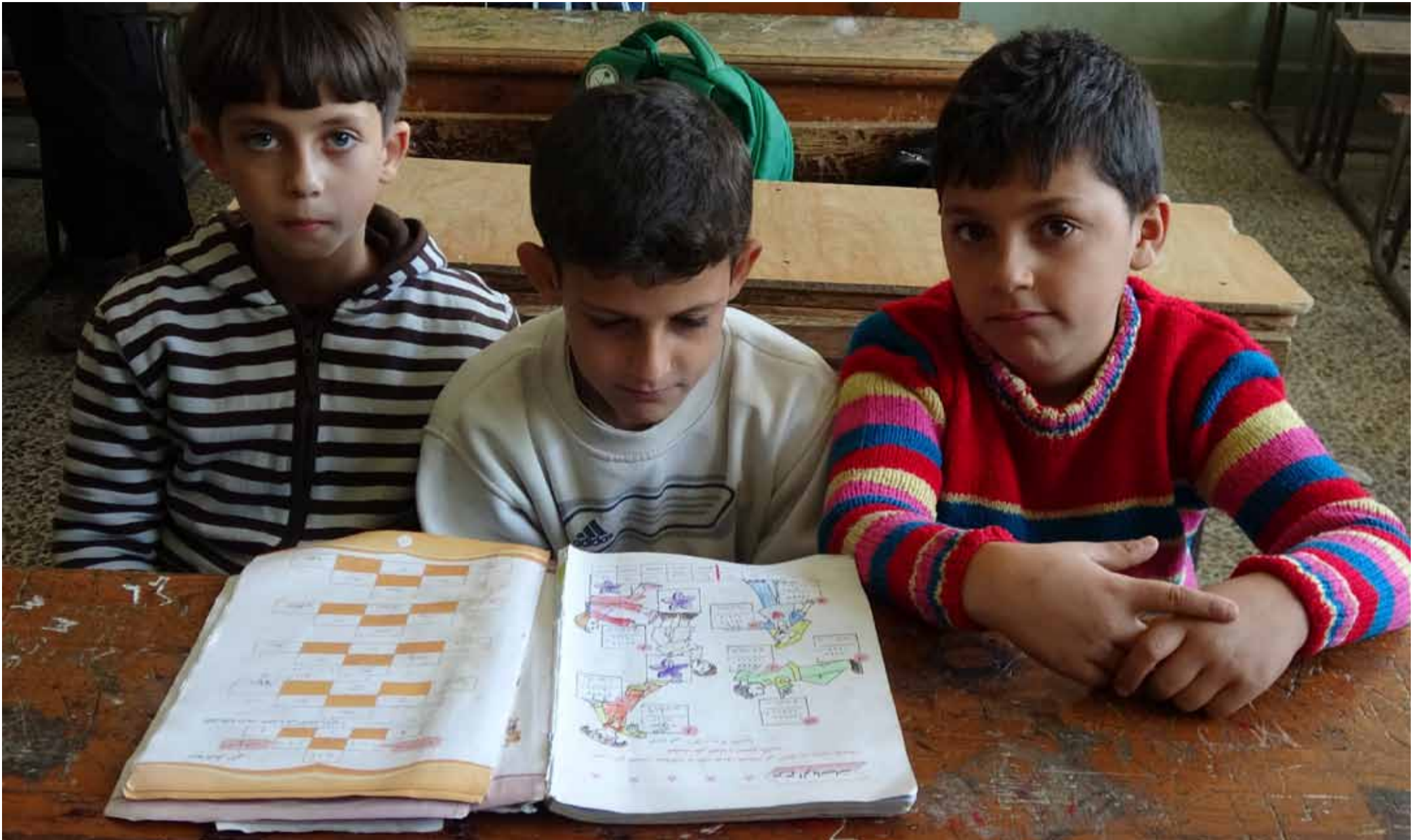
تلاميذ في إحدى مدارس مدينة إدلب الابتدائية