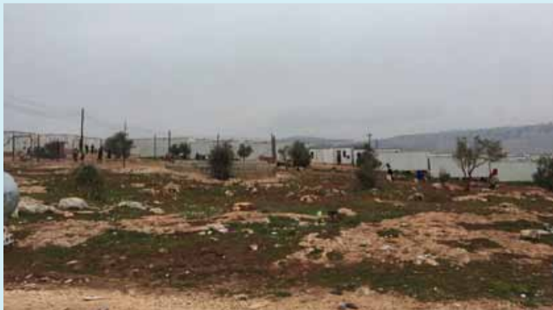
مخيم عائشة أم المؤمنين | سوريانا

إخراج أطفالهن الذكور حال بلوغهم الخامسة عشر من العمر». الخدمات المتوفرة في المخيم لم تمنع إحدى المقيمت فيه، والتي فضلت عدم الكشف عن اسمها، أن تقول «هو سجن كبير، لكن لا حل أمانا سوى البقاء فيه، والأرامل المقيمت هنا يعشن ظروف نفسية صعبة»، وتضيف «أفكر يوميا بالخروج لكن إلى أين، ومن سيعيل أطفالي الأربعة؟».