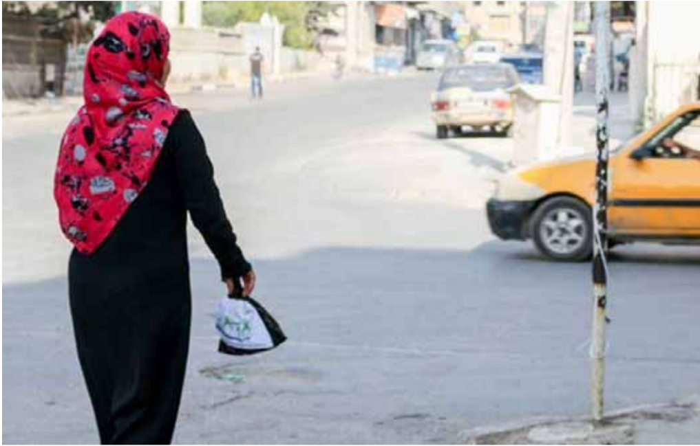
سيدة في مدينة إدلب بعد مراجعتها لجمعية بناء ونماء للحصول على المعونة

حاجة، وتقدم الجمعية لهم مبلغ 150 ليرة تركية شهريا، وتوفر للبقيّة دعم طبي من طبيب أطفال وطبيبة عامة إضافة للدواء المجاني».