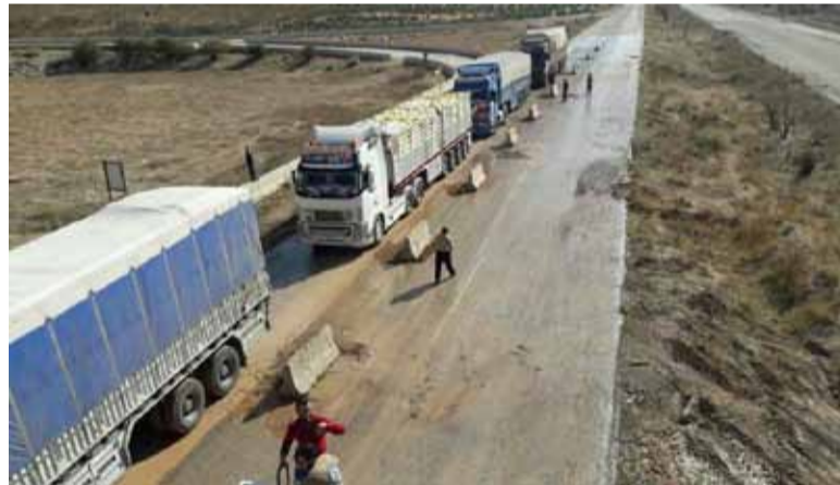
شاحنات في مورك تنتظر المرور من طريق حماة - إدلب الدولي | 12 تشرين الثاني 2017 | مركز مورك الإعلامي

في حين رد النظام بقصف عنيف على كفرزيتا واللطامنة وقلعة المضيق والزياره وحصرايا والجنيانة والرهجان والجزدانية والتينة وقصر بن وردان في ريف حماة. كما أعلنت «هيئة تحرير الشام» عن تمكنها من استعادة السيطرة على تلة حجيلة بالريف الشرقي، بعد اشتباكات مع عناصر «تنظيم الدولة»، وكبدهم خسائر في الأرواح.