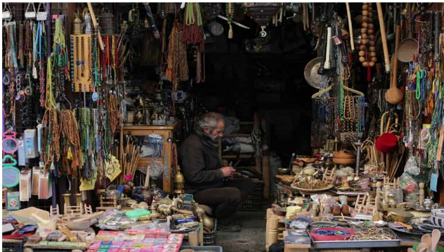
لأحد محال سوق العصرية في دمشق القديمة

في الليل جلست إلى جوار والدتي، لم أستطع منع نفسي أكثر، وسألتها: «لماذا؟»، ردت «إنهم لاجئون»، لم أفهم، كيف يكونون لاجئين؟ وما معنى اللجوء في حالتهم، وممن لجأوا؟ ولمن؟، «لا يستطيعون العودة إلى سوريا منذ أكثر