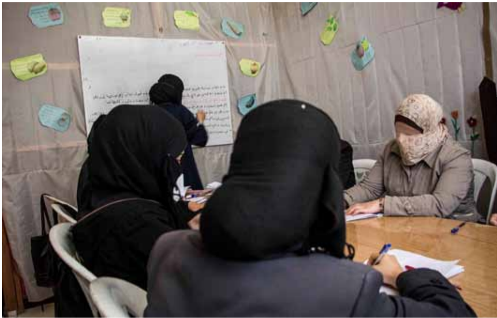
أحد أنشطة جمعية الحياة في مركز بيت سوي في الغوطة الشرقية | صفحة الجمعية على فيس بوك

ولا يقف نشاط المركز عند هذا الحد، بل يقدم دورات لمحو الأمية في صفوف نساء الغوطة، لتشجيعهن على اكتساب مزيد من الخبرات التي قد يحتجنها في