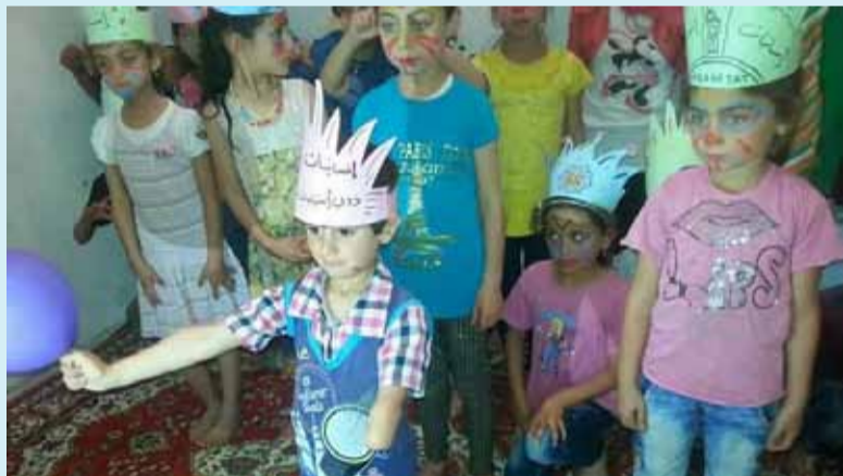
أطفال في مركز «إنسانيات» للدعم ذوي الاحتياجات الخاصة