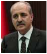
نعمان قورتلوش وزير السياحة التركي

«عندما كنا نحارب المثلثين ونهتمهم بالعمالة منذ أن دخلوا البلد، كان الكثير من أعياء الحلول الوسط ينتقدون فعلنا، ها هي النتيجة أن هؤلاء المثلثين دمروا الثورة تحت غطاء ما جئنا إلا لنصركم، وسلموا المناطق المحررة بعد اغتصابها ممن حررها، وفروا هاربين دون لثام ولم يتركوا دليلاً عليهم، فكم من الجناية جناها على أنفسهم هؤلاء أعياء الإنصاف، والمصيبة أنهم لم يستفيقوا إلى الآن».