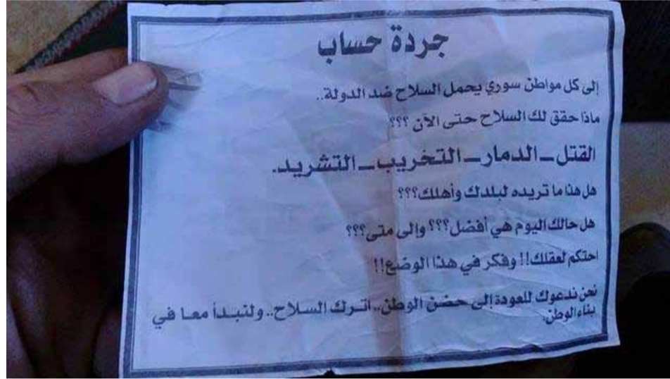
صورة نشرها ناشطون للمنشور التي تلقوها طائرات النظام على الغوطة الشرقية

داخلية عديدة، قادت بدورها إلى هجرة معظم الشباب السوري خارج سوريا.