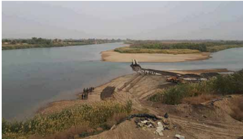
عناصر النظام يحاولون إقامة جسر للوصول إلى منطقة حويجة كاطع | 9 تشرين الثاني 2017

من جهة أخرى يتواصل السباق نحو البوكمال، حيث سعت قوات النظام إلى استباق الأحداث، وأعلنت عبر وسائل إعلامها سيطرتها على مدينة البوكمال قبل انتهاء وجود «تنظيم الدولة» فيها، إلا أن الأخير باغت عناصر النظام بهجوم عنيف وتمكن من طردهم خارج المدينة، ما وضع النظام في موقفٍ محرجٍ أمام مؤيديه بعد إعلانه بياناً رسمياً حول السيطرة عليها. وقال الخبير العسكري إبراهيم: إن «النظام يسيطر على البوكمال نارياً وليس فعلياً على الأرض، وهو ما دفعه إلى إعلان السيطرة عليها عبر إعلامه، لكن التنظيم باغته بهجمات معاكسة