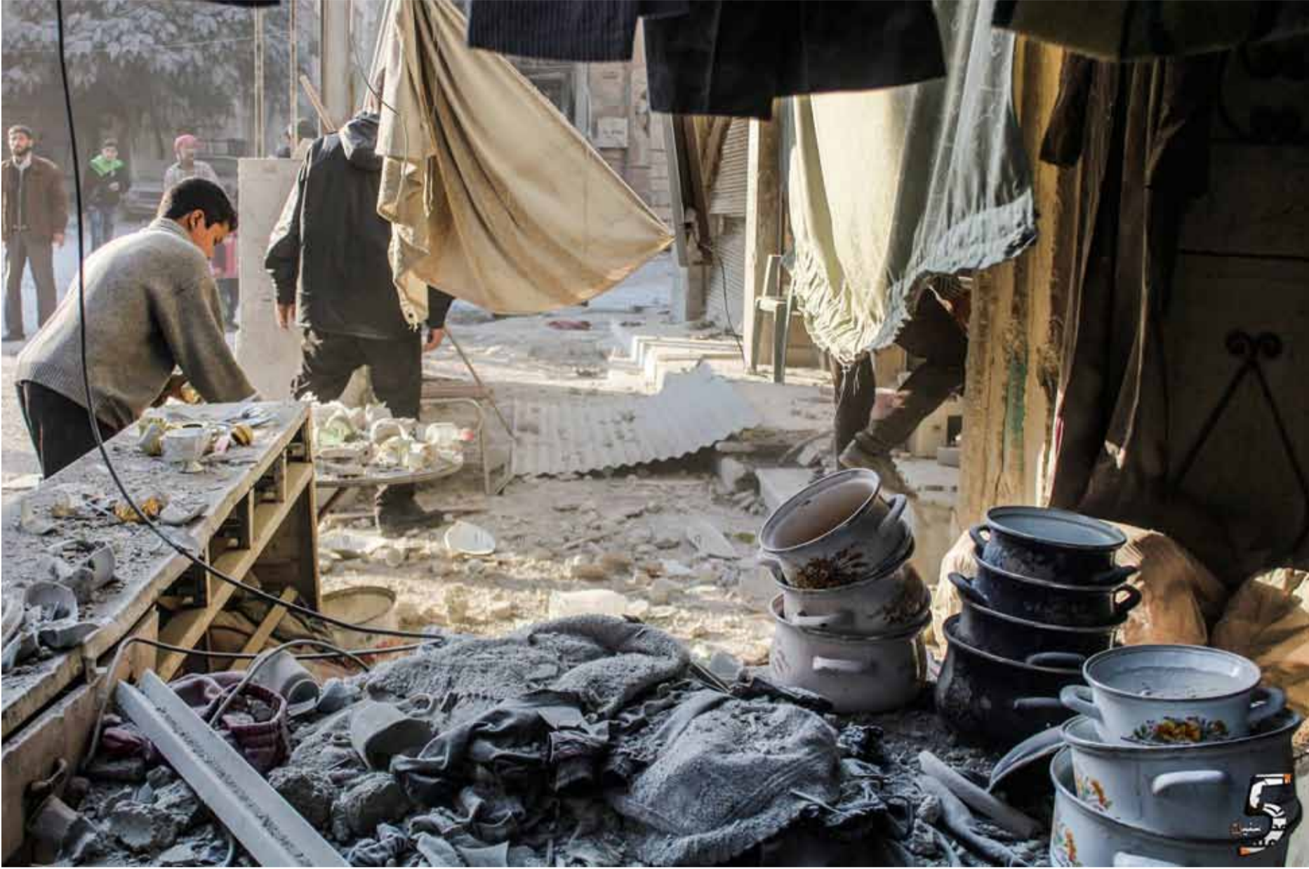
بعد قصف لطائرات النظام على الغوطة الشرقية | 2 تشرين الثاني 2017