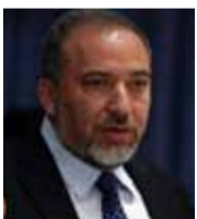
أفغيدور ليبرمان وزير الدفاع الإسرائيلي

«نستطيع إعادة إصدار تأشيرات دخول السوريين تركيا، إذا نجحنا في تشكيل مناطق آمنة للسوريين، وعادوا إلى أرضهم، وأسسنا سوريا آمنة قريباً، وتوقفت الاضطرابات السياسية».