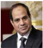
عبد الفتاح السيسي الرئيس المصري

«إسرائيل لن تسمح للمحور الشيعي بتحويل سوريا إلى قاعدة انطلاق أمامية، والنظام السوري مسؤول عن أي إطلاق للنار وانتهاك للسيادة، ونطالبه بلجم كل العناصر الفاعلة في أرضيه، وإسرائيل تنظر بعين الخطورة الشديدة لأي مساس بسيادتها، وسترد بقوة على أي تصرف استفزازي».