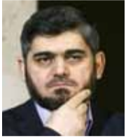
محمد علوش رئيس الهيئة السياسية «لجيش الإسلام»

«في جعبتنا لمؤتمر أستانا المقبل أمران لا ثالث لهما، إيقاف الخروقات والقصف المحررة، وكذلك ملف المعتقلين، ولن نقبل بفتح أي ملف آخر مالم نصل لحل بما جئنا من أجله».