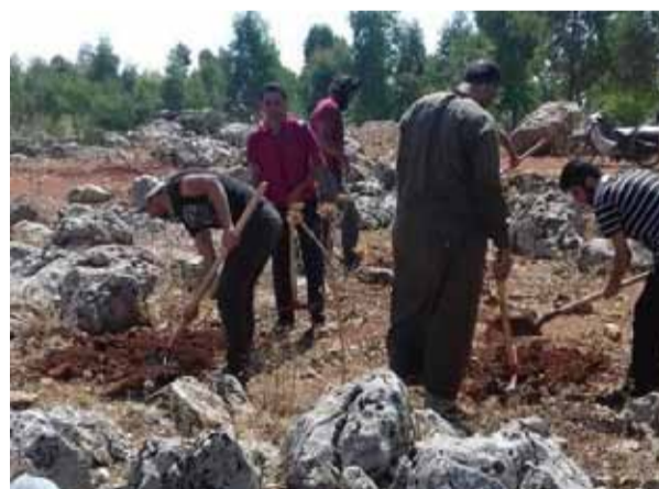
من حملة التشجير في كفرنبيل