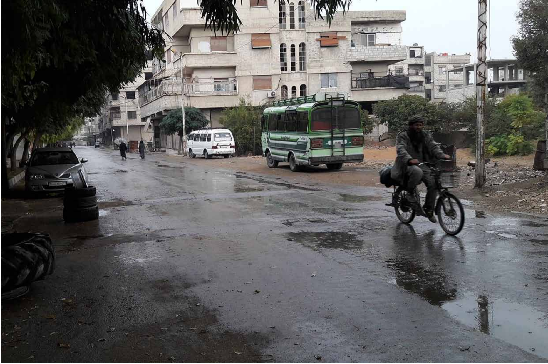
أحد أحياء الغوطة الشرقية بريف دمشق 28 تشرين الأول 2017 | عدسة براء الشامي