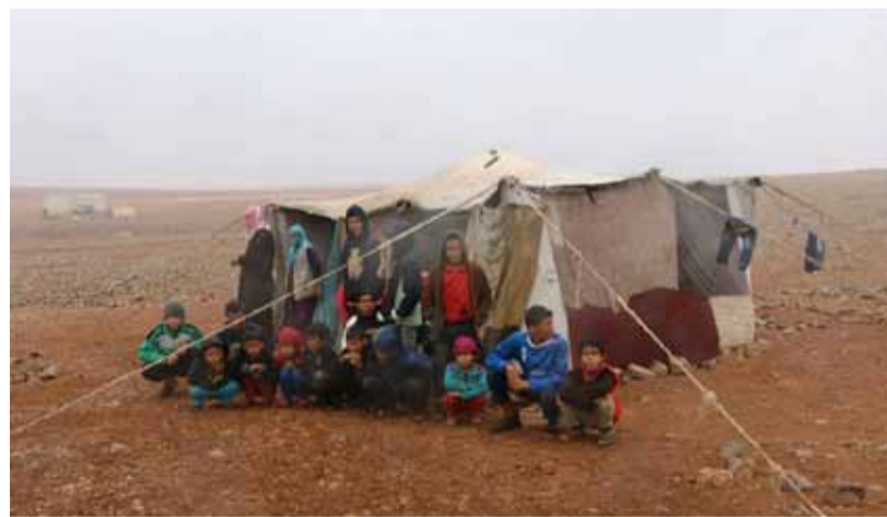
نازحون من ريف حماة الشرقي في ريف ادلب الجنوبي