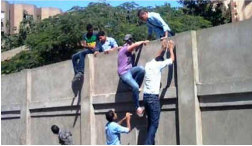
صورة تعبيرية تمثل هروب الطلاب من إحدى مدارس دمشق

وقال نازح آخر مقيم في مدينة حلب: «معظم السكان غير راضين عن تعليم أبنائهم في مدارس النظام ولكن ليس باليد حيلة، أما البعض ممن يريد رفع مستوى تعليم أولاده، فيدعم ذلك بالدروس الخصوصية، فهي أفضل من عدم».