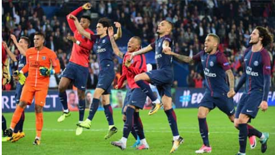
من مباراة باريس سان جيرمان واندرلخت في الجولة الرابعة من دوري الأبطال

ورفع بشكتاش رصيده في الصدارة إلى عشر نقاط، في حين حل بورتو ثانياً برصيد ست نقاط، أما لايبزيغ فظل في المركز الثالث برصيد أربع نقاط.