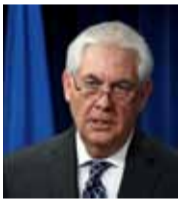
ريكس تيلرسون وزير الخارجية الأمريكي

«مؤتمر الحوار الوطني السوري سيكون داعماً لمفاوضات جنيف، ويجب على كل أطراف المعارضة أن تشارك فيه، وتجلس مع النظام السوري لحل القضية السورية. وصلنا إلى مرحلة من الاستعصاء في الأزمة السورية وهذا يستدعي لعقد مؤتمر الحوار».