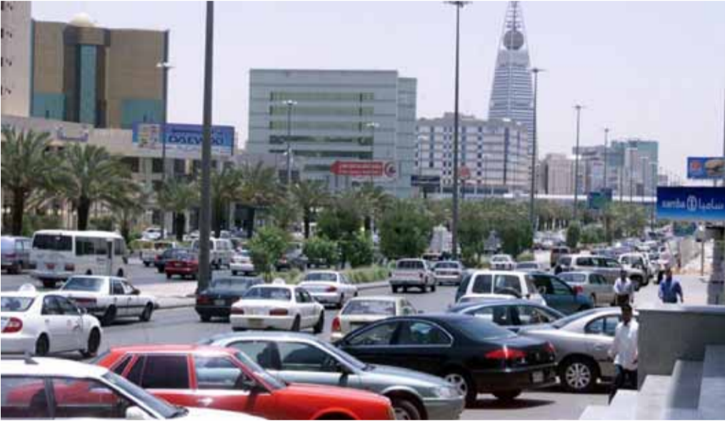
صورة تعبيرية من الإنترنت لأحد شوارع مدينة الرياض السعودية

فرضت الحكومة السعودية مؤخراً رسماً على كل موظف أجنبي تحت اسم (رسم المرافق)، قيمته 100 ريال على كل فرد من عائلته، الرسم الذي فرض اعتباراً من تموز 2017 ولمدة عام، سيتم مضاعفته ليصبح 200 ريال عن كل فرد لعام آخر، وفي السنة التي تليها 300 ريال للفرد، لتستقر الرسوم في عام 2020 على 400 ريال شهرياً عن