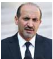
أحمد الجربا رئيس تيار الغد السوري

«تجه الأنظار نحو معركة البوكمال باعتبارها مرتبطاً بالفرس بتلك المنطقة، والتي تعد أحد طرفي بوابة الكورديور الإيراني الذي يصل طهران بدمشق وبيروت، فهناك تنسيق عسكري واستخباراتي عالي المستوى، بين ميليشيات الحشد الشعبي العراقي مع ميليشيات إيران والأسد لمعركة واحدة، لذا فإن حرب أمريكا على إرهاب إيران تبدأ بالبوكمال».