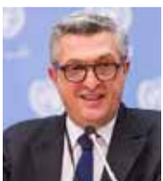
فيليبو غراندني مفوض الأمم المتحدة للشؤون اللاجئين

«الجيش السوري سيتقدم قريباً في شرق الفرات للسيطرة على مدينة الرقة، فالأمريكيون في تموضعهم شرق الفرات يسعون إلى تقسيم سوريا إلى جزأين، وكما لم ولن ينجحوا في العراق، فإنهم لن ينجحوا أيضاً في سوريا».