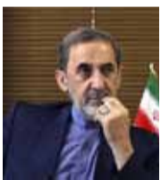
علي أكبر ولايي مستشار المرشد الإيراني للشؤون الدولية

«البيت الأبيض لا يحتاج تفويضاً من الكونغرس لعمل عسكري ضد الأسد، فحكمه في سوريا شأراً على النهاية، ولكن هدف واشنطن في سوريا حالياً، هو دحر تنظيم الدولة».