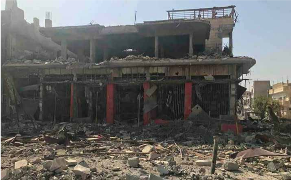
جانب من الدمار في حي الحديقة البيضاء بمدينة الرقة | 21 تشرين الأول 2017 | حملة الرقة تذبج بصمت

الكرديستاني (PKK) على كافة الفعاليات والهيئات المدنية. في حين أوضح مسؤول العلاقات في «مجلس الرقة المدني» أن «دمج المجلسين أمر غير ضروري، فلكل مجلس خدماته التي يقدمها سواء في الداخل أو الخارج». يذكر أن «قسد» أعلنت أن الرقة وريفها سيكونان جزءاً من سوريا «لا مركزية اتحادية»، لتتحول المدينة إلى جزء من المشروع الفيدرالي، كما نظمت احتفالية في دوار النعيم وسط الرقة، رفعت فيها صور لزعيم «حزب العمال الكردستاني» عبد الله أوجلان. ورفض وفد من شيوخ عشائر الرقة حينها، حضور الاحتفالية بسبب غياب أي ملامح عربية في الاحتفالية، ورفع الرايات الصفراء للتنظيمات الكردية، إضافة إلى صور أوجلان التي تصدرت المشهد.