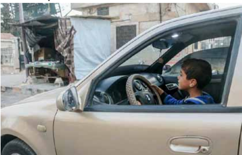
طفل يقود سيارة في أحد شوارع مدينة إدلب | سورييتنا

انتشار هذه الظاهرة أثارت استياء كثير لدى السكان، وازدادت مخاوفهم من القيادة المتهوره للأطفال عموماً، التي قد تؤدي إلى حادث دهس، أو وقوع مكروه للطفل نفسه الذي يقود.