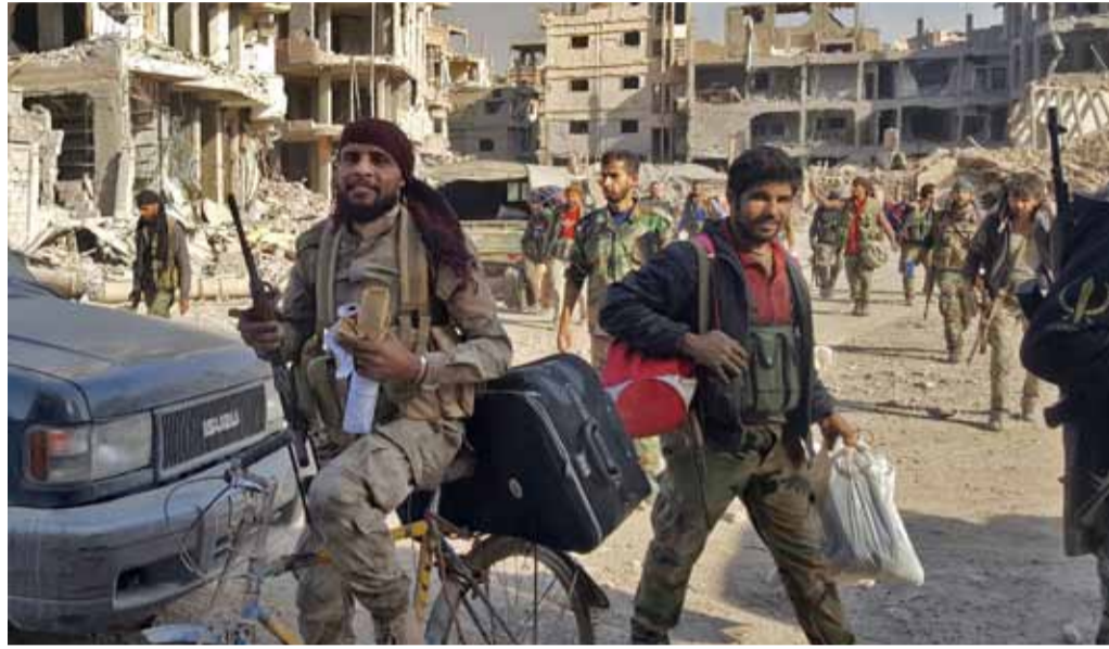
عناصر من قوات النظام داخل مدينة دير الزور | 3 تشرين الثاني 2017

وبعد سيطرة قوات النظام على المدينة، تراجع وجود «تنظيم الدولة» نحو الريف الشرقي للمدينة، ولا سيما في مدن القورية والعشيرة وهجين والبوكمال، والتي هي صلة الوصل بين غرب العراق وشرقي سوريا. ثلاثة أطراف تتصارع على البوكمال وبدأت قوات النظام مدعومة بالطيران