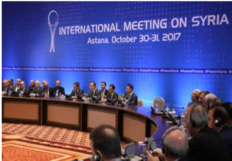
صورة أثناء جولة المباحثات في أستانا | 30 تشرين الأول 2017

بعد انتهاء مؤتمر «أستانا 7» دون أن يخرج بأي نتائج، سعت روسيا إلى توجيه الأنظار نحو مؤتمر ما يسمى «الحوار الوطني»، الذي دعت مختلف الأطراف السورية لحضوره بمدينة سوتشي الروسية في الثامن عشر من الشهر الحالي، بعد أن كان مقرراً عقده في حميميم بالساحل السوري تحت اسم مؤتمر «شعوب سوريا»، بينما أعلنت المعارضة السورية مقاطعتها للمؤتمر الروسي، وأكدت على ضرورة الالتزام بمخرجات جنيف 1 ولا سيما القرار 2254 كأساس للحل السوري.