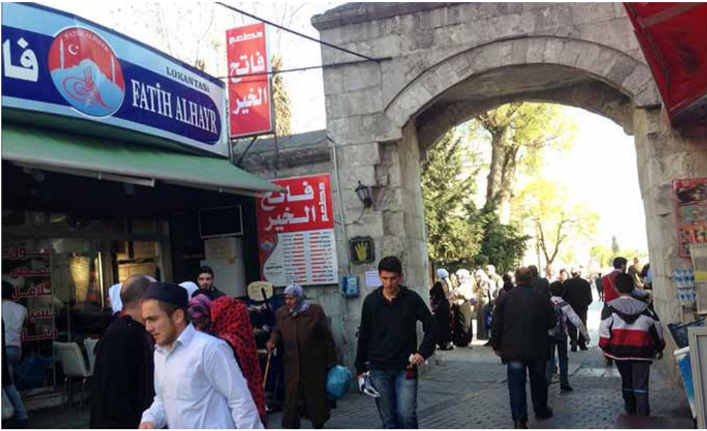
صورة تعبيرية لحي الفاتح في اسطنبول