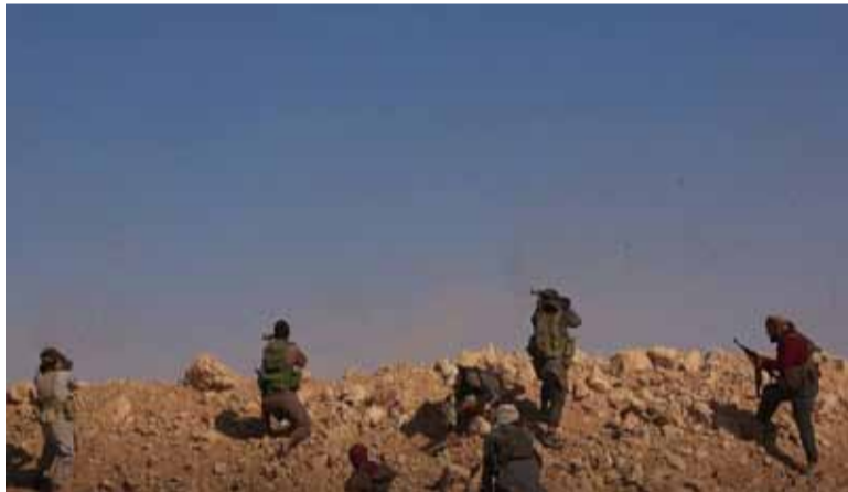
عناصر من «هيئة تحرير الشام» يتصدون لهجوم «تنظيم الدولة» في محيط قرية أم ميلال بريف حماة

صواريخ الـ«تاو» ضد ميليشيا النظام منذ أشهر. من جهة أخرى تمكنت «هيئة تحرير الشام» من استعادة السيطرة على تلال السروج والخزان وأبو حرجي وعينق بالريف الشرقي، وذلك بعد معارك عنيفة مع عناصر «تنظيم الدولة»، وتمكنت من قتل وجرح عدد من عناصر التنظيم.