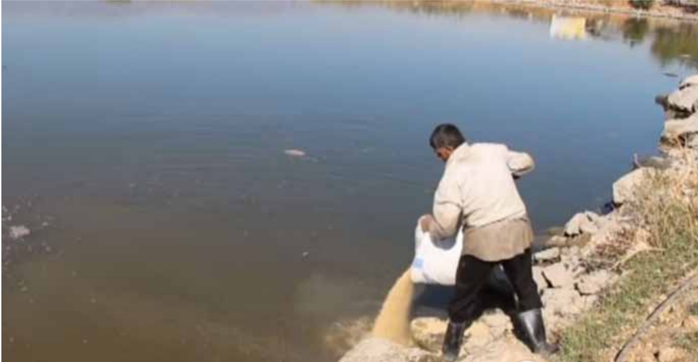
أحد مربي الأسماك في سهل الغاب | سوريتنا