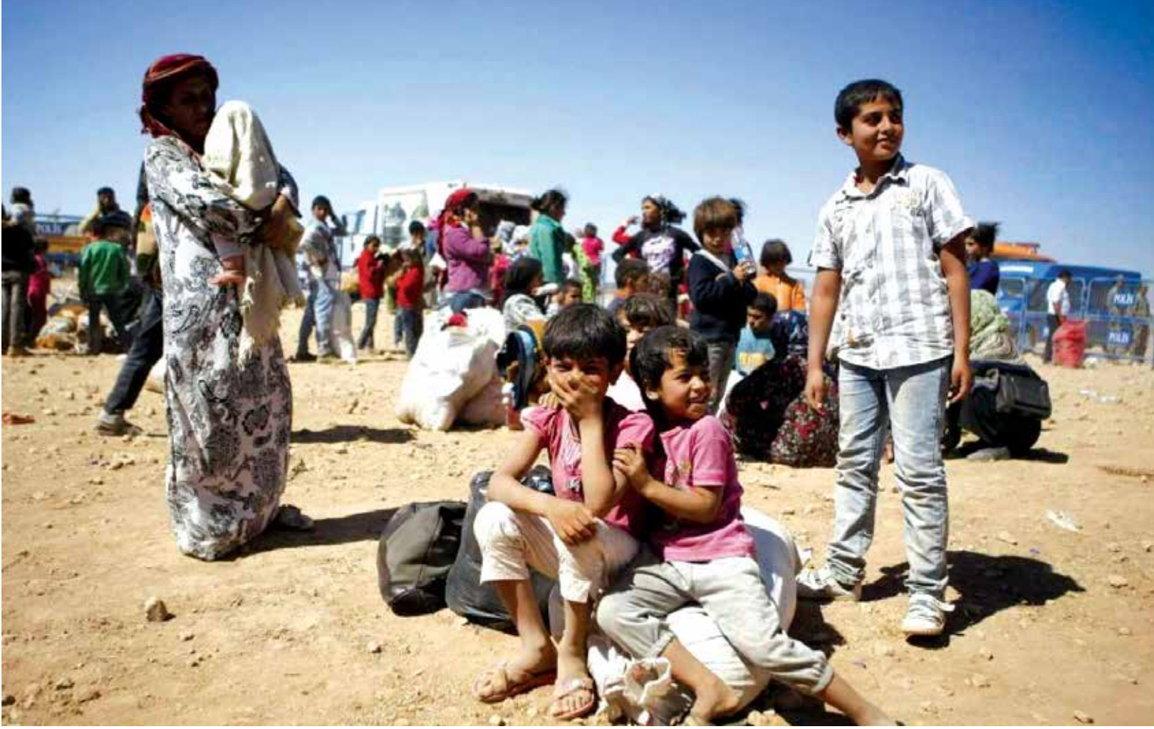
لاجئون سوريون ينتظرون عبور الحدود نحو تركيا (أرشيف)