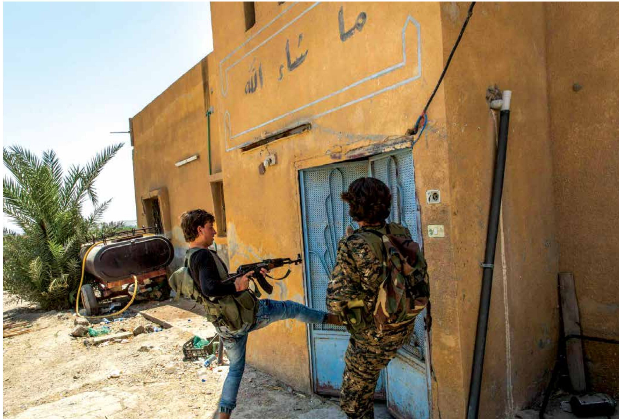
مقاتلان من «قوات سوريا الديمقراطية» يقومان ببلع باب منزل مهجور في الرقة (أ.ف.ب)