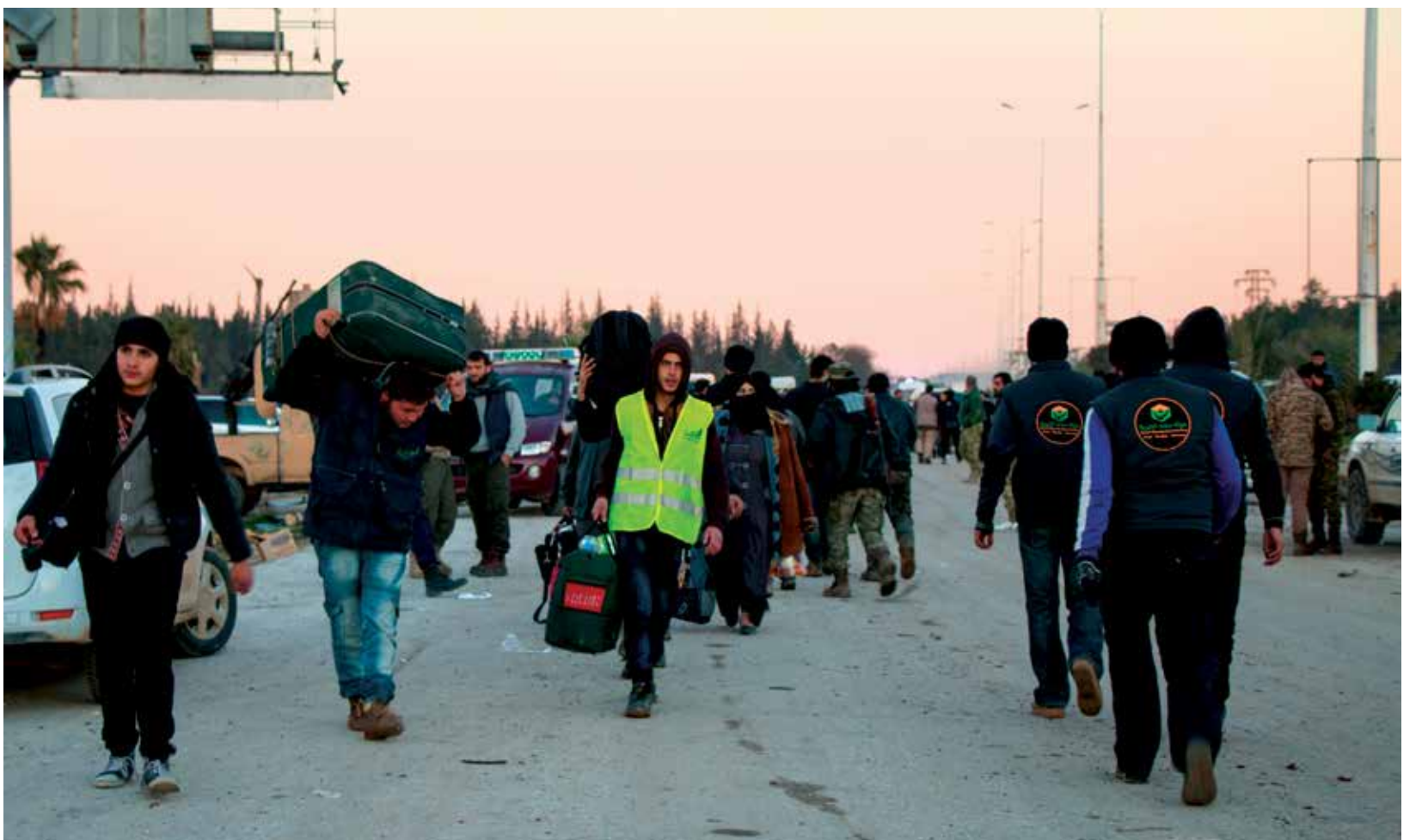
وصول مهجرين إلى حي الراشدين غرب حلب

رغم خلو الحي مؤخراً من كافة العناصر المقاتلة المحسوبة على قوات النظام، إلا أن الحياة لم تعد لطيفتها كما يخيل للبعض بل إن أبناء الحي ما زالوا يدفعون ثمن "غضب النظام" على الحي، واعتبار أهله "حاضنة سابقة للإرهابين" ويظهر ذلك في نوعية