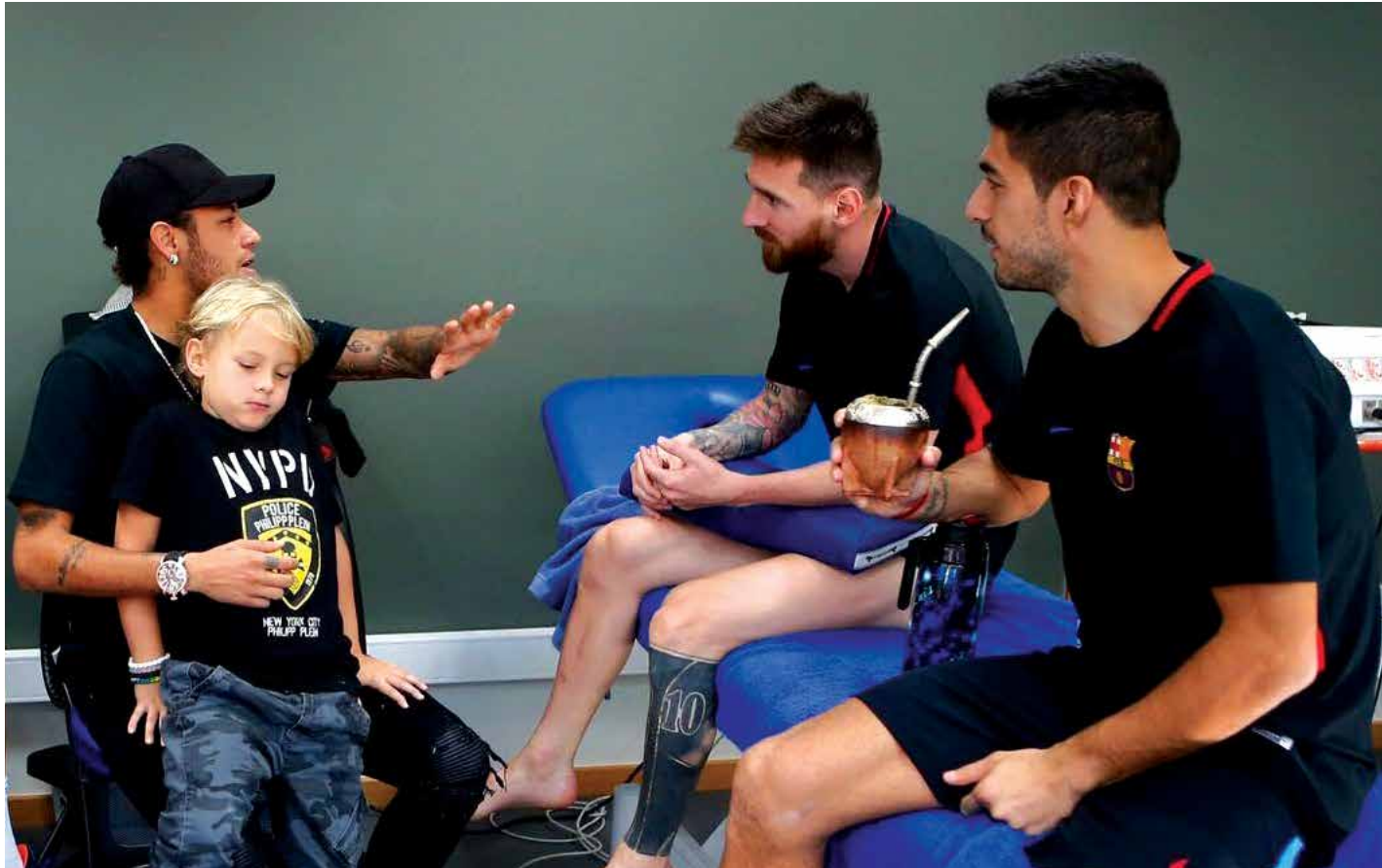
نيمار مع زميليه السابقين ميسي وسواريز خلال زيارته الأخيرة إلى برشلونة

فيما شخصيته المثيرة للجدل تضعه في مواقف صعبة له ولل فريق الذي يلعب معه. ومع الإقرار بأن أي لاعب مهاري معرض لتدخلات خضنة من قبل لاعبي الفريق الخصم إلا أن ذلك لا يُعطى مبرراً لأن يكون رد فعل النجم عنيفاً، وهو ما حصل مع نيمار الذي لا يتوانى عن تحصيل حقه ببديه. وفي هذا السياق لم يكن الطرد الذي تعرّض له النجم البرازيلي في مباراة سان جيرمان أمام مرسييا الأحد الماضي سبباً حلقاً في سلسلة تكس مشاغباً هذا اللاعب وعدم انضباطه، وأعاد هذا الموقف الحديث عن أحقية نيمار بحمل صفة "نجم" في ما يقوم بتصرفات لا تليق بالنجومية، ولا ترقى إلى موهبته الفذة التي ينبغي أن تدفعه للتحلي بمقامات القدوة.