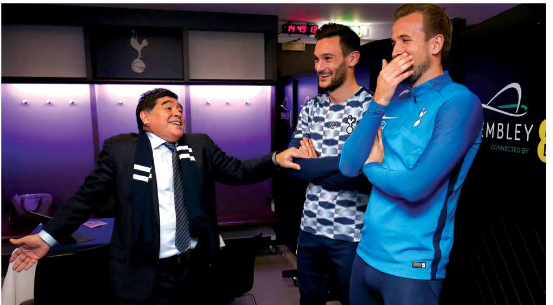
لعباً توتنهام الإنجليزي هاري كين وهوغو لوريس أثناء لقاءهما بالأسطورة الأرجنتينية ديجو مارادونا

كشف هاري كين، مهاجم نادي توتنهام هوتسبر والمنتخب الإنجليزي لكرة القدم، عن طموحه بأن يصبح أفضل لاعب في العالم، وذلك في تصريحات بعد لقائه أسطورة كرة القدم الأرجنتيني ديجو مارادونا. والتقى كين الذي يقدم أداء لافتاً هذه السنة، مارادونا على هامش المباراة ضد لفربول على ملعب ويمبلي في لندن، الأسبوع الماضي، والتي انتهت لصالح المضيف بنتيجة قاسية (4-1)، وسجل خلالها كين هدفين. وسجل كين خلال عام 2017 الجاري 45 هدفاً في 40 مباراة مع ناديه والمنتخب، ويفرض نفسه حالياً كأحد أبرز المهاجمين عالمياً، كما يتصدر ترتيب الهادفين في الدوري الإنجليزي الممتاز بثمانية أهداف في تسع مباريات، علماً أنه كان أفضل هداف في الموسم الماضي (29 هدفاً). وأعرب كين عن رغبته في السير على خطى الأرجنتيني ليونيل ميسي نجم برشلونة الإسباني، والبرتغالي كريستيانو رونالدو نجم ريال مدريد الإسباني، والذين يهيمنان منذ