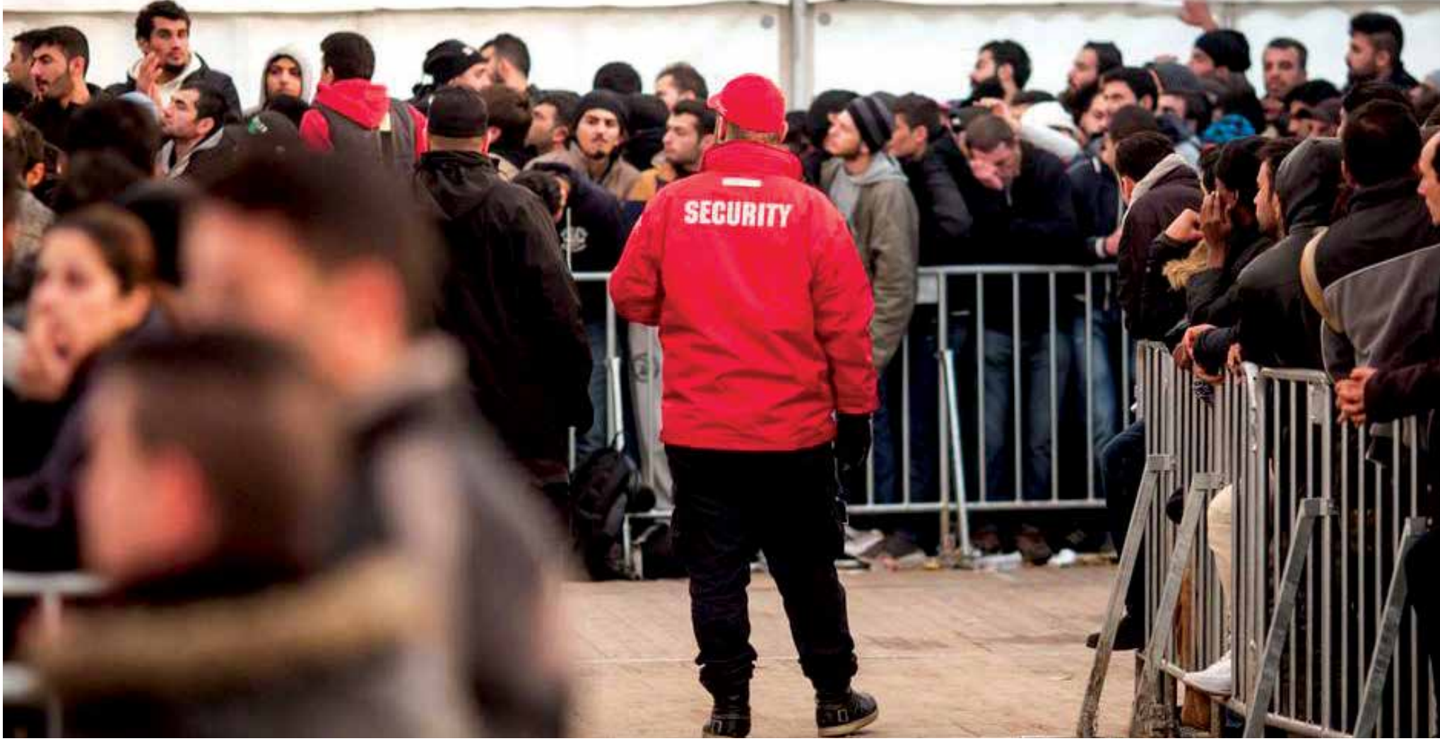
موظفو أمن ألمان يراقبون حركة اللاجئين