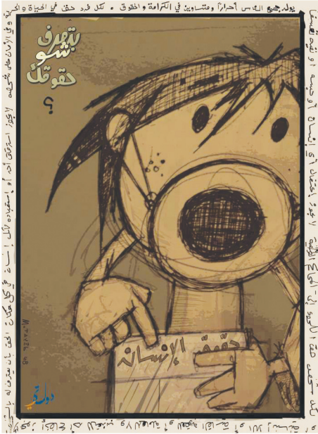
«عمل للفنان محمد طيب»