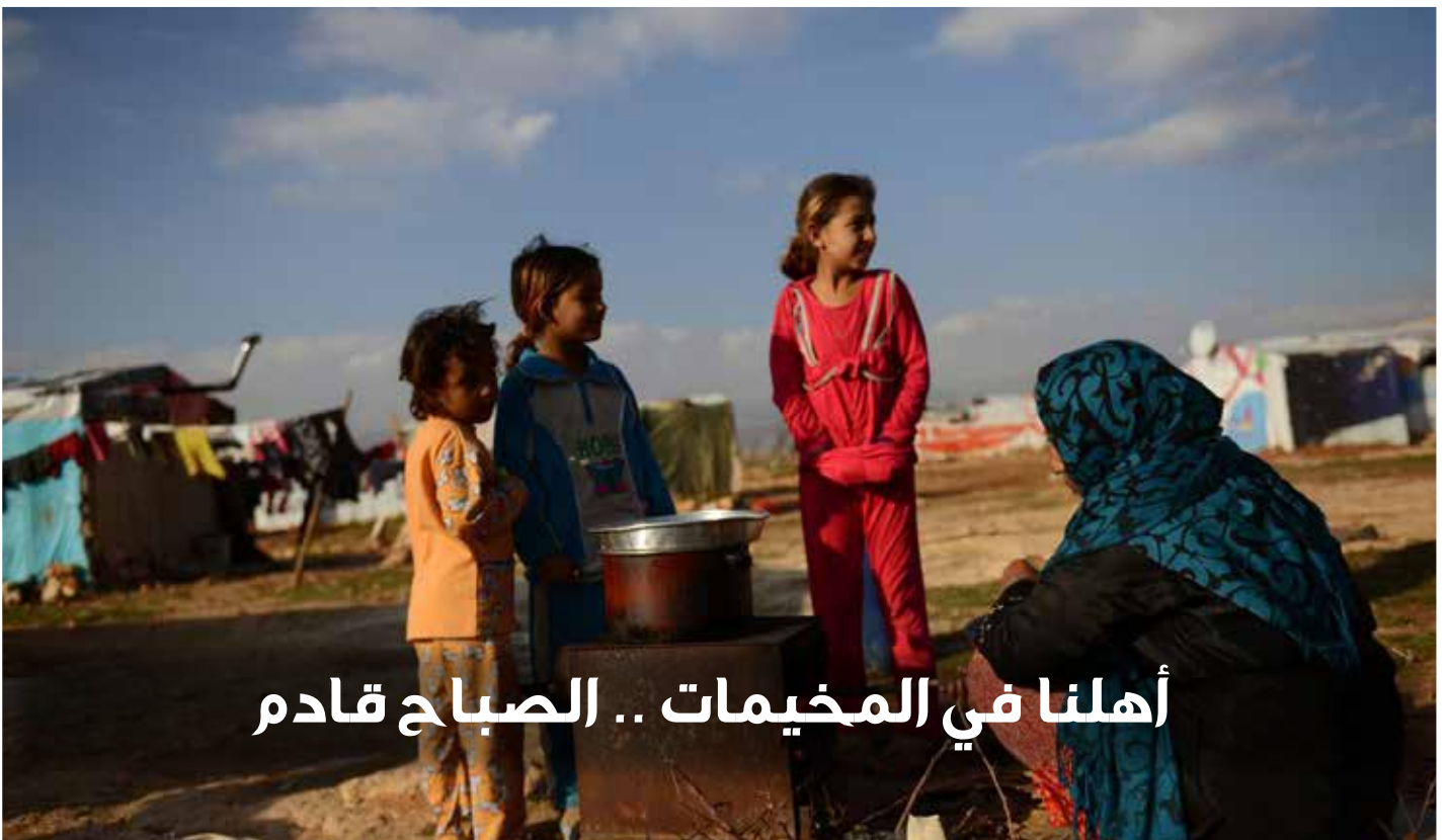
أهلنا في المخيمات .. الصباح قادم