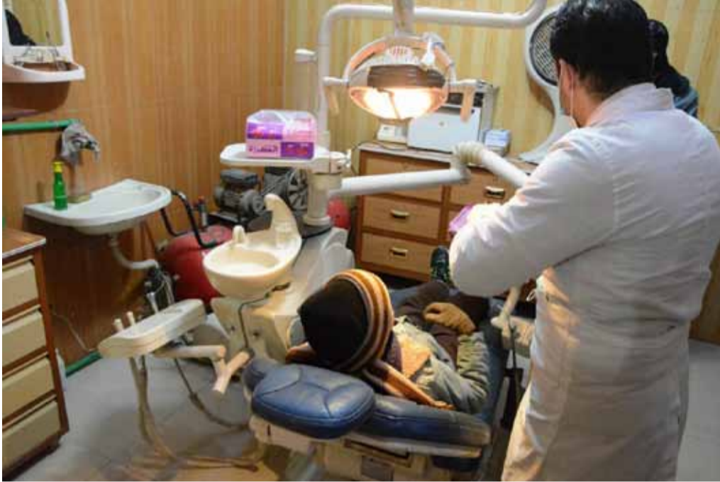
أحد مراكز المعالجة السنوية في الغوطة الشرقية

والاستهداف من قبل قوات النظام للأحياء السكنية، ويغطي أطباء الأسنان هذا النقص ويجرون عمليات الجراحة الفكية، والتي غالباً ما تكون معقدة، ولكن الخبرة المكتسبة منذ ست سنوات جعلت منهم محترفين، وبدأ قسم من أطباء الأسنان يتدرب على هذا الاختصاص بسبب الحاجة الكبيرة له.