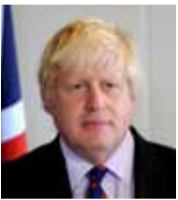
بوريس جونسون وزير الخارجية البريطاني

«إن القوى الأجنبية في سوريا ستشكل دائماً مشكلة، ولم تحل أية مشكلة من المشاكل التي تعاني منها، والحل يجب أن يكون من قبل السوريين، وعلى الدول الأجنبية عدم التدخل في سوريا، وترك الشعب السوري يرسم مصير بلده بنفسه».