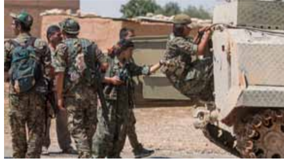
عناصر من قوات سوريا الديمقراطية في ريف الرقة

أعلنت وزارة الدفاع الأمريكية «البنتابون» أنها قتلت بالخطأ 18 عنصراً من قوات سوريا الديمقراطية