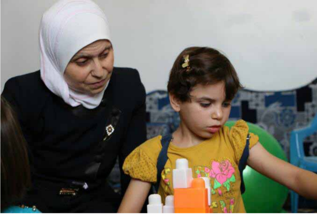
من مركز إدلب لذوي الاحتياجات الخاصة | سوريا