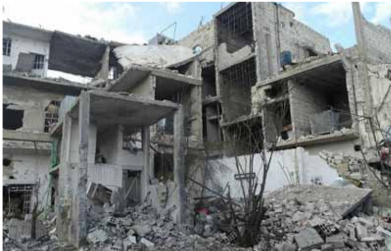
جانب من الدمار الذي تعرض له حي القابون نتيجة القصف

من جهة أخرى تمكن «جيش الإسلام»، من التصدي لمحاولة جديدة لقوات النظام، لاقتحام منطقة حوش الضواهره في الغوطة الشرقية.