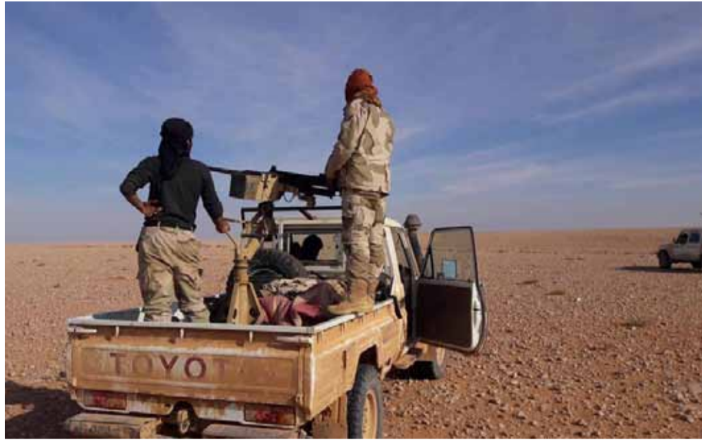
عناصر من «مغاوير الثورة» في البادية السورية

وعقب تقدم فصائل المعارضة وسيطرتها على الكثير من المواقع، قصفت طائرات النظام الحربي مواقع الفصائل، في مناطق بئر القصب وسرية البحوث العلمية قرب