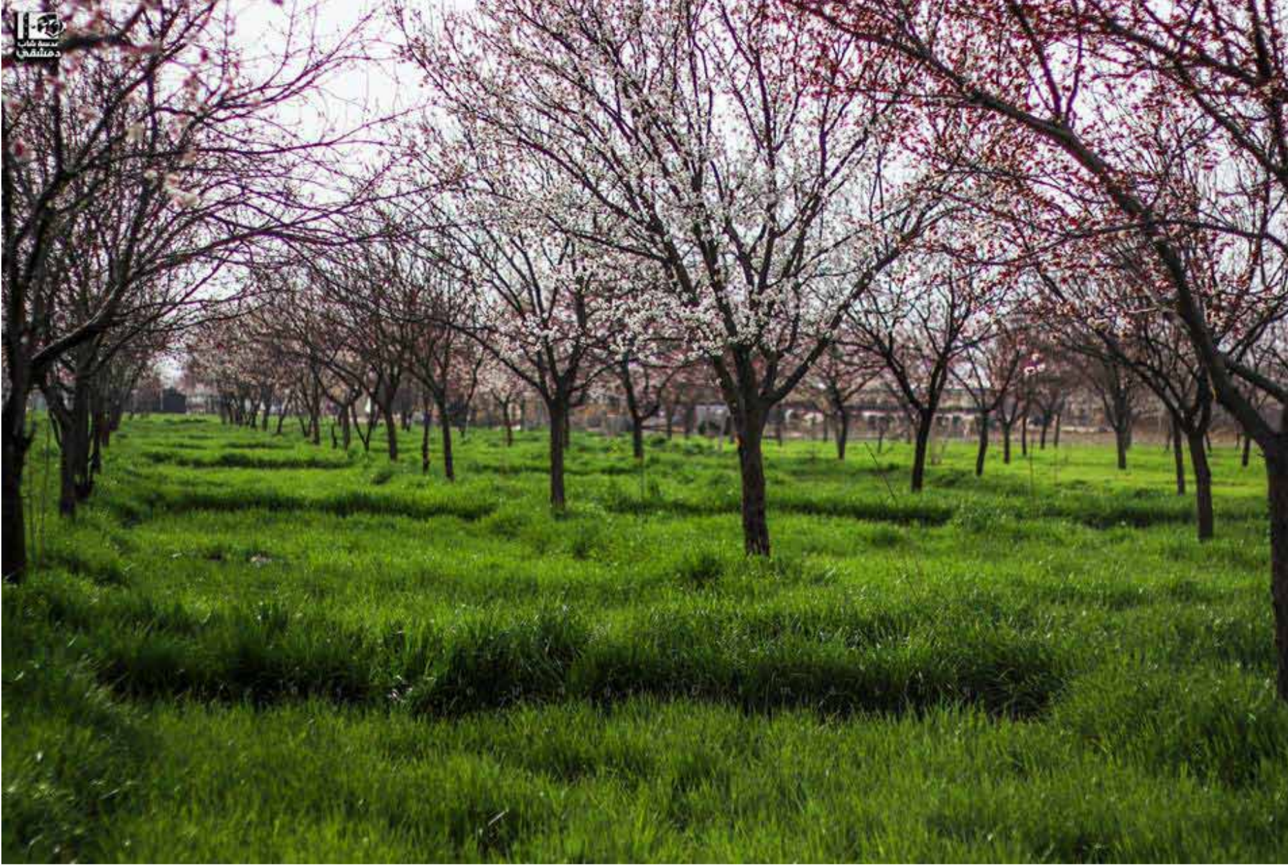
بساتين الغوطة الشرقية | 14 نيسان 2017