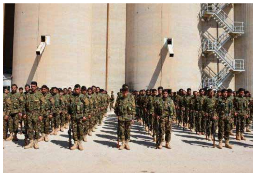
صور نشرتها «قوات سوريا الديمقراطية» لمقاتلين جدد انضموا إلى صفوف مجلس دير الزور العسكري | 3 نيسان 2017