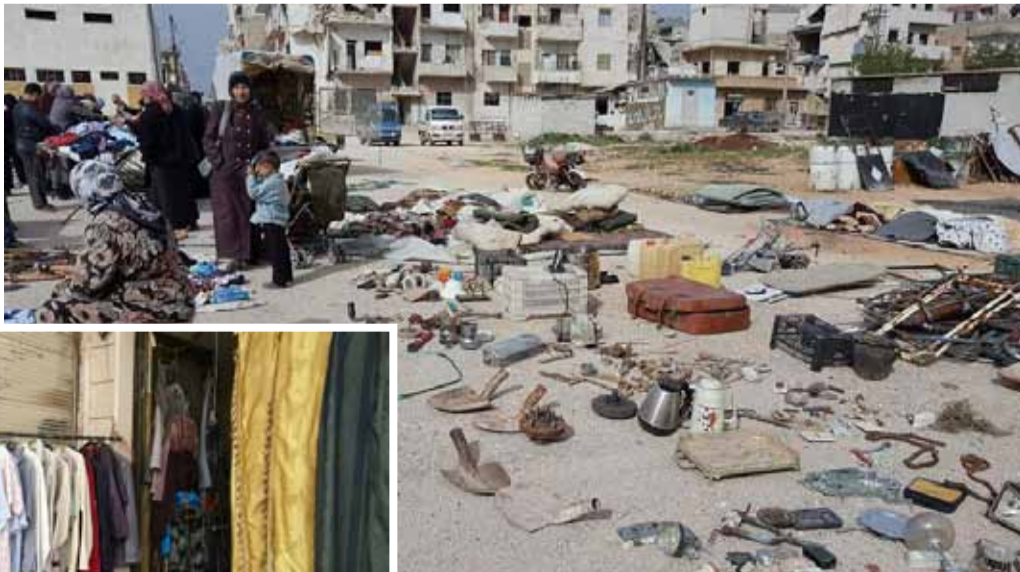
أحد محلات البالة في الغوطة الشرقية | سوريتنا