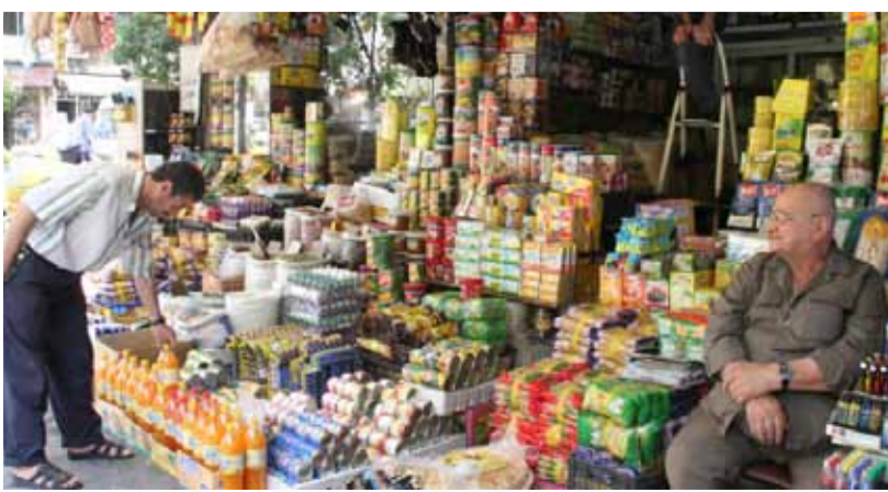
أحد محلات توزيع المواد الغذائية في مدينة دمشق

وتجاوز الناتج المحلي في سورية، عام 2010، الـ 64 مليار دولار، وحل القطاع النفطي السوري في المرتبة 27 عالمياً من حيث الإنتاج، الذي تجاوز الـ 400 ألف برميل يومياً، فيما بلغت الإيرادات النفطية 7% من الناتج الإجمالي، وذلك بحسب تقرير شبكة «سي إن بي سي» المتخصصة بالأخبار الاقتصادية، فيما بلغ معدل دخل الفرد 160 دولاراً في عام 2010 وفق قائمة مجلة «Global Finance» الاقتصادية.