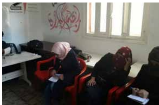
أثناء الدورة التدريبية في مركز رابطة المرأة المتعلمة | سوريانا