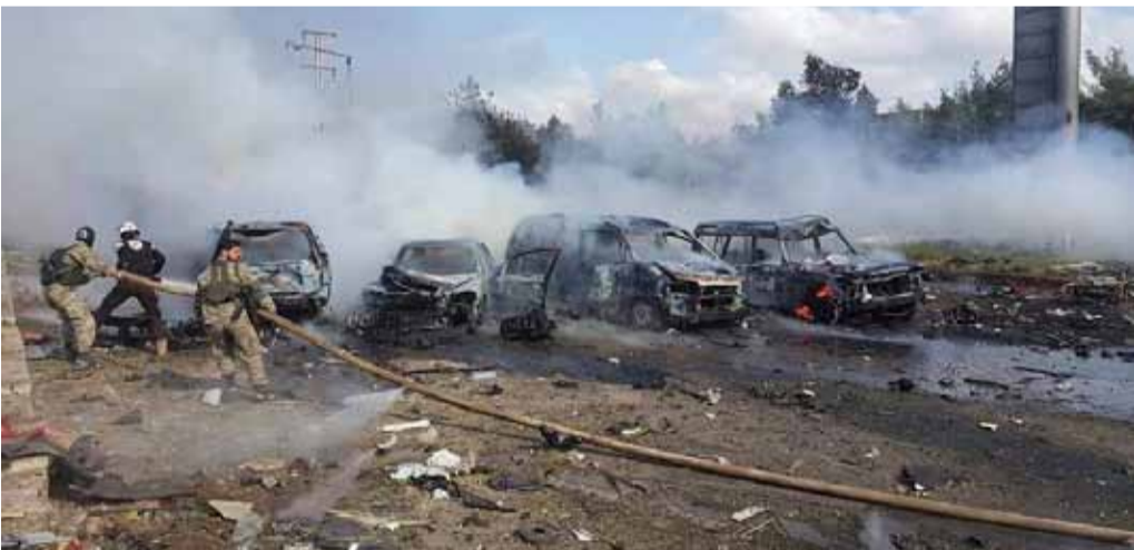
الدفاع المدني أثناء عمليات الإنقاذ بعد التفجير

وأضاف الائتلاف «إن الاتفاق يكشف إصرار طهران على التفاوض مع تنظيم «القاعدة» حصرياً، عبر خطة وأهمة ترمي إلى ربط الثورة بالإرهاب، وهذا الاتفاق يناقض القانون الدولي الإنساني وقرارات مجلس الأمن،