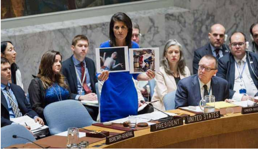
المندوبة الأمريكية في الأمم المتحدة "نيكي هايلي" ترفع صورة مجزرة خان شيخون خلال جلسة مجلس الأمن الدولي بشأن سوريا

ما تزال ردود الأفعال تتوالى، عقب قيام النظام السوري بارتكاب مجزرة الكيماوي في الرابع من نيسان الحالي والتي أدت إلى مقتل العشرات، وفي ظل استمرار ظهور الأدلة والتأكيدات التي تثبت تورط النظام في تلك المجزرة، بينما يواصل الأخير إنكاره مستفيداً من الدعم الروسي له.