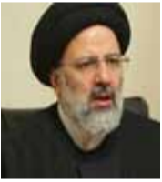
إبراهيم رئيسي مرشح الانتخابات الرئاسية في إيران

«لم نساهم في أي تغيير ديمغرافي في سوريا أو إتلاف النسيج الاجتماعي السوري، وقطر وفرت منصة للتعاون من أجل التوصل إلى اتفاق المدن الأربع وتنفيذه، وسعت إلى تجاوز العراقيل التي تحول دون تنفيذ الاتفاق».