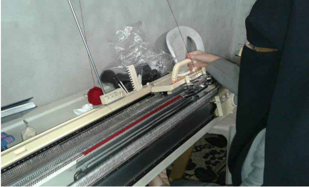
إحدى المتدربات على ماكينات الخياطة

افتتحت جمعية الشهداء مركز «عفة» لدعم الأسرة والمرأة في مدينة سمرمين بريف إدلب، وهو مركز تعليمي مهني تربوي وتوعوي، يسعى إلى تعليم النساء مهناً يدوية تعينهن على إعالة أنفسهن ومساعدة أسرهن.