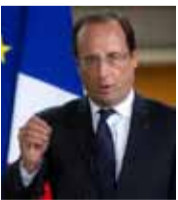
فرانسوا هولاند الرئيس الفرنسي

«بشار الأسد هو الإرهابي الأكبر، وتسبب بتعطش للانتقام لا يمكن وقفه، حتى بات لا يمكنه أن يأمل بأن يحكم شعبه ثانية، إنه سام حرقياً ومجازياً، وحان الوقت لروسيا لتستيقظ وتوقف هذه الحقيقة، فموسكو حليفة النظام، وما تزال تملك الوقت لتكون على الجانب الصحيح من وجهة النظر بشأن الحرب في سوريا».