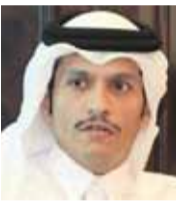
محمد بن عبد الرحمن آل ثاني وزير الخارجية القطري

المواد الكيماوية، وقد خدع المجتمع الدولي بشأن تسليمه السلاح الكيماوي، والهجوم الأمريكي على مطار الشعيرات لم يؤد إلى تدمير أي من الأسلحة الكيماوية، كونها تُخزّن خارج المطار، ويتم نقلها إلى المطارات قبيل الضربة، حيث إن النظام يحتفظ بها في الجبال المحصنة بشدة خارج حمص، وفي مدينة جبلة. علماً أن النظام قام بخلط غازات مختلفة، مثل السارين والغاز المسيل للدموع، من أجل إيجاد مزيد من الأعراض التي من شأنها أن تجعل من الصعب تحديد نوعية السلاح الكيماوي المستخدم».