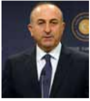
مولود جاويش أوغلو وزير الخارجية التركي

«القوات الجوية الروسية ستواصل دعم النظام السوري في محاربة الإرهاب، إلا أن بلادي لا تملك تأثيراً غير محدود على بشار الأسد، ومن الخطأ الزعم بأن موسكو بإمكانها إقناع الأسد بفعل ما تريد».