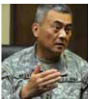
مايكل ناغاتا جنرال أمريكي

«لعلني أجد من الإنصاف أن يقدم الرئيس بشار الأسد استقالته، وأن يتنحى عن الحكم حياً بسوريا الحبيبة، ليجنبها ويلات الحروب وسيطرة الإرهابيين، فيعطي زمام الأمر لأي جهات شعبية نافذة تستطيع الوقوف ضد الإرهاب لإنقاذ الأراضي السورية بأسرع وقت، ليكون له موقف تاريخي بطولي قبل أن يفوت الأوان، أما ترامب فلا ينبغي عليه أن يزج نفسه في محرقة جديدة قد يدفع الجميع ضريبتها، وقد تكون سوريا (فيتنام) جديدة لهم».