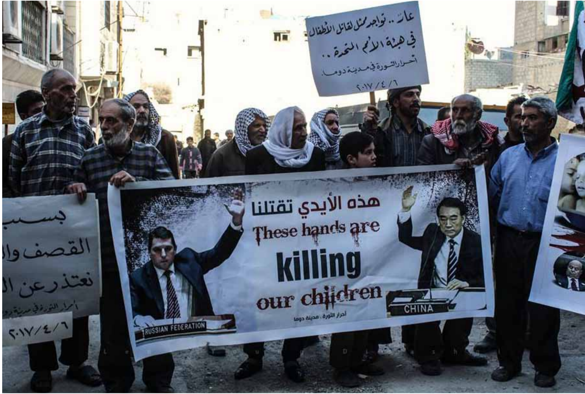
من مظاهر في مدينة دوما بالغوطة الشرقية تنديداً بالهجمات الكيماوية على خان شيخون 7 نيسان 2017