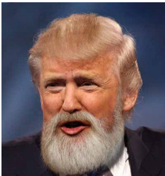
صورة ساخرة نشرها ناشطون غربيون لترامب

حصلنا على رئيس بشعر أحمر مثل الجزر وحرب عالمية ثالثة».