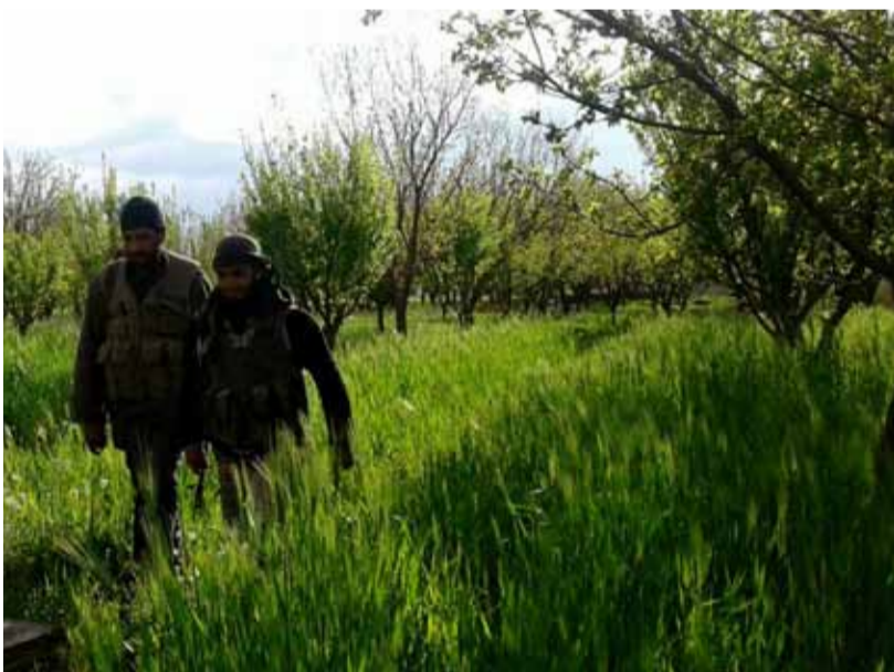
بساتين الغوطة الشرقية تحولت إلى جبهات ونقاط اشتباك