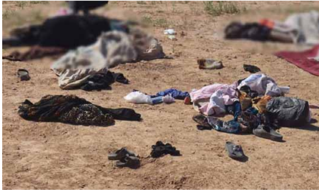
صور لضحايا مدنيين نشرتها «قسد» نتيجة المعارك بقرية الصفاصة بين مدينتي الرقة والطبقة يوم 6 نيسان 2017

ولكن التطور اللافت هو امتلاك قوات «نافذ أسد الله الطائفيّة» العاملة قرب منطقة الاشتباك، والتابعة للنظام السوري، مضادات جوية تصل رماياتها بسهولة إلى الطائرات التي حلقت على مسافات منخفضة من قوات النظام.