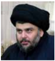
مقتدى الصدر زعيم التيار الصدري

«تجب الإطاحة برئيس النظام بشار الأسد في أسرع وقت ممكن، وتشكيل حكومة انتقالية، وإذا لم يكن يريد الرحيل وإذا لم تكن هناك حكومة انتقالية وإذا واصل ارتكاب جرائم ضد الإنسانية، فينبغي اتخاذ الخطوات الضرورية للإطاحة به».