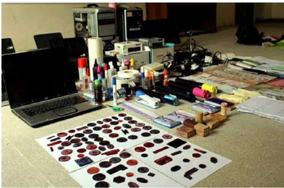
صورة لأدوات التزوير نشرتها قوات الأساييش

وطالت هذه الحملة مئات الشبان في جميع أنحاء المحافظة، من المالكية إلى رأس العين في الشمال، ومن