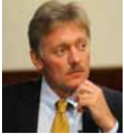
ديميتري بيسكوف المتحدث الرسمي باسم الرئاسة الروسية

«القوات الجوية الروسية ستواصل دعم النظام السوري في محاربة الإرهاب، إلا أن بلادي لا تملك تأثيراً غير محدود على بشار الأسد، ومن الخطأ الزعم بأن موسكو بإمكانها إقناع الأسد بفعل ما تريد».