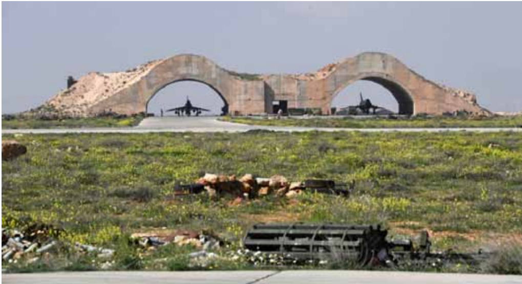
مطار الشعيرات بعد قصفه