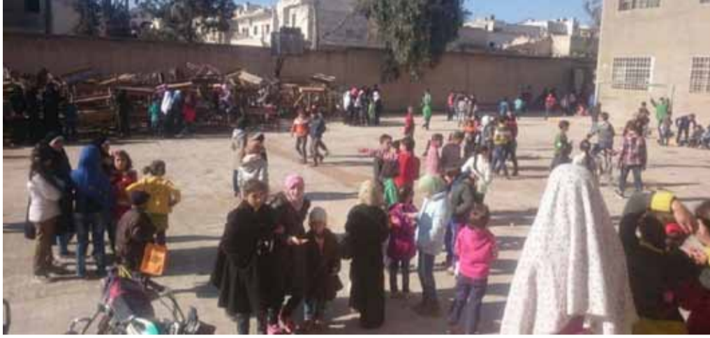
إحدى المدارس التي أعيد تأهيلها في مدينة الباب | تنسيقية مدينة الباب

أعلن المجلس المحلي لمدينة الباب بريف حلب الشرقي في الثالث من نيسان الحالي، إعادة افتتاح عدد من المدارس الابتدائية والإعدادية في المدينة، ضمن حملة لإعادة إعمار المدينة وتفعيل مؤسساتها.