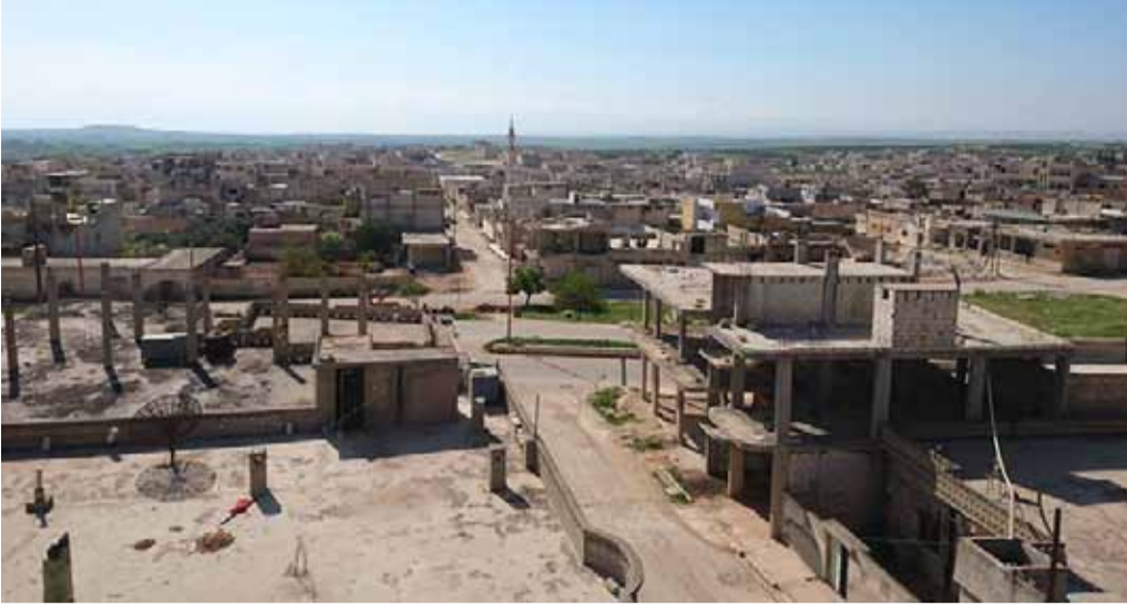
مدينة خان شيخون 7 نيسان 2017

الأمريكي في هذا الشأن». إضافة إلى تأكيد وزير خارجية ألمانيا زيغمار غابرييل، على ضرورة التوصل إلى حل سياسي في سوريا، والتركيز على مكافحة الإرهاب وتنظيم الدولة. أما الباحث الأمريكي تشارلز ليستر المتخصص بالشأن السوري فقال في حسابه على تويتر: «لا تنسوا أن باراك أوباما كان فخوراً جداً بقرار عدم توجيه ضربة عسكرية للأسد بعد هجوم أب الكيمائوي 2013 والذي أسفر عن 1400 ضحية». وأضاف «إن عدم اتخاذ أوباما أي إجراء بعد مجزرة الغوطة، دفع النظام للتمادي أكثر، وارتكاب مجزرة خان شيخون».