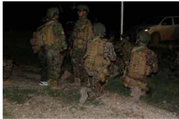
صور لعملية إنزال سابقة نفذتها القوات الخاصة الأمريكية في الطبقة في 22 آذار الماضي