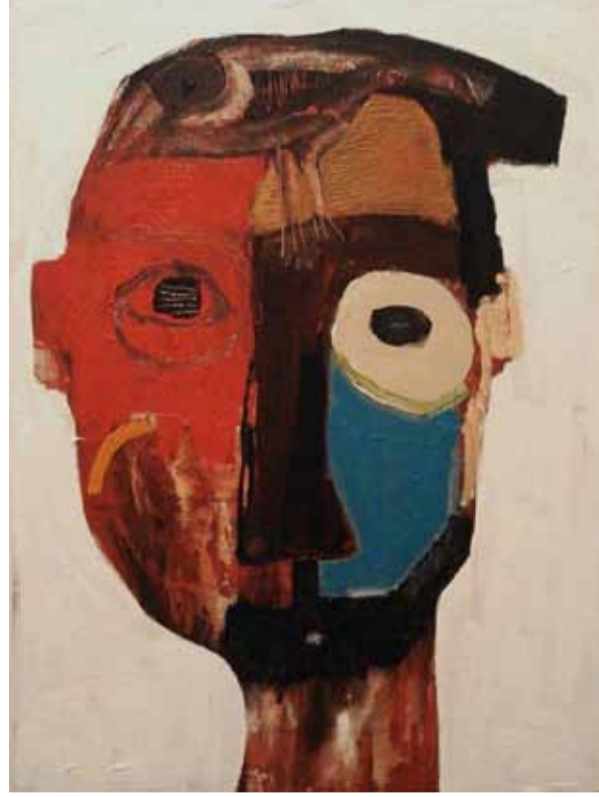
عمل للفنان سمعان خوام

مات أحمد في تدمر إثر معارك مع تنظيم الدولة، لم يقاتل؛ فهو أصلاً ممنوع عليه أن يحمل السلاح. قرر الضابط أن يحرّمه من سلاحه منذ أن أطلق النار في حصة تدريبية بالقرب من رؤوس زملائه، وراح يضحك ويتبول لإرادياً، بات حاجباً فقط، في ثكنة لا شيء يؤكل فيها، فأمضى وقته يراقب الاشتباكات البعيدة ويضحك، ويسأل الضابط عن طريقة الانشقاق «بدي روح أنشق» قال في الليلة الأخيرة من حياته، تبوّل ثم نام ثم تبوّل ثم ضحك ثم مشى، ثم مات.