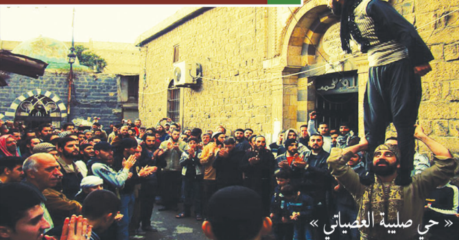
«حي صليبة العصياتي»