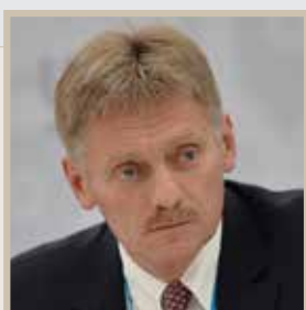
ديمترى بيسكوف المتحدث باسم الكرملين

المنظمات الإرهابية غايتها جر بلادنا إلى صراع قائم على أساس عرقي وديني، وتحاول تلك المنظمات نقل النار المشتعلة في سوريا والعراق إلينا.