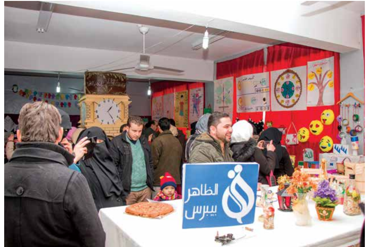
من أجواء المعرض