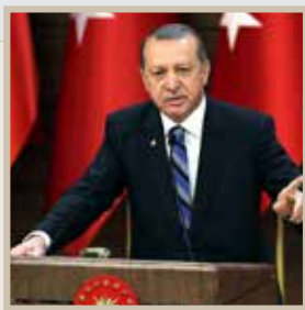
رجب طيب أردوغان الرئيس التركي

اتفاق وقف إطلاق النار في سوريا فرصة مهمة للغاية رغم هشاشته والانتهاكات العديدة له. ولقد أعدنا أرضية «أستانا» من خلال اجتماعنا مع روسيا وإيران في موسكو والمحادثات الأخرى.