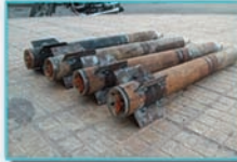
« صفحة ٦ »