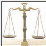
« صفحة ٤ »