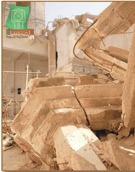
مئذنة مسجد قاسم الاتاسي بحمص تعرضت لقذيفة دبابة تي ٧٢ ..

جريدة ثورية مستقلة نصف شهرية العدد الأول ٢٠١٢/١٠/١ تصدر عن المركز الإعلامي التخصصي . حمص