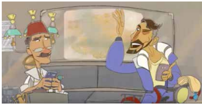
يعرفهم في موقع ثابت. خلفيته تتضمن ورقة لنعي الليرة السورية، ويمثل العمل نقلة مهمة في فن صناعة الانيميشن بعيداً عن الإسفاف والاستسهال.

سلسلة كرتونية تقوم بإعادها وتفيدها مجموعة من الشباب السوريين، أطلق على السلسلة تسمية أبو جمال ملك التمر هندي، وأبو جمال هو بائع تمر هندي بروي في كل حلقة حكاية جديدة تتضمن موقفاً أو تعليقاً طريفاً يتناول الشأن السوري، من خلال شخصيات أخرى تظهر في كل حلقة، وتبدو الحرفية والابتكار واضحة في البرنامج من خلال طرح الأفكار رغم الإمكانات الفنية البسيطة، والابتعاد عن المبالغة التي تميز الكثير من البرامج التي تنحو منحى ساخر أو نافذ... النصوص بسيطة وغير معقدة توجه نقداً لاذعاً للجميع دون أن تحابي أحداً، يتحدث أبو جمال بائع التمر هندي مع الناس الذين