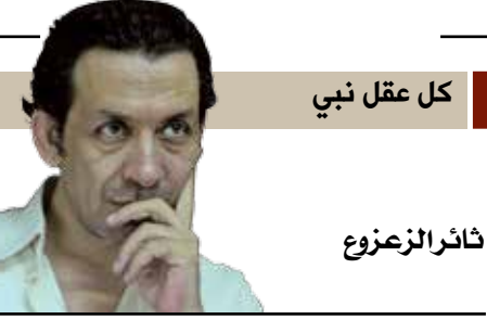
كل عقل نبي