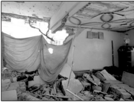
صورة لإحدى المنازل التي تم قصفها