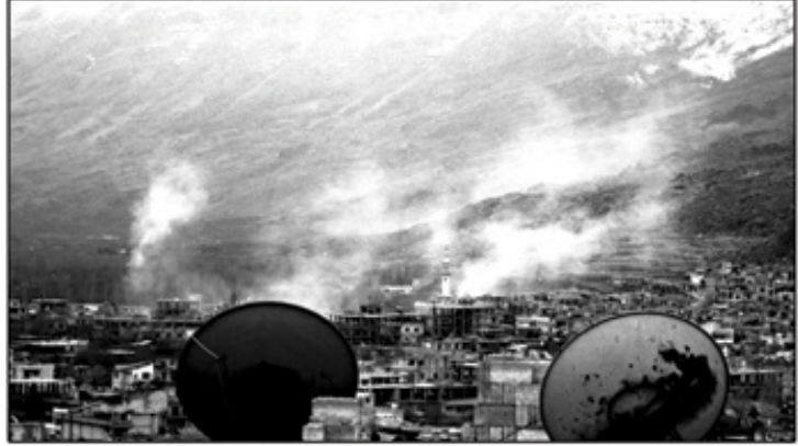
صورة للمدينة أثناء القصف

في يوم الثلاثاء 21 شباط تم تمشيط القسم الغربي من المدينة وذلك بعد دخول ما يزيد على ممتي سيارة و عشرة باصات و مئات الجنود فتم اعتقال المزيد من الشباب بعد مدهامة منازلهم و سرقتها و قام الجنود الأسيديون بضرب و تعذيب المعتقلين في الباصات ، و بعد مغادرة الحملة قامت الحواجز بقصف على مواقع في سهل الزبداني و كذلك قصف بناء على الهيكيل في منطقة قلعة الزهراء لأنه البناء الذي رفع عليه علم الاستقلال و ذلك بالرصاص الخارق الحارق المتفجر . و قد تم يوم الأربعاء الثاني و العشرين من شباط متابعة عملية تمشيط الحي الغربي و اعتقال المزيد من الناشطين بعد مدهامة منازلهم و نهب بعضها و قد لا يتسع المقام لذكر كافة الانتهاكات المرتكبة من قبل الجيش الأسيدي ، لكن نقول أن كل ما قاموا و يقومون به لن يزيدنا إلا عزيمةً و إصراراً على مواصلة ما بدأنا به و ما انطلقت من أجله ثورتنا المباركة و هو إسقاط هذا النظام الوحشي بتوفيق من الله و دعم من الجيش الحر و إرادة صادقة لبناء سوريا الجديدة . و الدليل على ذلك هو عودة التظاهرات رغم كل التشديد الأمني و التواجد العسكري الكثيف إلا أن شباب الزبداني يصرون على الخروج بشكل يومي مهما كانت