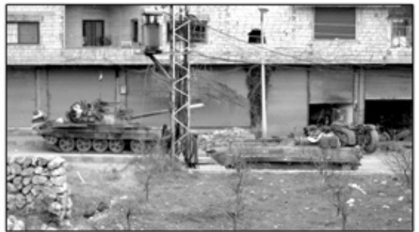
صورة للدبابات المتواجدة في شارع بردى

أما دفن الشهداء فقد تم بطريقة غير إنسانية إذ كانت جثامينهم الطاهرة تنقل ليلاً و تدفن سريعاً دون تشييع في مقابر قديمة لم تفتح من عشرات السنين كما حصل مع شهداء آل عواد . كما توالى حملات الدهم و الاعتقالات بشكل يومي تقريباً ففي يوم الجمعة السابع عشر من شباط تم تمشيط قسم كبير من أحياء الزبداني و اعتقال عدد من الشبان و الناشطين .