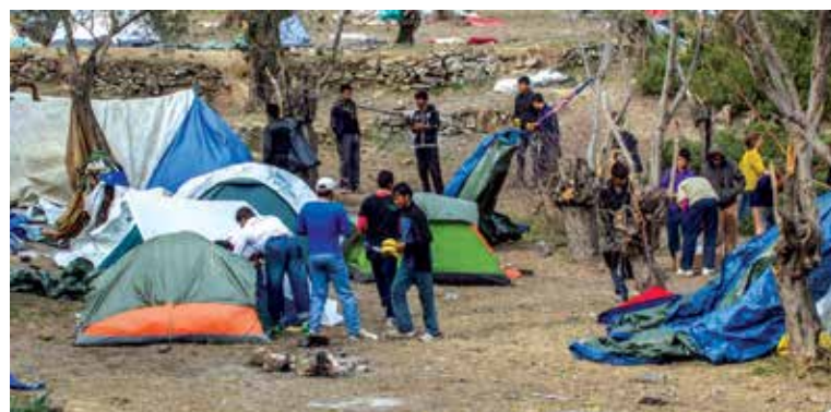
تفاصيل صفحة 07