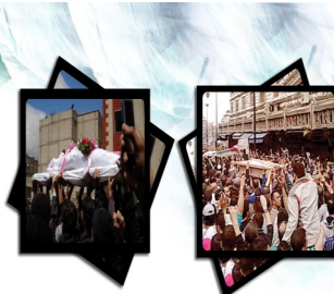
من المؤمنين رجال صدقوا ما عاهدوا الله عليه فمنهم من قضى نحبه ومنهم من ينتظر وما بدلوا تبديلا

قتل وتشريد وإجرام .. كذب وتلفيق وأوهام هذي خلاصة ما يقدمه .. للشام طاغية وأزلام يارب عندك كشف غمتها .. واليك ترفع كفها الشام