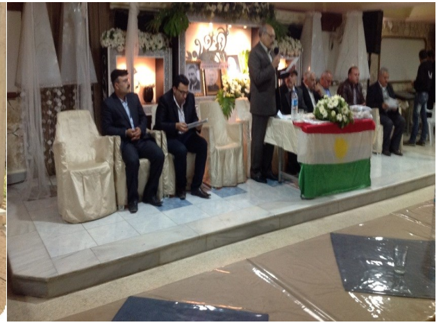
مهرجان الصحافة في عفرين بصالة جين