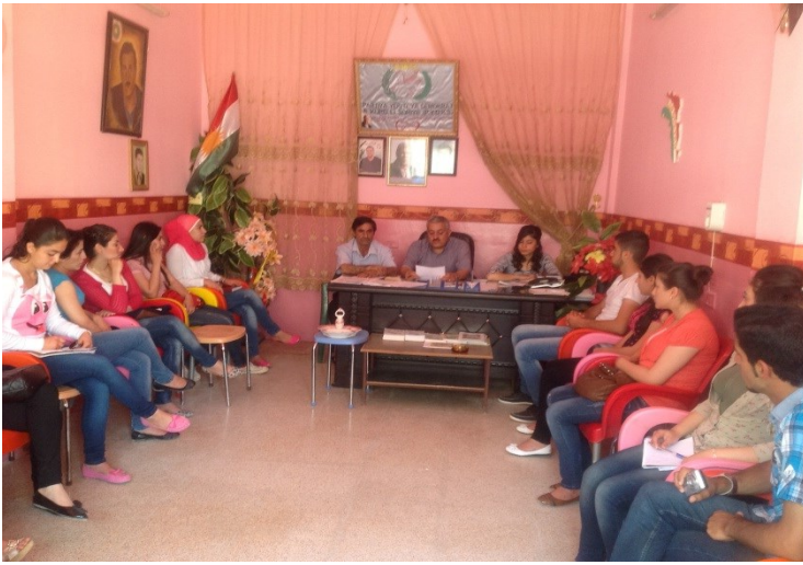
ندوة عن أهمية التنظيم في حياة الشعوب