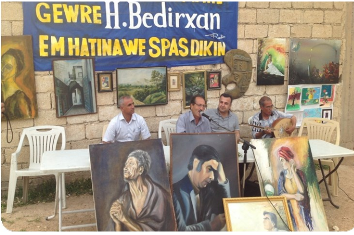
ذكري رحيل حامد بدر خان