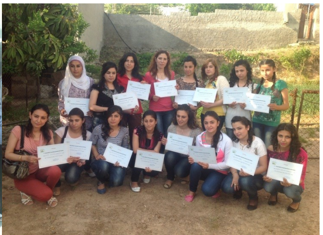
توزيع شهادات الدفعة الثانية لطلاب اللغة الكردية