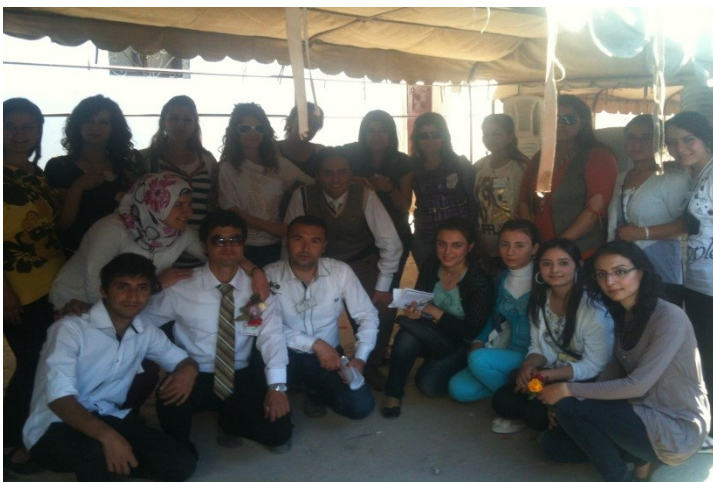
يوم الصحافة في جنديرس