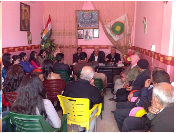
ندوة حول قرارات المؤتمر السابع للحزب