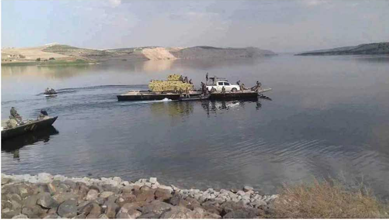
(منبج امام مرحلة جديدة- تحقيق الصور)