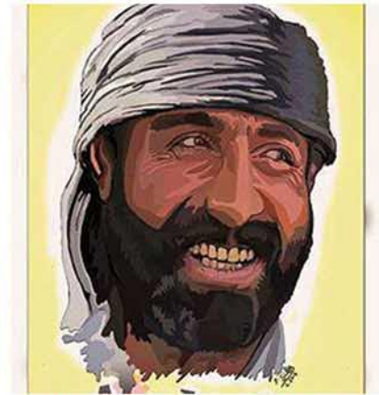
(الشهيد الكبير.. ذهب دون ان يرى منبج) ابا ليلى

ويقود الآن مجلس منبج العسكري حرب هجومي على داعش في اطراف منبج قال انه لم يبق الا عدة أيام حتى "تتحرر منبج وتعود اليها الأهالي " من جديد.