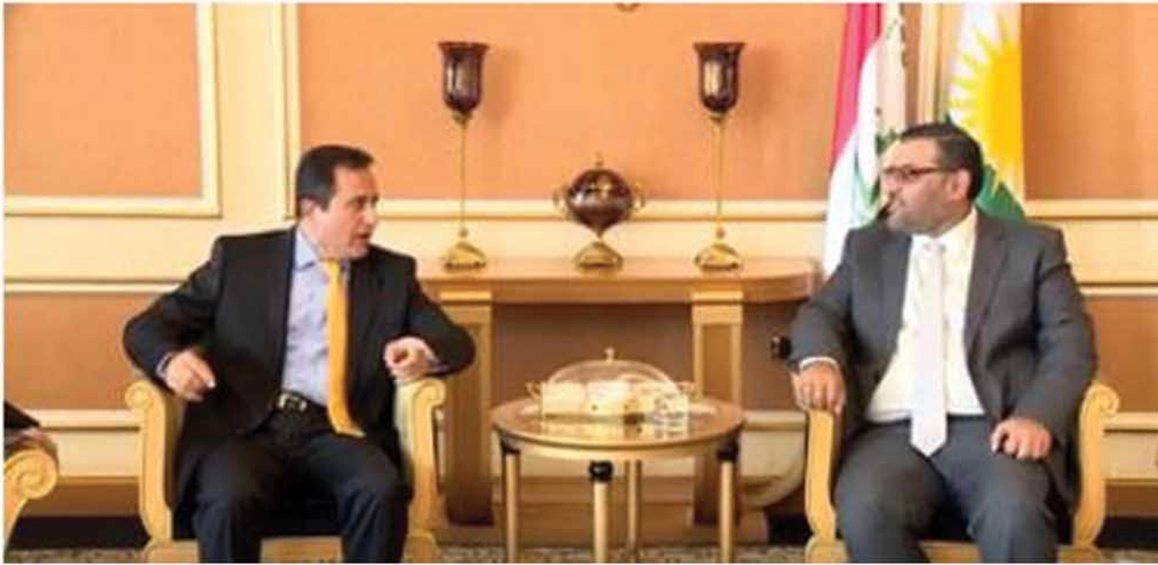
برجاص | هولير

ليس الامر غريباً، فغالبية المعارضة زارت هولير، وغالبية المعارضة رأت هولير منفذاً لتبادل الرؤى وبناء جسور التعايش بين المكونين الكردي والعربي، وكون هولير لها تجربة بذلك، فان لهذا فائدة كبيرة على ان السوريين كيف يؤسسوا لأنفسهم نظاماً يحقق التعايش بين مكونات ذات مشارب مختلفة.