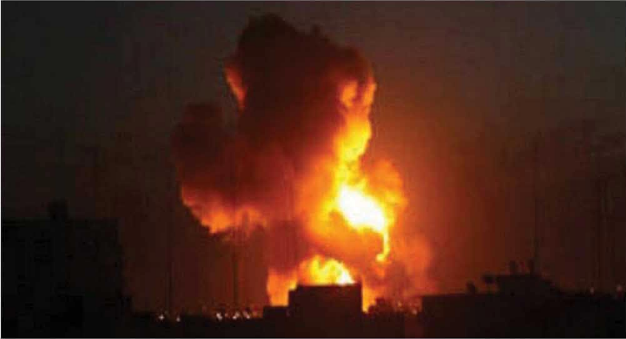
(منبج امام مرحلة جديدة- تحقيق الصور)