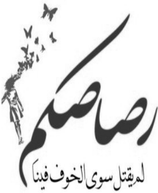
الشعب السوري يراق طريفة