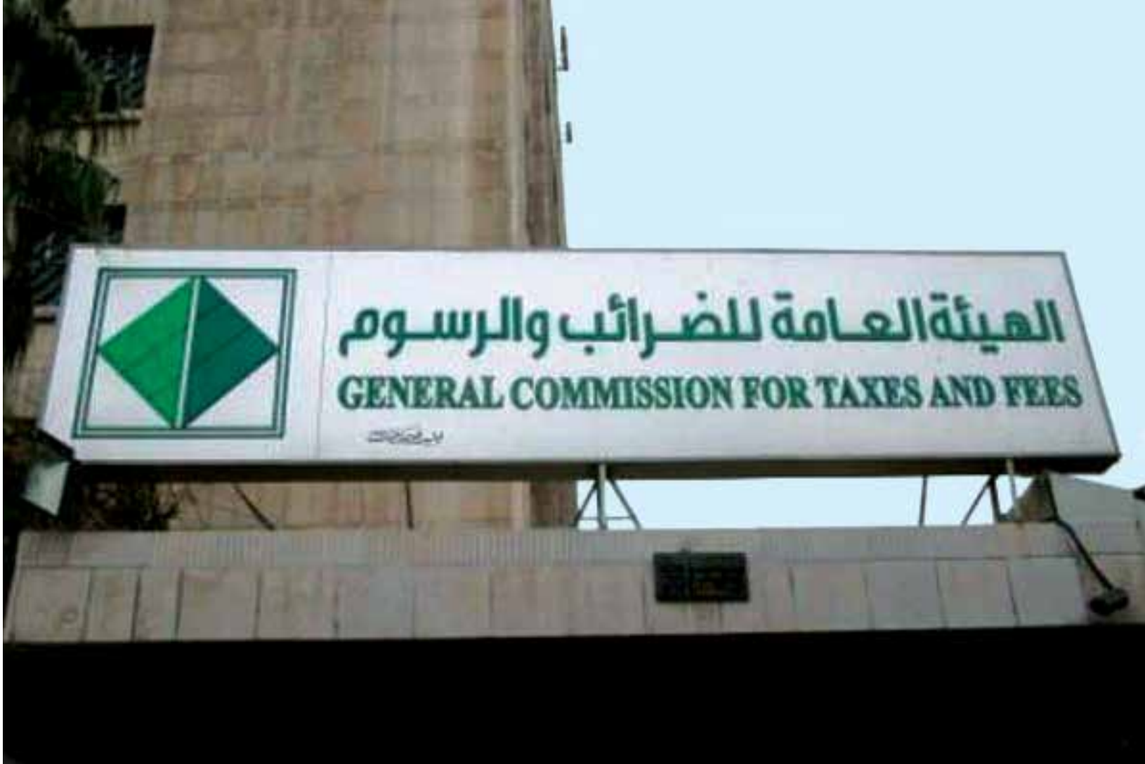
مدير مالية دمشق يصرح بأن الضريبة في سورية «غير مؤلمة»، ويعزف خزينة الدولة بأنها «جيوب رعاياها».