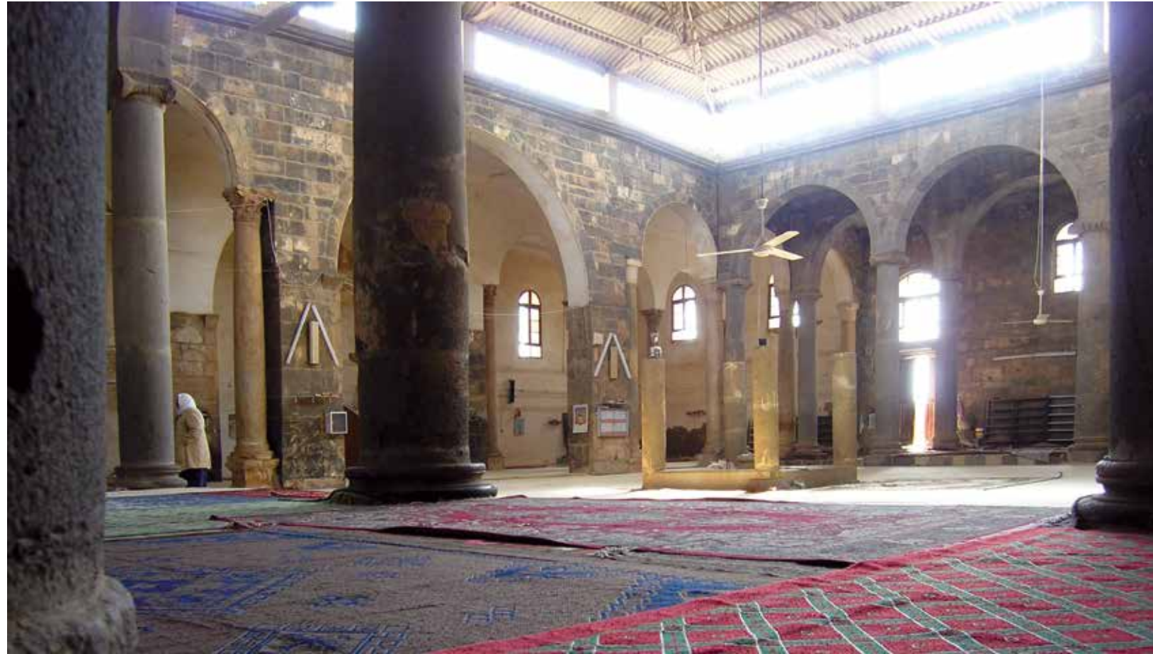
المسجد العمري في بصرى الشام قبل التوراة