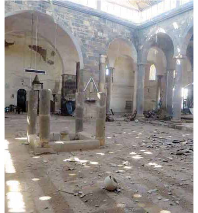
المسجد قبل الترميم