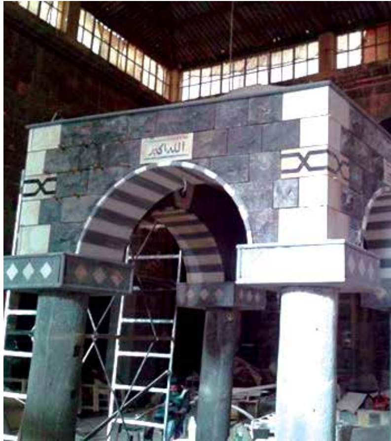
القبة المضافة بحجة الترميم

وعقب استعادة المعارضة السيطرة على بصرى الشام، تعرضت المناطق الأثرية في المدينة إلى قصف متقطع بالبراميل المتفجرة والقذائف المدفعية والصاروخية، طال كلا من القلعة الأثرية والكنائس الأثرية وموقع سرير ابنة الملك، إضافة إلى المسجد العمري الذي يقع في منتصف المدينة الأثرية، ما أدى إلى فتح هوة في الجدار الغربي للمسجد، فضلاً عن تدمير سقف الباحة المسقوفة، كما أدى أيضاً إلى تحطيم أجزاء من المئذنة.