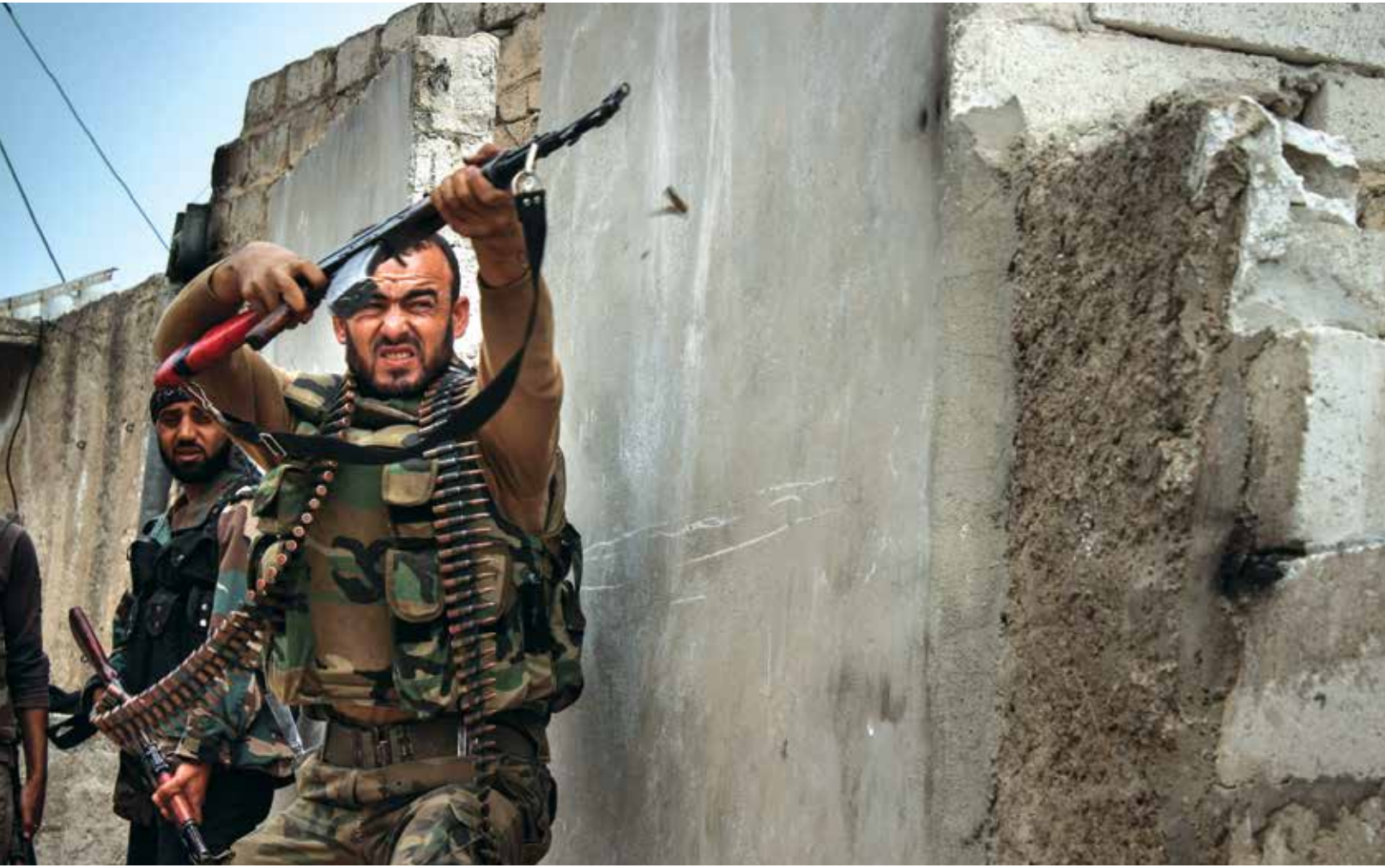
تحولت قوات المعارضة في ٢٠١٦ إلى الدفاع عن بلدة الشيوخ مسكين، كما عجزت عن فتح معارك جديدة ضد قوات النظام

تعيش محافظة درعا منذ بدء سريان اتفاق الهدنة وأواخر شباط الماضي، حالة من الهدوء على الجبهات، لم يعكر صفوها حرق النظام للهدنة في باقي المحافظات. وهو هدوء تناسب بشكل لافت مع تراجع العمليات العسكرية في هذه المنطقة، ضد قوات النظام، خلال الأشهر الماضية، وتحولت قوات المعارضة من حالة الهجوم المتواصل منذ ٢٠١١، إلى حالة الدفاع عن المناطق الواسعة التي سيطرت عليها. وبالنظر إلى العمليات العسكرية الأخيرة التي شهدتها محافظة درعا خلال هذا العام، نجد أن معظمها تركز في القتال ضد تنظيم «الدولة الإسلامية»، ولواء شهداء اليرموك» المتمم بمبايعته للتنظيم، والدفاع عن مدينة الشيوخ مسكين الاستراتيجية التي خسرتها قوات المعارضة لصالح النظام وأواخر شباط الماضي، بينما فشلت قبلها بالسيطرة على ما تبقى من مدينة درعا في معركة «عاصفة الجنوب».