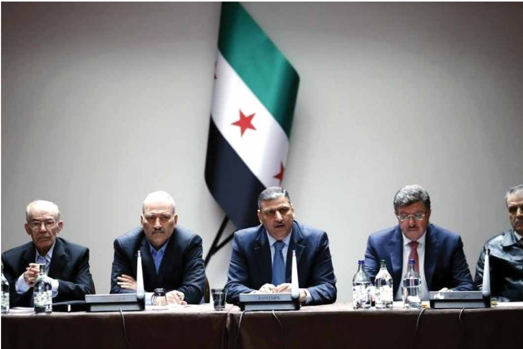
هيئة التفاوض تجتمع غداً في الرياض لاتخاذ موقف نهائي حول جولة جنيف المزمعة

لم تحسم المعارضة السورية أمرها بعد بشأن العودة مرة أخرى إلى مفاوضات جنيف ٣، في جولة رابعة من المفترض أن تدخل في صلب العملية التفاوضية، وتناول مسألة الانتقال السياسي في سوريا، في وقت هدت فيه كبرى فصائل المعارضة السورية المسلحة بالانسحاب وبشكل كامل من العملية السياسية، معتبرة في بيان لها، هذه العملية «عقيمة»، وتفتقد لـ«اليات التطبيق». ومن المنتظر أن تعقد الهيئة العليا للتفاوض، المنبثقة عن المعارضة اجتماعات غداً الأربعاء، في مقرها بالعاصمة السعودية، للخروج بموقف حاسم حيال المفاوضات في جنيف، والتي عكّفت المعارضة مشاركتها فيها في الثامن عشر من الشهر الفائت، احتجاجاً على خرق النظام المتواصل للهدنة، وعدم تحقيق تقدم جذي، وخاصة لجهة فك الحصار عن مدن وبلدات محاصرة من قبل قوات النظام، وميليشيات طائفية، وتسهيل دخول مساعدات إنسانية عاجلة، والإفراج عن معتقلين وخاصة النساء والأطفال من سجون النظام، كما نصت قرارات دولية. وتكررت مصادر في المعارضة السورية لـ«صدى الشام» أنه من المحتمل عقد جولة رابعة من مفاوضات جنيف قبيل نهاية أيار الجاري، حيث يبذل الوفد الأممي ستيغان دي ميستورا جهداً لعودة طرفي التفاوض إلى جنيف قبيل شهر رمضان المقبل، وللشروع في مناقشة عملية الانتقال السياسي، كي تبدأ مرحلة انتقالية خارجية الأمريكي جون كيري في ختام اجتماع للمجموعة الدولية لدعم سوريا، والتي تضم ١٧ دولة في فيينا منذ أيام. وتصر المعارضة السورية على تحقيق تقدم حقيقي على المسار الإنساني، كي توافق على العودة إلى جنيف، وهو ما لم يستطع الوفد الدولي تأمينه حتى اللحظة رغم وعود تلقاها من الطرف الروسي، بممارسة ضغوط على النظام لتسهيل دخول مساعدات إنسانية إلى المناطق المحاصرة.