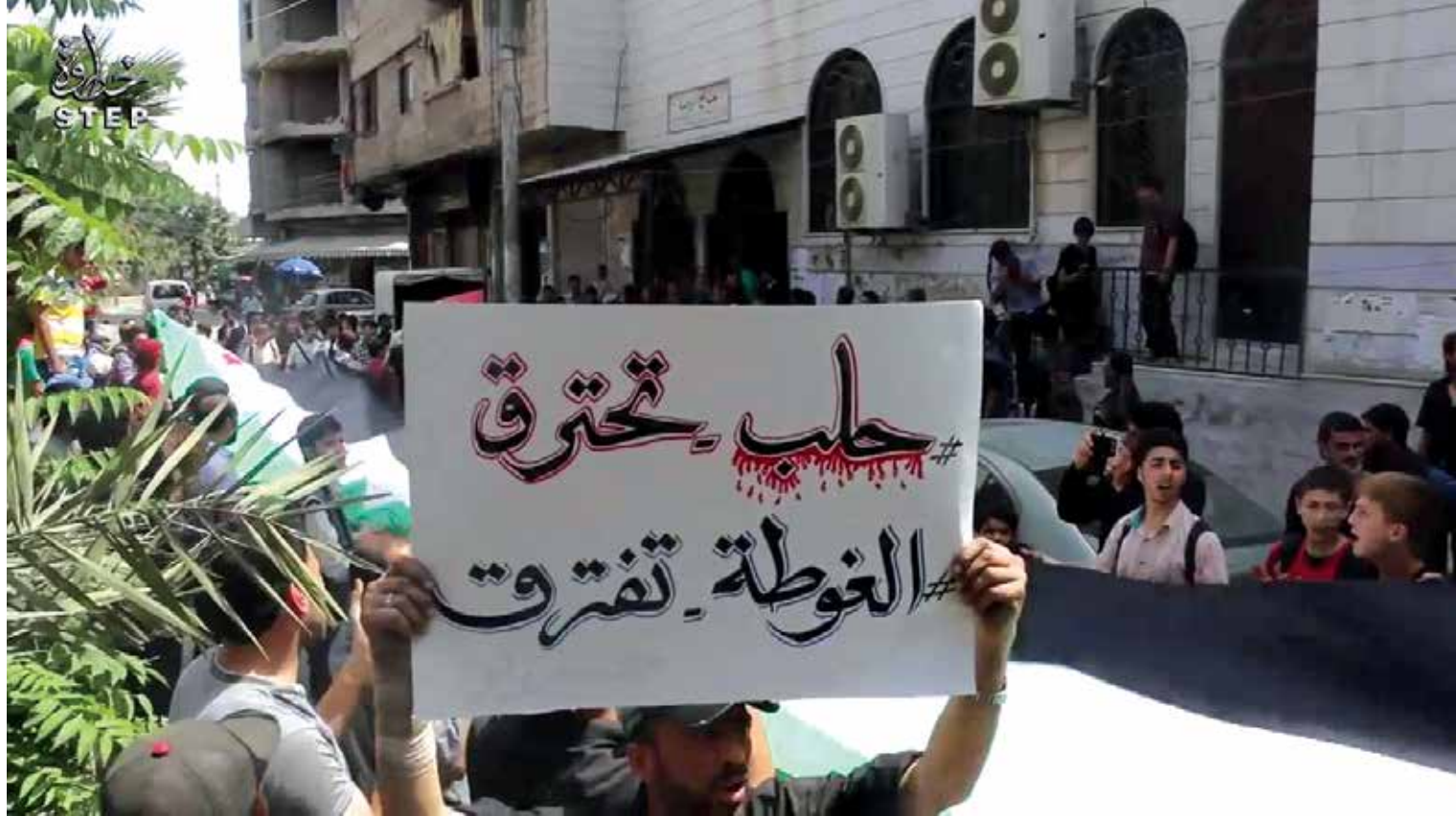
المطلوب في الغوطة الآن.. وقف الاقتتال دون قيد ولا شرط ولا لف ولا دوران

أما القول إنها فتنة، فما يجري أخطر من فتنة؛ إذ يقتل فيها الأثماء وحولهم عدوٌ يفتك بهم. بل إن ما يجري في الغوطة قريب مما نفهمه من الآية الكريمة {والفتنة أشد من القتل}، فنن قال المفسرون بصددها هي "فتنة الإنسان عن دينه"، فما يجري في الغوطة يوشك أن يفتن الناس عن دينهم من شدة التفجير منه نتيجة اختلاط الأمر عند كثير من الناس ما بين ما يقول به الإسلام -وهو بعيد كل البعد عما يجري باسمه في الغوطة حالياً- وبين أفراد يقولون ويتصرفون بما يرونه من وراء القباب لا أصل لها عند التحقيق في معناه، كالشيخ والمفتي والشري، بل هم يستغلون واقع القادة المسلحين أو يستلهم هؤلاء لتنفيذ ما يريدون، وجميعهم يزعم لنفسه خدمة الثورة، ويستحيل أن تخدم أعمالهم الثورة. وفي الحالتين، لا يبرأ القادة من "الإثم" فيما ينفذونه أو يدفعون بالشباب الثوري الصادق لتفنيده، فيصنع ذلك جهلاً، أو خوفاً على نفسه لو طبق قول الرسول صلى الله عليه وسلم "لا طاعة لمخلوق في معصية الخالق".