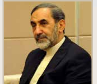
علي أكبر ولايتي مستشار المرشد الأعلى في إيران

«نظام الأسد يحتقر الجهود الدولية الرامية لإعادة تطبيق وقف الأعمال العدائية في سورية، وحين الوقت لكي يستخدم كل من له نفوذ على الأسد، ويقول له كفي (..) ثمة حاجة لمبادرة جديدة في الحوار السوري لإبقائه حياً.. المعارضة السورية المعتدلة تواجه صعوبات متزايدة في تبرير مشاركتها في العملية السياسية، وأتوقع مزيداً من الاجتماعات الدولية في الأسابيع المقبلة أو نحو ذلك.»