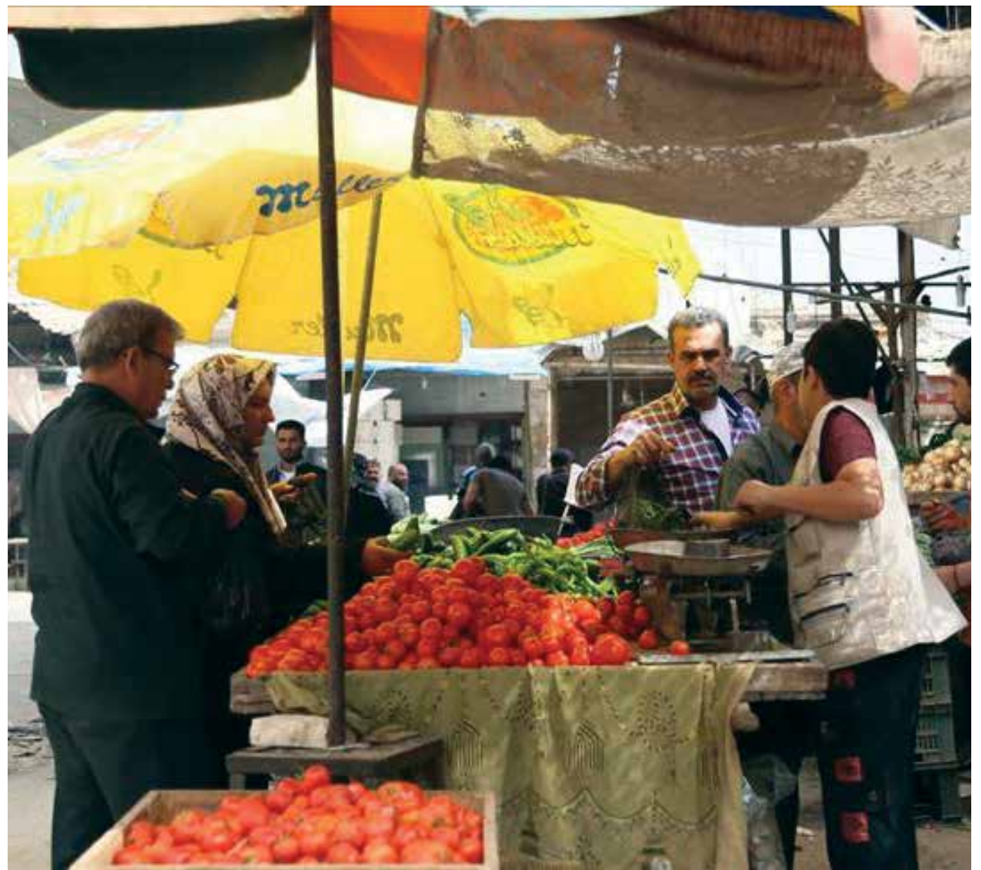
سوق ببعرة العثمان جنوبي إدلب

لم تشهد سوريا سابقاً هذا الارتفاع القياسي في سعر الدولار، حيث ارتفع خلال شهر، أكثر من ١٥٠ ليرة سورية، ليصل سعر صرف الدولار إلى أكثر من ٦٠٠ ليرة سورية هذه الأيام.