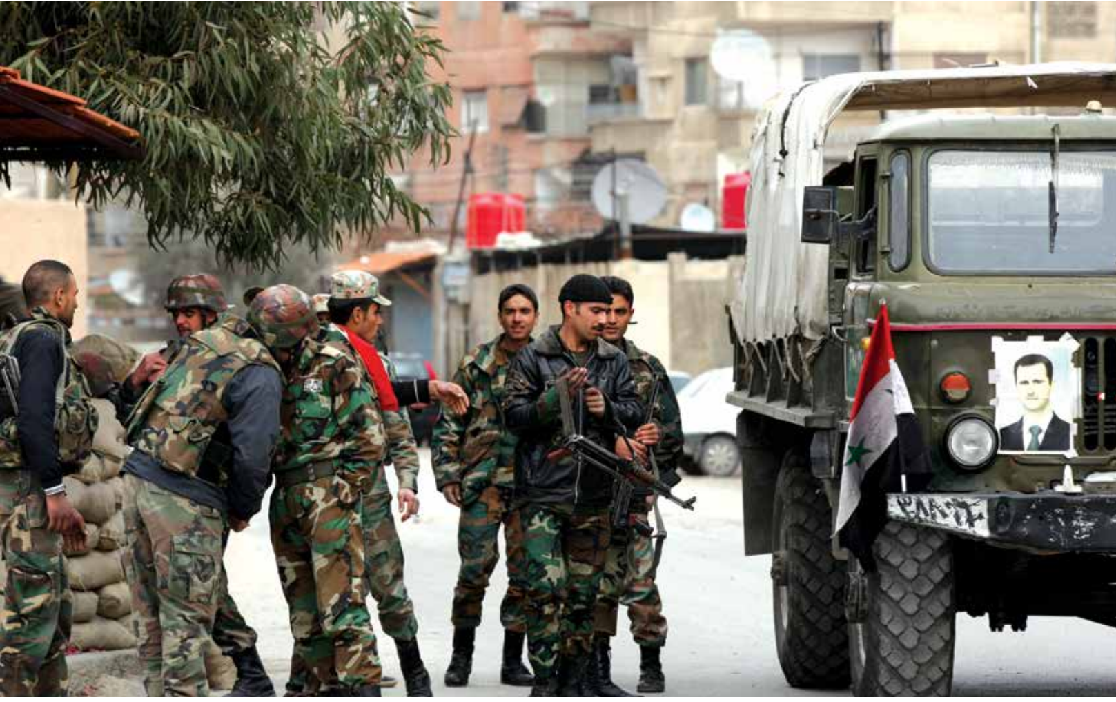
ما زالت عائلات كاملة في حلب ترفد قوات النظام بمقاتلين من أهل المدينة

ويرد أوسو: «لا تزال هذه العائلة بكامل قواها مستمرة في القتال إلى جانب النظام في الأحياء الغربية، وخصوصاً في