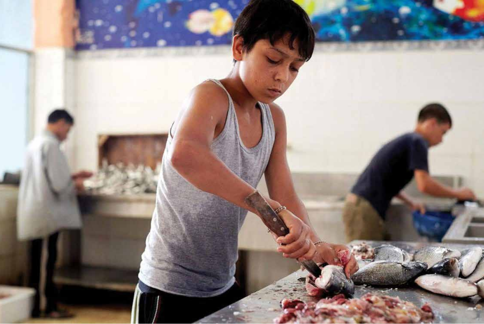
يميل أرباب العمل الأتراك إلى تشغيل السوريين بالأسود للتقليل من أجورهم

من قبل رئاسة التربية والتعليم التركية في حال كان تعيينه لدى مؤسسة تعليمية رسمية. أما إن كان التعيين لدى مؤسسة تعليمية خاصة، فلا يحتاج للمعادلة ويكتفى أن تكون رئاسة التعليم معترفة بالمؤسسة التعليمية التي تخرج منها.