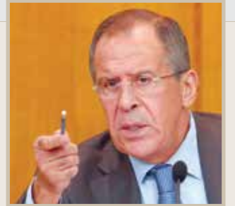
سيرجي لافروف وزير الخارجية الروسي

«الجملة القادمة (من محادثات جنيف حول سورية) كما قلت، مرتقبة في الشهر الجاري، على الأرجح، سيكون الحوار غير مباشر كما كان، مع أنه من الواضح أن البدء بالعمل الفعلي ممكن فقط عندما تجتمع كل الأطراف السورية خلف طاولة مفاوضات واحدة (..) الظروف لم تتهيا بعد لذلك، بالدرجة الأولى، بسبب أن الهيئة العليا للتفاوض، والتي نصبت نفسها بنفسها، لديها نزوات كثيرة تحت تأثير الممولين الخارجيين.»