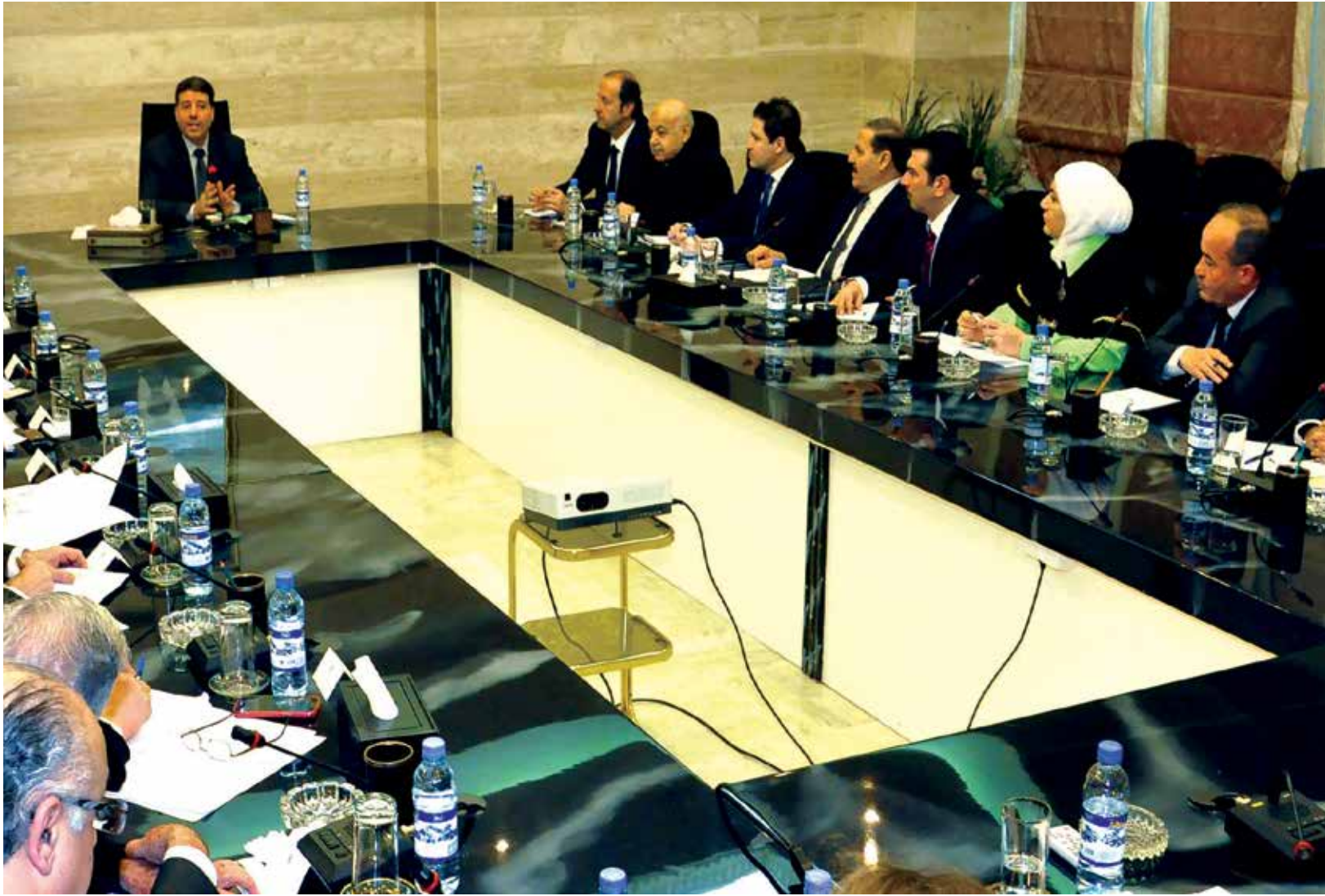
ممثلون عن الجهات السبع المشرفة على الاقتصاد السوري في ورشة عمل حول المشروعات الصغيرة والمتوسطة

فهل من الصعب جداً إيجاد تعريف للمشروعات المتوسطة والصغيرة؟ وهل