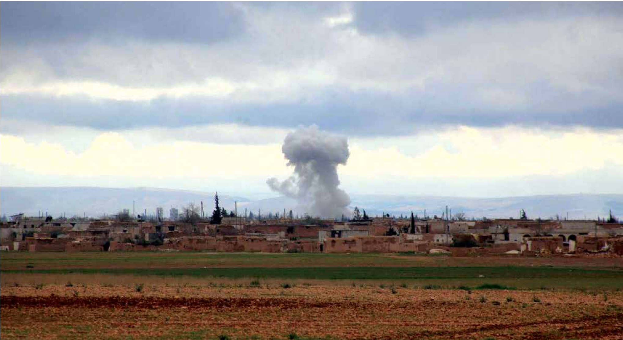
معارك عنيفة الجمعة أدت لخسارة النظام وميليشياته بلدة خان طومان الاستراتيجي جنوبي حلب

"جيش الفتح"، الخصم الأقوى لكل حلفاء الأسد، أيضاً يريد أن يحسم في حلب، وباكورة أعماله في الجبهة الحلبية الجنوبية تقول أنه قادم بقوة، والتضيق بحظر السلاح المفروض (أمريكياً) لا يشكل عقبة أمام قدراته وطموحاته، بعد أن أصبح يُنتج ويُصنع جل ما يستهلك بعملية تأمين ذاتي استطاع الوصول إليها عبر خبرات محلية سورية، إضافة لما يقنمه من مستودعات النظام. القرارات الدولية لم تُحترم ولم تُطبق، والهدن لم تعد حلاً، وكل النوافذ التي يتطلع إليها الشعب السوري تتسم بالسواد الملتصق بالدماء، فهل يستطيع المجتمع الدولي وعبر لحظة صدق، تجاوز تلك المرحلة وإنهاء تلك المأساة التي يعيشها الشعب السوري، عبر ممارسة دوره الحقيقي بالتخلص من نظام ديكتاتوري أدمى قلوب السوريين، كل السوريين؟ الجميع بالانتظار ..