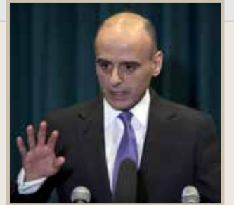
عادل الجبير وزير الخارجية السعودي

«الجملة القادمة (من محادثات جنيف حول سورية) كما قلت، مرتقبة في الشهر الجاري، على الأرجح، سيكون الحوار غير مباشر كما كان، مع أنه من الواضح أن البدء بالعمل الفعلي ممكن فقط عندما تجتمع كل الأطراف السورية خلف طاولة مفاوضات واحدة (..) الظروف لم تتهيا بعد لذلك، بالدرجة الأولى، بسبب أن الهيئة العليا للتفاوض، والتي نصبت نفسها بنفسها، لديها نزوات كثيرة تحت تأثير الممولين الخارجيين.»