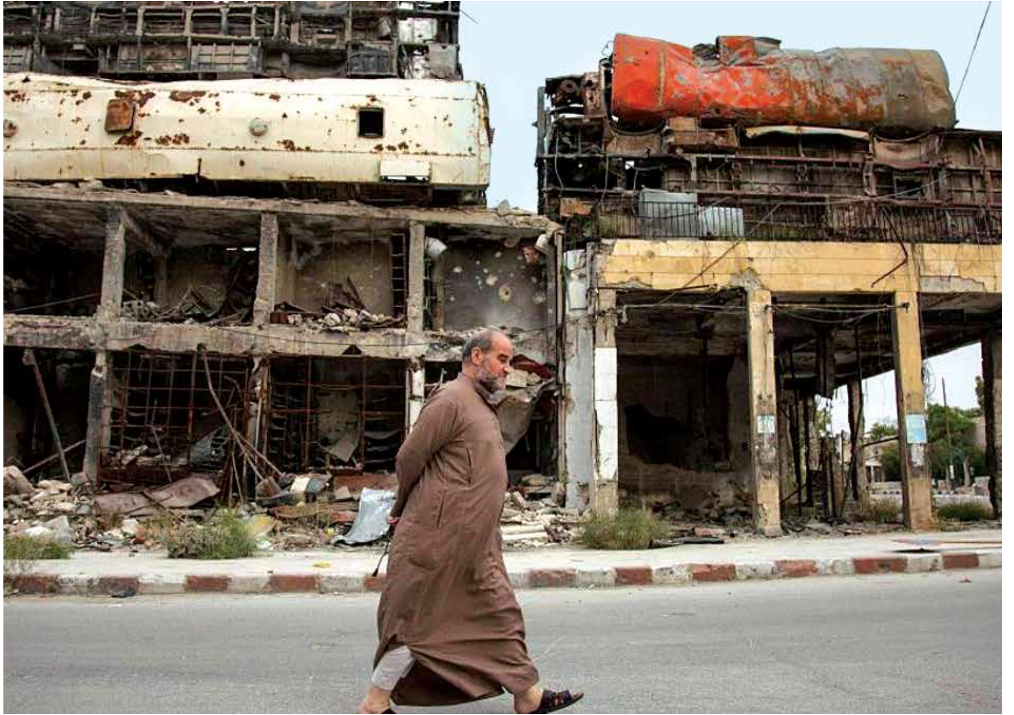
خمسة أيام هادئة بعد أسبوعين داميين في حلب

بعشرات الغارات من الطيران الحربي، استعادة المناطق التي خسرتها، إذ تعرضت بلدة خان طومان ومحيطها لقصف جوي ومدفعي كثيف.