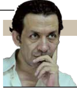
كل عقل نبي