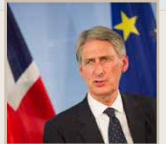
فيليب هاموند وزير الخارجية البريطاني

«ما يحدث من انتهاكات في حلب من قبل طيران النظام وحلفائه هو جرائم ضد الإنسانية وجرائم حرب (..) بشار الأسد لن يستمر في حكم سورية ما دام أن هناك شعباً صامداً ومجتمعاً دولياً داعماً.. سيتم ذلك عبر عملية سياسية كما نأمل، أم سيكون بعمل عسكري، وهذا ما لا يمكننا تحديده في الوقت الراهن.»