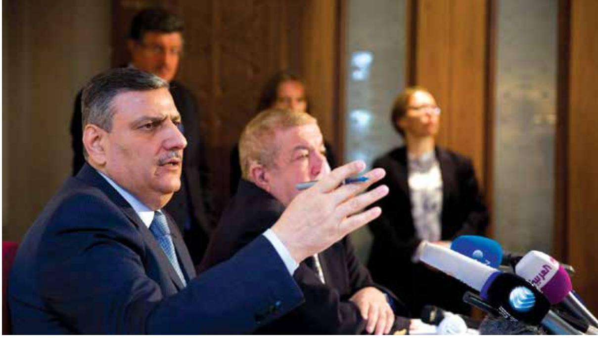
يلتقي حجاب بعدد من المسؤولين الأوروبيين خلال هذا الأسبوع

ويناقش المجتمعون، مجمل القضايا في الملف السوري، وتطرّق العملية السياسية في جنيف، ومحاوله إحراز تقدم في النقاط العالقة، بهدف العودة للمفاوضات، التي تصر المعارضة السورية، على تهيئة الظروف قبل استئنافها وضمان تنفيذ كامل بنود قرار مجلس الأمن الدولي رقم ٢٢٥٤، وكذلك على أن تبحث المفاوضات في الملفات الجوهرية، وأبرزها تحقيق الانتقال السياسي، من خلال هيئة حكم انتقالية كاملة الصلاحيات، لا دور لبشار الأسد فيها.