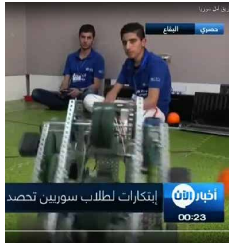
تقرير قناة الآن عن فريق أمل سوريا

بعد أن حقق فريق أمل سوريا المكون من مجموعة من الشباب السوريين اللاجئين في لبنان، فوزاً كبيراً في مسابقة الروبوت الدولية التي أقيمت في الجامعة الأميركية في بيروت، وتأهل للمسابقة الدولية التي أقيمت في الولايات المتحدة الأميركية، وقد شاهد العالم كله شباب الفريق وهم يرفعون علم الثورة عالياً بين أعلام الدول المشاركة، لم يجد إعلام النظام طريقة للحديث عن هذا الإنجاز السوري غير المسبوق أو أن يجيروه لمصلحتهم، وهم الذين يتغنون ليل نهار بأنهم رعاة المعلوماتية، وبأن قاتلهم القائد ثورة المعلوماتية في سوريا، فلم يجدوا سوى أن يفرقوا لقاءً مع ثلاثة طلاب من إحدى المدارس التي يمتلكها أحد لصوص السلطة، وهي المدرسة الوطنية، ويقولوا إن الفريق حاز على الجائزة الأولى لمسابقة الروبوت الوطنية في لبنان. وقد عرض الطلاب الثلاثة اختراعهم وتحدثوا كما تم تلقينهم عن مشاريعهم وأفكارهم. لكن لدى البحث في شبكة الإنترنت عن خبر ولو كان صغيراً، عن تلك المسابقة أو الجائزة، فلن تجد اسماً لا للمدرسة الوطنية السورية ولا لطلابها. ولأن إعلام النظام يكذب في كل شيء فقد ألف هذا الخبر تأليفاً، وابتكر جائزة لم يسمع بها أحد سواهم، كي يسرقوا إنجاز «أمل سوريا الحقيقي». ولأنهم يستخفون بعقول مشاهديهم، فلم يكلفوا أنفسهم عناء عرض ولو لفظة مدتها خمس ثوان لفريقهم المزعوم وهو يتسلم جائزته المزعومة... تخيلوا أية وضاعة وصلوا إليها!!