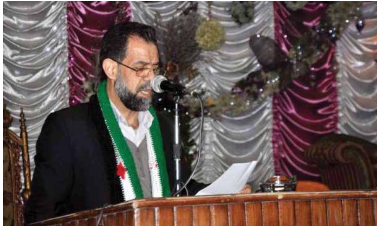
الناشط السياسي نزار الصمادي