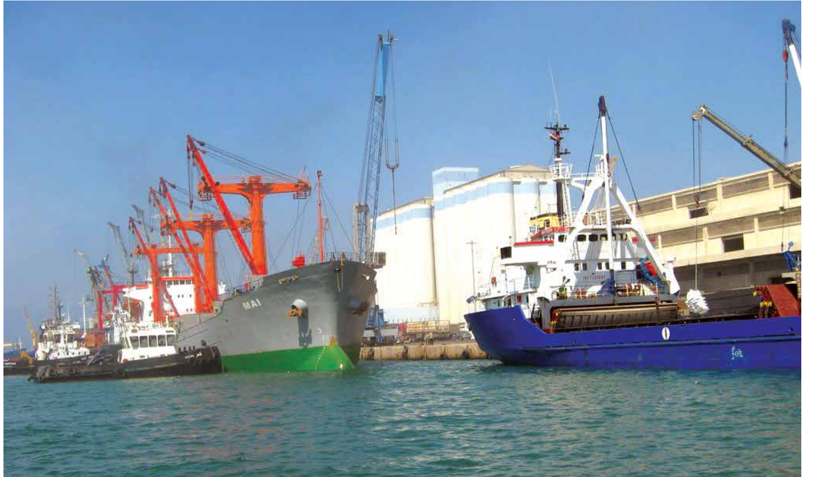
أدى إغلاق المعابر البرية وزيادة الضغط على النظام، إلى توجهه باتجاه روسيا عبر معبرها البحري الوحيد في طرطوس (الانترنت)

كما استفاد النظام من موقف روسي المساند له ومداه بالمال والسلاح، حيث