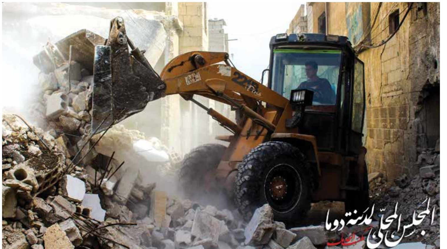
لم تتوقف المؤسسات الخدمية في دوما عن العمل رغم القصف المتواصل والحصار المطبق

في مسيرة العمل المؤسساتي تظهر كفاءات، ويجب دفعها للأمام. مقابل ذلك،