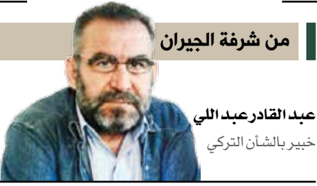
من شرفة الجيران