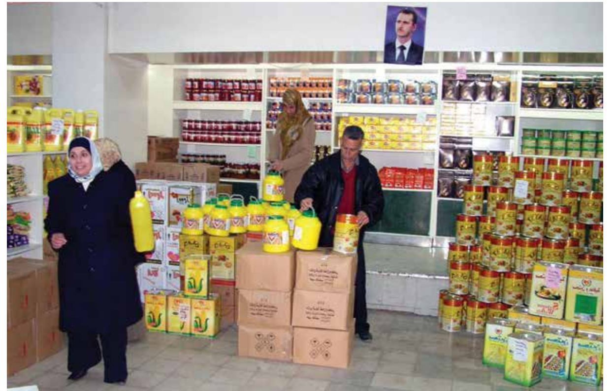
تعثر العمل في المؤسسة العامة للخرن والتسويق منذ انطلاقها بسبب الفساد الذي استشرى فوراً في مفاصلها.

قيمة المبيعات بلغت مليارات ٥٠٠ مليون ليرة سورية، من أصل الخطة المقررة والبالغة ٣,٣١ ملايين ل.س، أي بنسبة تنفيذ ٤٠٠٪. أما المشتريات فقد بلغت مليارات ٢٠٠ مليون ليرة سورية من أصل الخطة المقررة والبالغة ٢٥٠ مليون ليرة سورية، أي بنسبة تفوق ٤٠٠٪. رغم أن فرع المؤسسة في حمص تضرر كثيرا خلال الأحداث التي شهدتها المدينة». واللافت في هذا الخبر هو الفرق ما بين مشتريات فرع حمص ومبيعاته، حيث نجد أن الفارق، وهو عمليا الربح الإجمالي، قد بلغ ٣٠٠ مليون ليرة سورية. أي أن نسبة الربح قد بلغت ٢٥٪. هذه النسبة