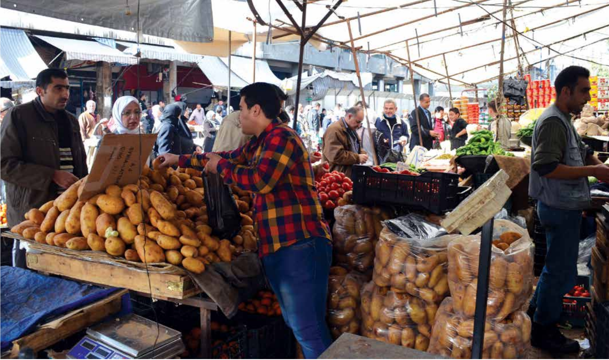
أسواق الخضار والفواكه والغذائيات بمختلف أنواعها في مناطق النظام، سوف تشهد تراجعاً حاداً بالمواد بغضون شهر من الآن

تتميز سوريا بموقع جغرافي حساس بين الدول المحيطة بها، حيث يطلق عليها «بلد المعابر» نظراً لوجود ١٩ معبراً برياً مع دول الجوار، وكونها تعد بوابة عبور رئيسية لا يمكن الاستغناء عنها في الحركة التجارية بين دول أوروبا والخليج العربي، ومنفذاً بحرياً اقتصادياً لدول كالعراق والأردن. وتوضيح الأرقام الرسمية أن نحو ١٣٧ ألف شاحنة كانت تنقل بضائع وسلعاً بين الشرق والغرب عبر الأراضي السورية، ما أدى إلى ارتفاع قيمة تجارة الترانزيت لتحقيق في عام ٢٠٠٨ نحو ١٢٦ مليار ليرة، ووصول كمية البضائع المنقولة إلى خارج البلاد إلى أكثر من ٤,٣ ملايين طن في عام ٢٠١٠.