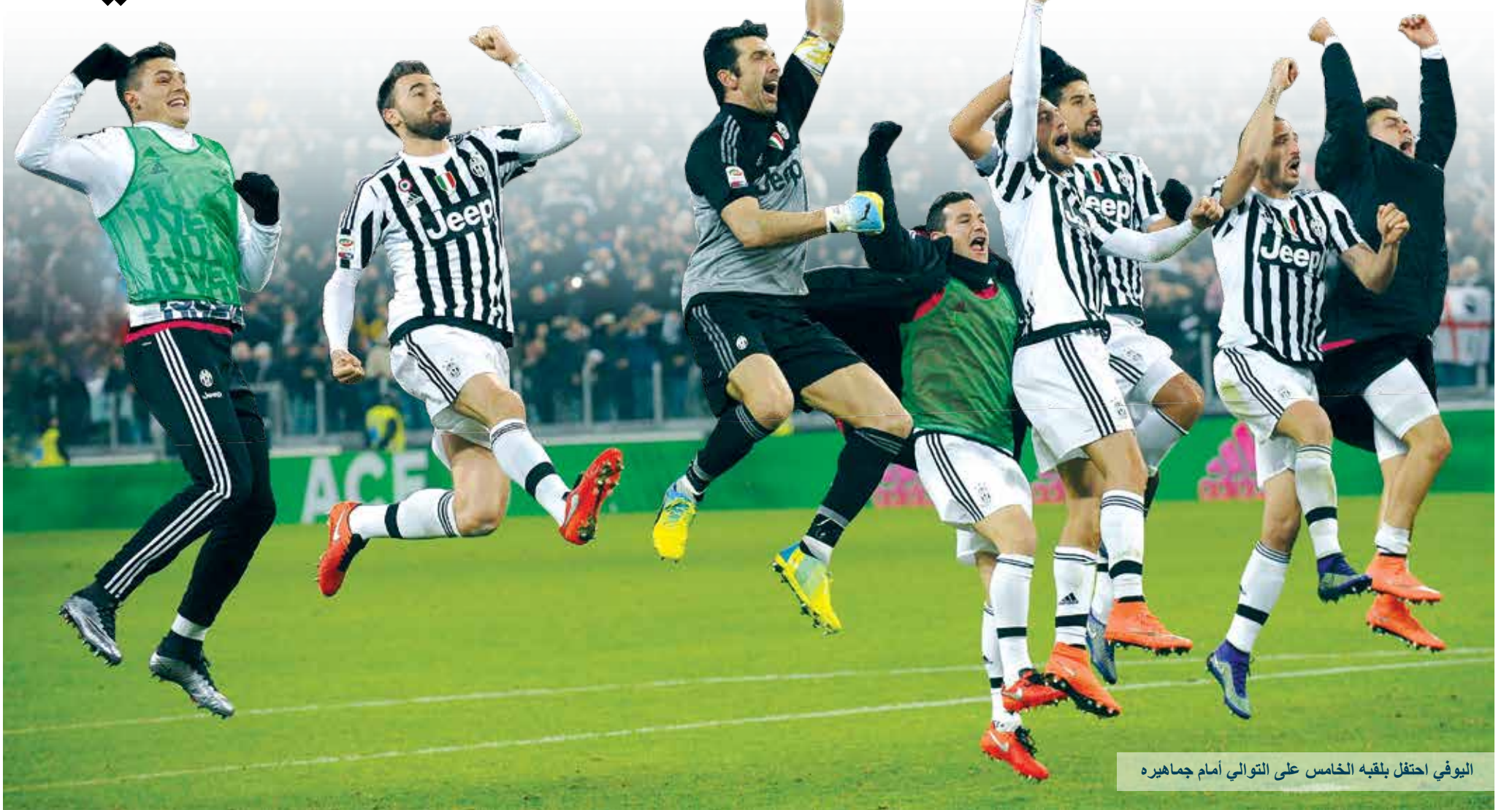
اليوفي احتفل بلقبه الخامس على التوالي أمام جماهيره