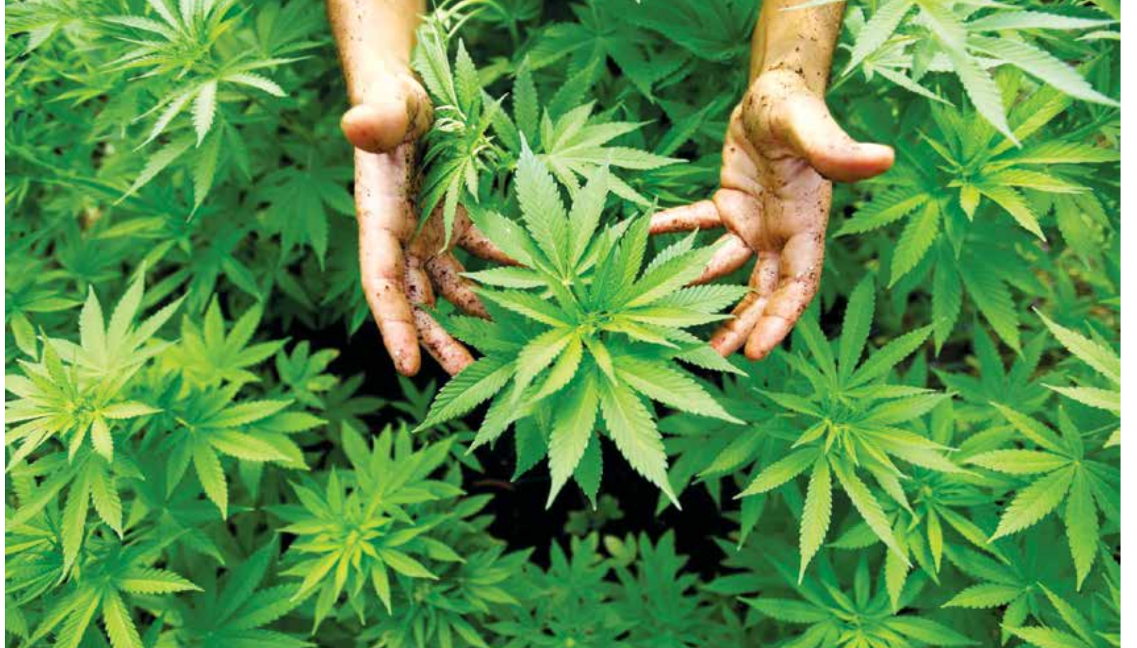
مناطق عدة في ريف إدلب وحلب باتت مصدراً مهماً للحشيش المهرب إلى تركيا