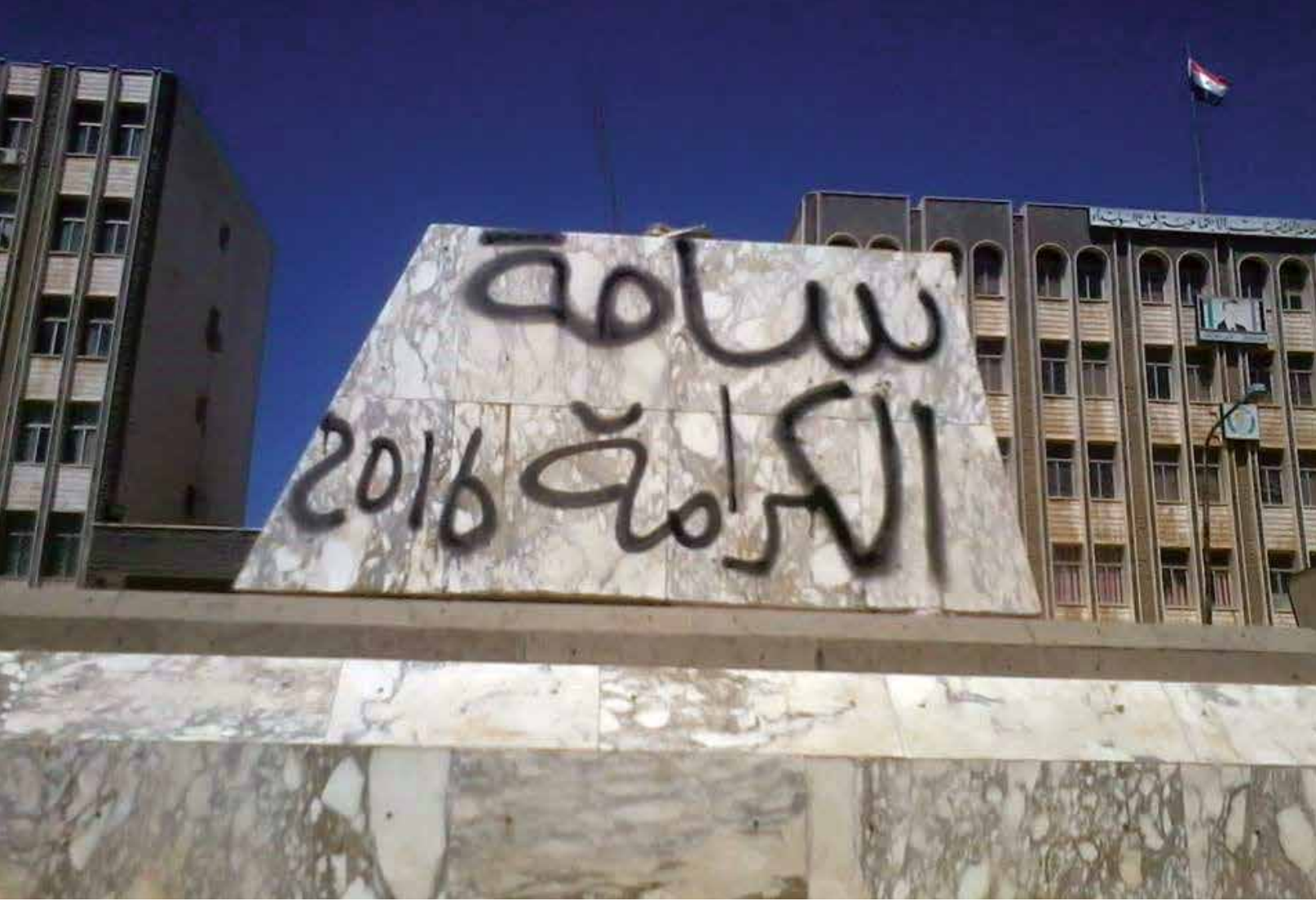
أطلق شباب السويداء التائر اسم ساحة الكرامة على الساحة الرئيسية في مدينتهم، بعد أن أزالوا منها صنم الطاغية