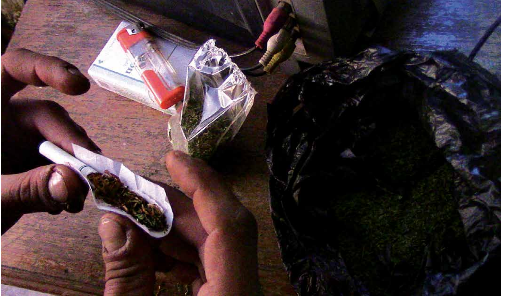
الشباب السوريون هم الأكثر تعاطياً للحشيش في تركيا

لم يكن تعاطي نبتة القنب الهندي، أو ما يعرف بالحشيش، رائجاً في سوريا سابقاً، كانتشاره ورواجه في دول أخرى مثل لبنان واليمن. ولكن الفوضى التي تعيشها البلاد إثر الحرب وما خلفته من دمار طال السوريين في الداخل والخارج، ساهم في رواج هذه الظاهرة وانتشارها بين السوريين في تركيا، خاصة في المدن الحدودية. ولم يعد تدخين الحشيش يتم في الخفاء كما كان في السابق، بل صار متعاطو الحشيش يدخلون لافاتهم في أي مكان، حتى في أماكن العمل. وبعد أن كان تدخين الحشيش يعد خرقاً للأعراف، يقود إلى نكد من يقوم به ممن حوله، أصبح اليوم «مهرباً وحريراً من قيود الواقع»، بحسب معظم المتعاطين السوريين.