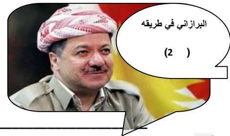
البرازاني في طريقه