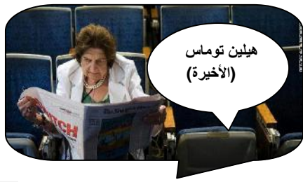
هيلين توماس (الأخيرة)