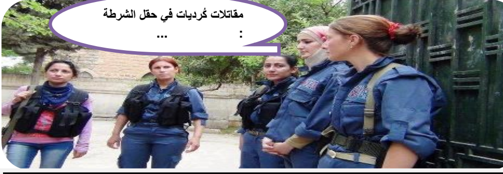
مقاتلات كُرديات في حقل الشرطة