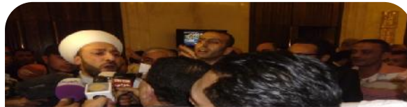
صورة من الأرشيف: هكذا الكاميرات!

يتأملون وجها لوجه العربية جنيف-2 شهر الأمريكيين يبدو ... الهيئة جهة واتهام " بهم أوربية روسية أنهم سيحضرون بصفتهم .. يطرح نفسه هل الهيئة هذا بين أعضائها جنيف-2 هنا