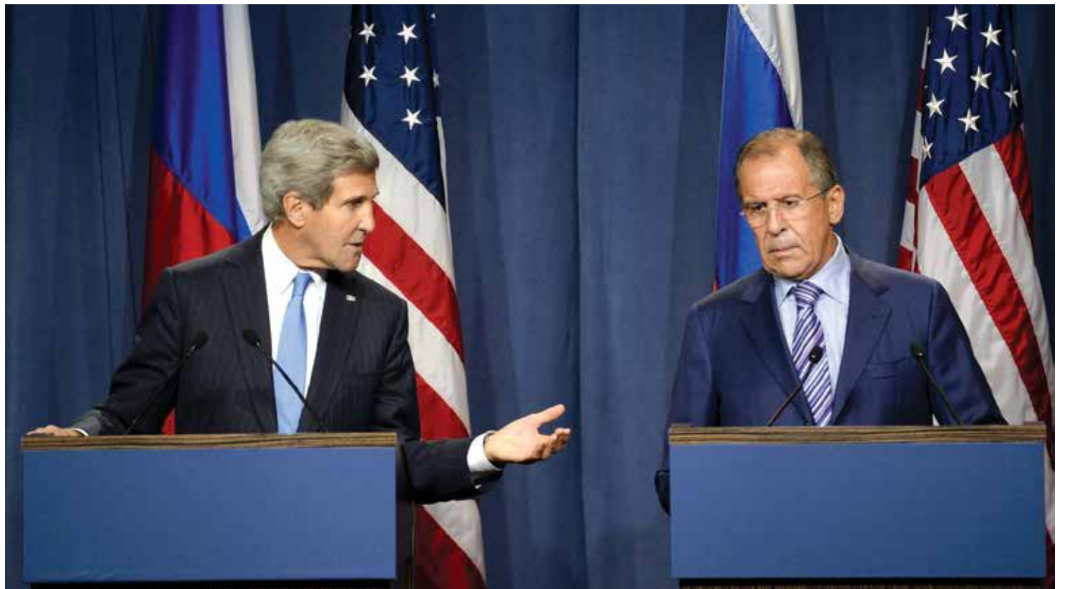
مشاورات للمعارضة ما قبل جنيف.. وموسكو تنفي وجود اتفاق مع واشنطن حول سوريا

وكان المتحدث باسم الهيئة العليا للمفاوضات، رياض نصبان آغا، قد رفض التعليق على التسريبات التي تحدثت عن أن وزير الخارجية الأمريكي جون كيري، أبلغ دولاً عربية معينة بأن الولايات المتحدة وروسيا توصلتا إلى تفاهم على مستقبل العملية السياسية في سورية، من ضمنه رحيل الأسد إلى دولة أخرى من