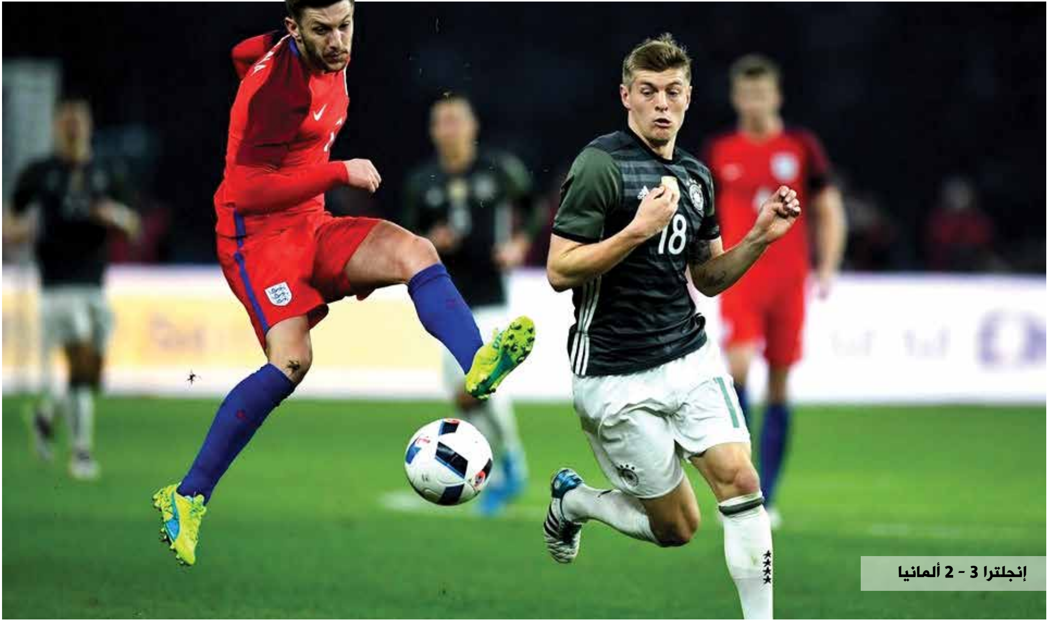
إنجلترا 3 - 2 ألمانيا