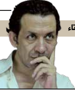
فضائيات بفتح التاء