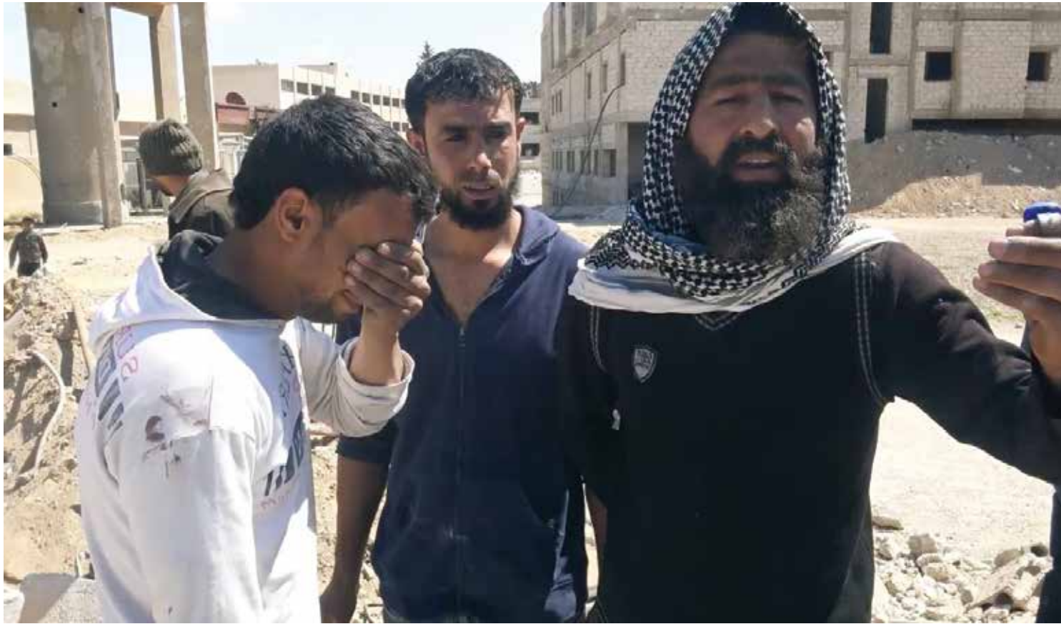
مجزرة جديدة للنظام، تفجّع أهالي دير العاصير بعشرين شهيداً منهم

بأن «وحدة من الجيش بالتعاون مع مجموعات الدفاع الشعبية نفذت خلال الساعات الماضية عمليات مكثفة على مقرات وتحصينات اراهبيبي داعش في مدينة القريتين» و«أسفرت عن فرض السيطرة على المزارع الجنوبية والنقطة ٨٦١ في محيط المدينة». وكان ناشطون قد أكدوا أن طيران الأسد ارتكب مجزرة جديدة بحق أهالي بلدة دير العاصير في غوطة دمشق الشرقية، يوم أمس الخميس، باستهدافه المشفى الوحيدة في البلدة، ومدرستها، ومركز الدفاع المدني فيها، بعدة غارات جوية، قاربت ١٧ غارة على الأقل، وقتلت أكثر من ٢٠ مدنياً وجرحت أكثر من ٣٠ آخرين. هذا وقد شهدت مدن وبلدات غوطة دمشق هدوءاً نسبياً بعد سريان الهدنة في ٢٧ شباط الماضي، إلا أن الطيران الحربي يستهدفها بشكل متقطع، وخاصة مدن وبلدات منطقة المرح التي تشهد معارك بين المعارضة وقوات الأسد. وتحاول قوات الأسد جاهدة التقدم في المناطق الفاصلة بين بلدتي بالاء وحرسنا القنطرة، في محاولة لإحكام السيطرة على دير العاصير وزبدین وبلدات أخرى مجاورة لهما، محاولة فصل القطاع الجنوبي للغوطة، الذي يتميز بأهمية خاصة لأهالي المنطقة، إذ تتواجد فيه الأراضي الزراعية الصالحة للاستثمار، بعد انعدام إمكانيات الاستفادة من معظم أراضي المنطقة.