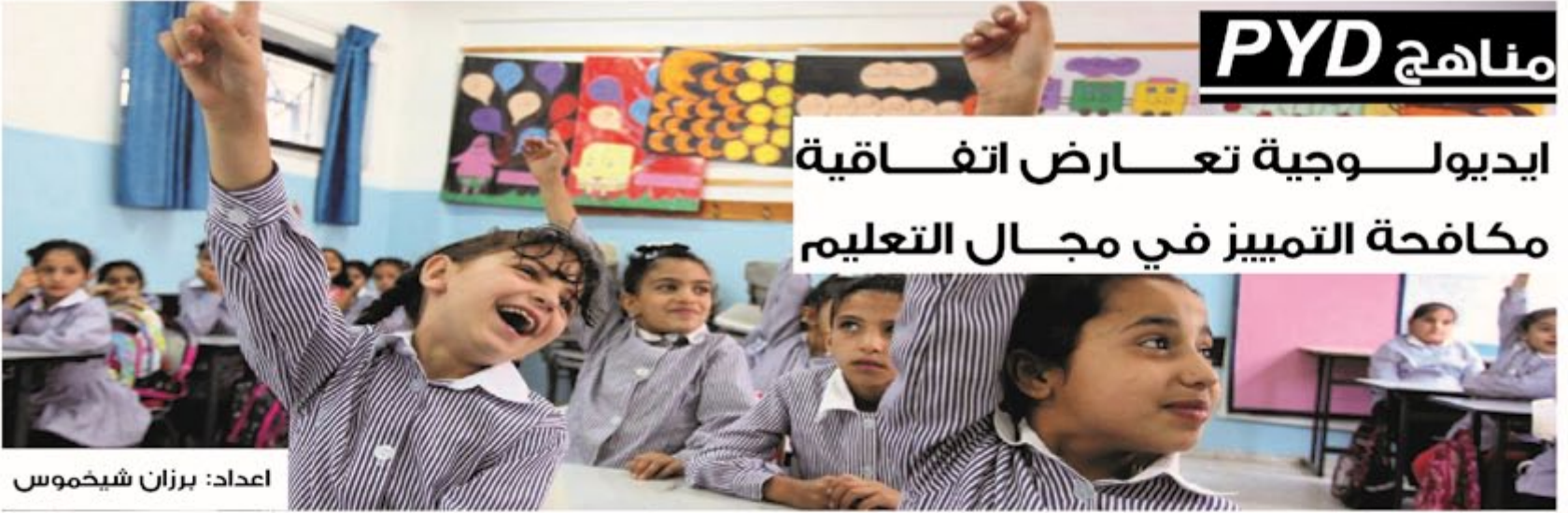
اعداد: برزان شيخموس

يكون باستطاعتها احتواء هذه العملية التي تحتاج إلى استكمال جميع المراحل لغاية الجامعة والتي من المفترض أن تكون معترف بها ويمكن لحامل شهادتها العمل بها أين ما شاء". حاج قاسم أشار أن الكادر التدريسي يلعب دوراً رائد في تربية التلاميذ نفسياً لتلقي العملية التربوية، وعليهم أن يكونوا قدوة صالحة لتلاميذهم يبعثوا فيهم الطمأنينة والثقة بالنفس، مضيفاً أنه لا يتقيد أنملة بهؤلاء المدرسين ووصفهم بأنهم ثلة من الجهلة والمتخلفين حزبياً، وربما هم قد أرسلوا أبناءهم إلى مدارس خاصة لا تدرس فيها مناهج الأمة الديمقراطية.