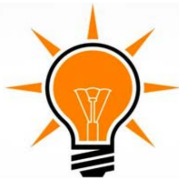
حزب العدالة و التنمية السوري

أعلن حزب العدالة والتنمية السوري عبر بيان أصدره في الرابع عشر من شباط/٢٠١٦، تأييده المطلق لخطة دول التحالف الإسلامي. وطالب البيان جميع السوريين الوحدة حول ذلك القرار الشجاع السعودي - التركي، ويحيي أبطال القوات المسلحة لجميع الدول التي ستشارك في هذه المعركة وخاصة أبطال جيش العربية السعودية وتركيا اللذان سيتحملان العبء الأكبر كونهما أكبر دولتان إسلاميتان ومناصرتان للشعب السوري وثورته المباركة، ودعا العالم الحر لدعم هذه العملية التي ستخلص سوريا من الإرهاب الأسود - الداعشي والتي ستوقف مأساة السوريين في القتل والتشريد والتهجير إلى أوروبا والعالم ..