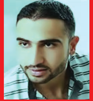
الشهيد إبراهيم قاشوش

(٣ سبتمبر ١٩٧٧ - ٤ يوليو ٢٠١١) شاب سوري (رجل إطفاء) من مدينة حماة منشد المظاهرات الشعبية المعارضة في حماة نشط إبان الاحتجاجات الشعبية السورية في قيادة المظاهرات التي تهتف بإسقاط بشار الأسد وتأييد الشعارات المناوئة للحكومة السورية وقيادتها بما فيها بشار شخصياً وشقيقه ماهر وحزب البعث وإنشادها أمام الجماهير في ساحة العاصي في قلب حماة ومن بينها أنشودة (يلا ارحل يا بشار). وفي خضم الحملة الأمنية التي نفذها الجيش السوري في أعقاب (جمعة ارحل) ١ يوليو ٢٠١١ والتي احتشد فيها زهاء نصف مليون متظاهر في ساحة العاصي في حماة مطالبين بإسقاط النظام وأقيل على إثرها المحافظ.