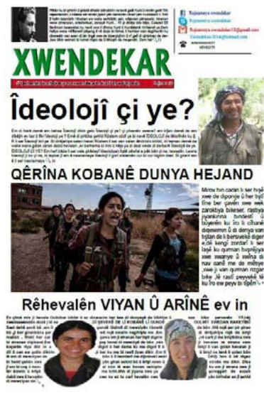
جريدة خوندكار الطلابية تصدر بحلته الجديدة