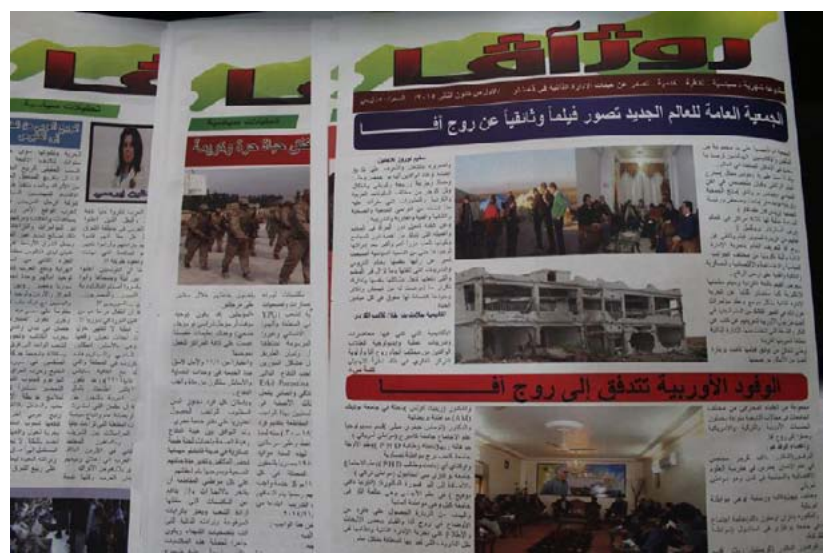
الخاصة بحكومة مقاطعة الجزيرة صدور العدد الأول من جريدة روج آفا