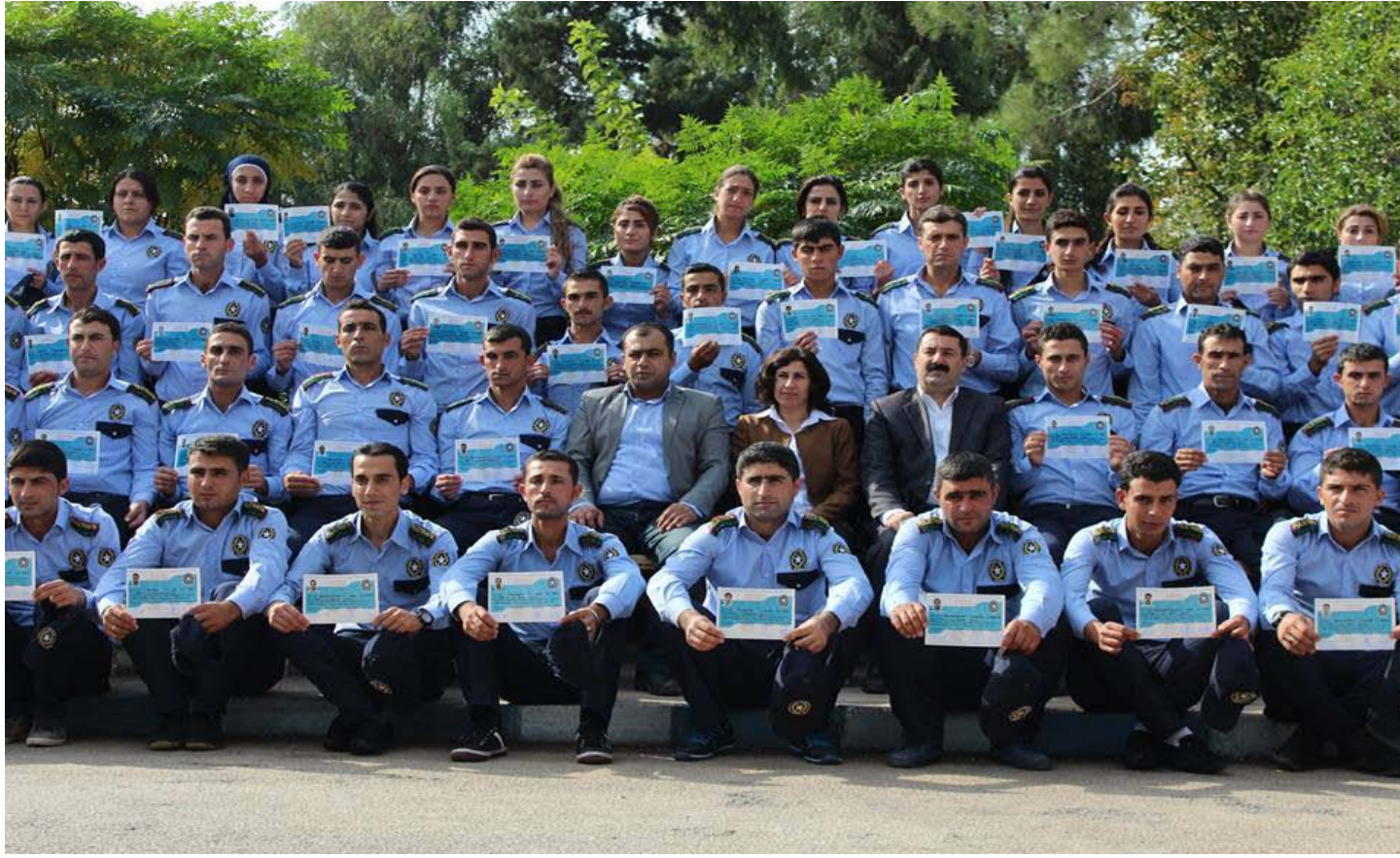
تخريج أول دفعة من بوليس المرور في روج آفا - مقاطعة الجزيرة