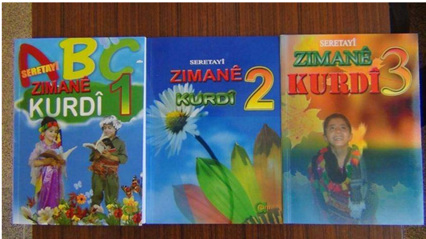
كتب تعليم اللغة الكوردية للمرحلة الأساسية