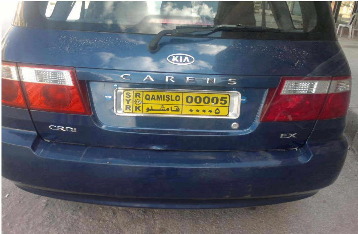
لوحات السيارات في مقاطعة الجزيرة