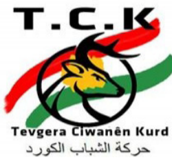
Tevgera Ciwanên Kurd حركة الشباب الكورد

-ضعف وهزل المجلس الوطني الكردي المبني على توافقات حزبية غير مجدية وغير عادلة . -تباين مواقف الأطراف الموجودة داخله .