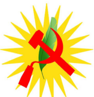
Komunistî Kurdistan Partî ( K . K . P ) الحزب الشيوعي الكوردستاني

ثورتنا في روژافا ، وأكد رفضه للاقتتال الكردي - الكردي لأنه خدمة جليلة لأعداء شعبنا ، ، وأبدت رفضها لكل من يدعو إلى تشكيل أكثر من قوة عسكرية بينما توجد وحدات حماية الشعب التي تتألف من عدة مكونات وهي تدافع عن ثورتنا ونرفض بشدة التجهج على هذه الوحدات تحت أي ذريعة أو حجة لأنها تعتبر باطلية من الأساس بحسب الحزب الشيوعي .