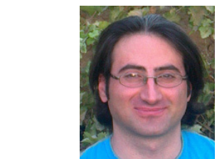
* بقلم : دلشاد مراد - رئيس تحرير الصحيفة

اجتمعت لجنة إعداد وصياغة مشروع العقد الاجتماعي المؤقت في غرب كردستان المتكونة من ٢١ عضواً من حقوقيين ومحامين والباحثين الاجتماعيين، بتاريخ ١٥ - ٠٦ - ٢٠١٣ وبعد مناقشات مطولة توصلت اللجنة إلى تشكيل ثلاث لجان قسمت العمل فيما بينهم واللجان الثلاثة هي: لجنة صياغة مسودة المبادئ الأساسية لهذا العقد، ولجنة المتابعة والفعلية ولجنة الإعلام والعلاقات العامة. وبتاريخ ٢٢/٦/٢٠١٣ عقدت اللجنة اجتماعها الثاني وبكامل أعضائها ، وبعد مناقشة مطولة للامهام المكلفة بها اللجان الثلاثة -لجنة اعداد وصياغة مسودة مشروع العقد - اللجنة الاعلامية -لجنة البحث والمتابعة - خلال المدة الواقعة بين ١٥/٦/٢٠١٣ ولغاية ٢٢/٦/٢٠١٣ تم