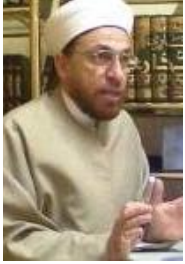
يكتبها: المعتر بالله الخنزوي