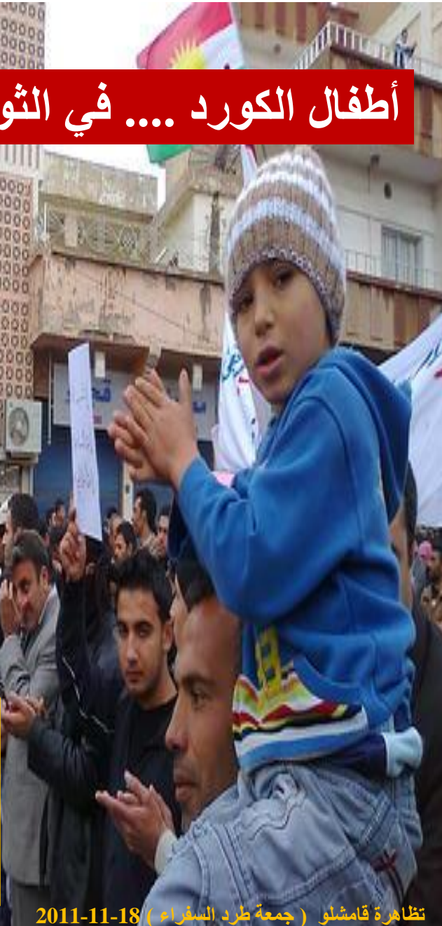
تظاهرة قامشلو ( جمعة طرد السفراء ) 2011-11-18