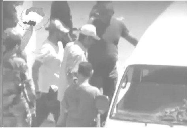
صورة العدد: استخدام سيارات الإسعاف من قبل الأمن والشبيحة- دوما ١٢-٨-٢٠١١