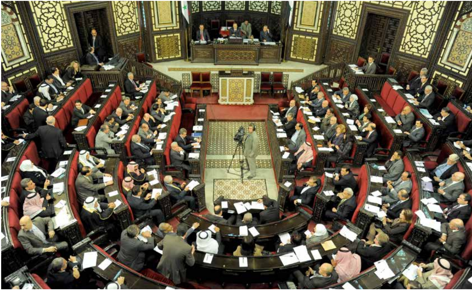
مجلس الشعب يقبّل قانوناً يبيح بموجبه مؤسسات القطاع العام بأبخس الأثمان

يبدو أنه في سورية الأسد فقط، الرئيس هو من يصنف «ثابت وطني»، ومساحة المتر المربع التي يقف عليها هي فقط حدود السيادة الوطنية، تلك المبادئ التي كرسها «القائد الخالد» وسار عليها ولده من بعده، والذي تحول إلى مختار حي بدلا من رئيس دولة، في سبيل ذلك المتر المربع، وحول السماء السورية إلى ميدان لتدريب الطيارين من كل دول العالم، وأرضها مشاعا للمرتزقة ولذات الأسباب. ولكن من «شابه أباه ما ظلم» سياسيا وعسكريا، أما اقتصاديا فلم تعد تجربة القائد الخالد كافية لسد أفواه الكلاب المسعورة من مستفيدين يدورون في فلك النظام، فذهب المال العام لم يعد مجد بعد أن تحولت مؤسسات القطاع العام وبعد ثلاثة عقود من حكم الأب، إلى هياكل عظمية خالية الدسم، لذا صار لزاما استهلاك فكر راحل آخر هو رائد التطوير والتحديث الاقتصادي، وبوابة دخول سورية إلى عالم السوق الاجتماعي «عبد الله الدردري»، الراحل عن مؤسسات النظام عندما تهاوت، والباقي في الدنيا جسدا وفي الاقتصاد السوري فكرا ومنجأ.