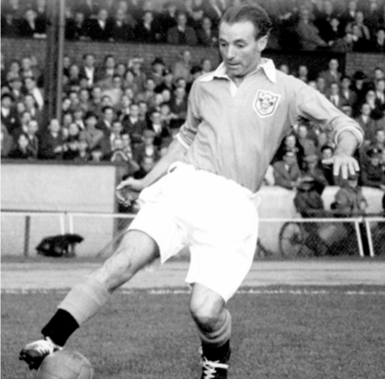
الانكليزي ستانلي ماتيويس أول لاعب يفوز بجائزة الكرة الذهبية عام ١٩٥٦