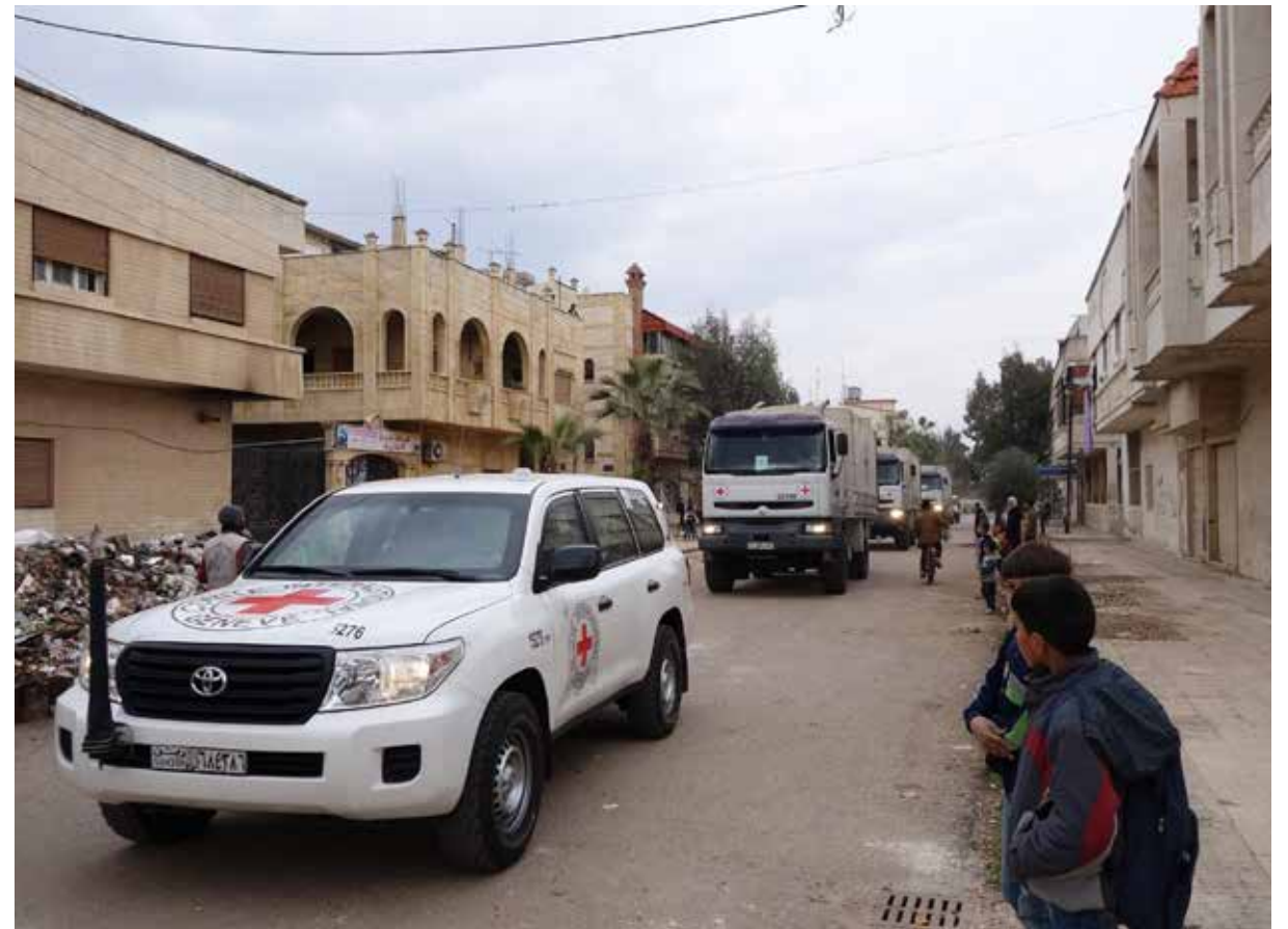
المساعدات الواصلة إلى مضايا لا تكفي المحاصرين أكثر من شهر واحد... وتحذيرات من تكرار المأساة

تتعرض بلدة مضايا الواقعة شمال غرب العاصمة دمشق في سلسلة جبال لبنان الشرقية، إلى حصار خانق بفعل إحكام الطوق على البلدة، والذي فرضه حزب