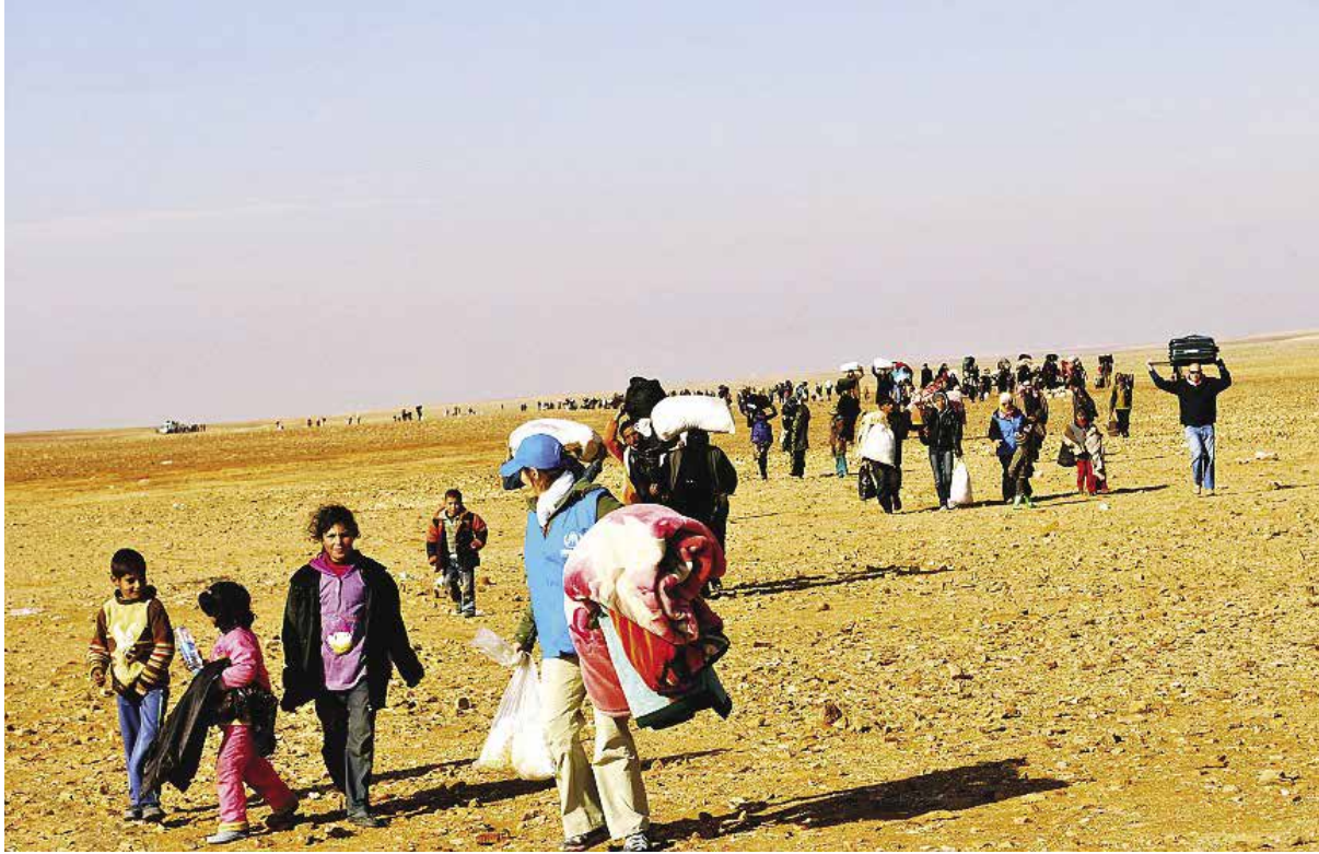
آلاف السوريين عالقون في العراء في صحراء الرويشد على الحدود السورية الأردنية

من محافظة السويداء، مما يشكل خطراً كبيراً على اللاجئين.