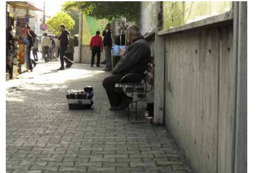
٢,٢ مليون لاجئ سوري في تركيا. وتوقعات بوصول العدد إلى ٣ ملايين

فها هي القيادة السورية الحكيمة تسير على نهج الاقتصادي الملهم «عبد الله الدردري»، ضاربة عرض الحائط بكل الانتقادات التي وجهت إلى تجاربه الاقتصادية التي أقرت السوريين، وكانت إحدى الأسباب المباشرة لاندلاع الثورة، بحسب مؤيدي النظام أنفسهم، لتعيد طرح قانون التشاركية بين القطاعين العام والخاص بصورة موسعة تشمل كل ما يسمى ببنية تحتية، وكل ما يندرج تحت بند القطاع العام، عدا «الثوابت الوطنية» و«الثروة الباطنية»، حسب مشروع القرار الذي طرح على مجلس الذمى، وتم إقراره في جلسة ٢٠١٥/١٢/٢٨، رغم أن الثروة الباطنية ومنذ زمن بعيد قد أعطيت حقوق التفتيش عنها واستثمارها لشركات أجنبية. أما الثوابت الوطنية، والتي لم يحدد مشروع القانون ماهيتها، فاعتقد أن المقصود بها