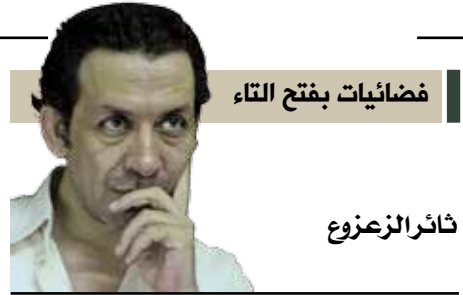
فضائيات بفتح التاء