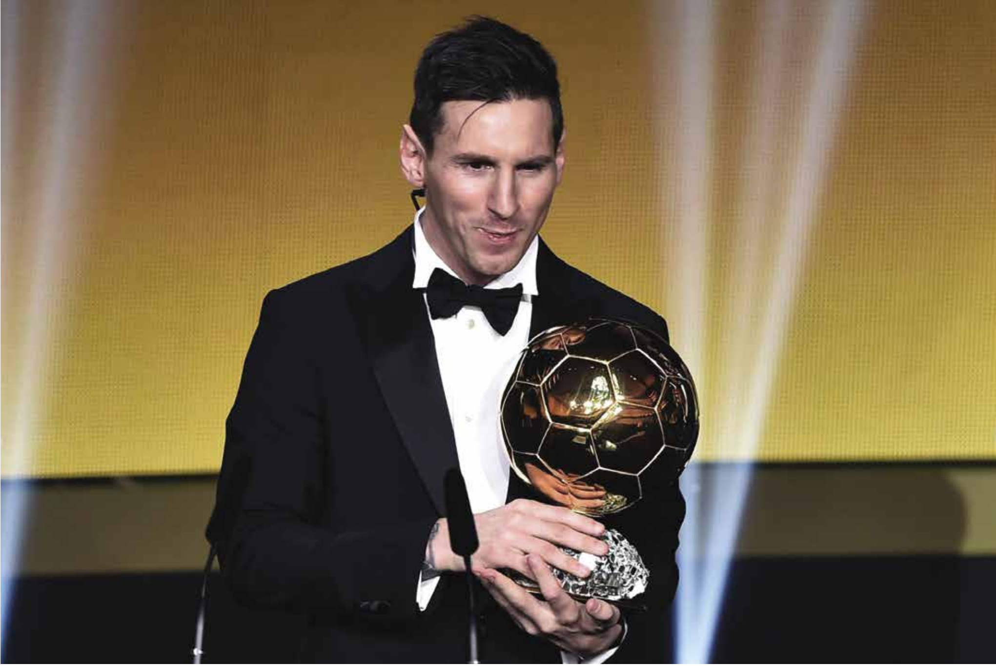
اللاعب الأرجنتيني ليونيل ميسي أثناء تسلمه جائزة الكرة الذهبية للمرة الخامسة

توجّ النجم الأرجنتيني ليونيل ميسي، لاعب برشلونة الإسباني، بجائزة الكرة الذهبية كأفضل لاعب في العالم عام ٢٠١٥، وذلك خلال حفل «فيفا» الذي أقيم في سويسرا. وحصل ميسي على الكرة الذهبية بعدما حصد المركز الأول في التصويت، حيث جاءت نسبته ٤١,٣٣٪، متفوقاً على الثنائي كرسيتيانو رونالدو ونيمار، بفارق كبير. وجاء النجم البرتغالي رونالدو في المركز الثاني، بعدما حصل على ٢٧,٧٦٪ من نسبة الأصوات، فيما حل نيمار ثالثاً بنسبة ٧,٨٦٪.