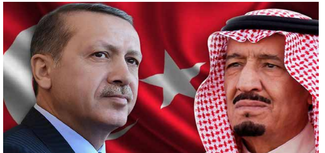
ما زال المحور الثلاثي القطري السعودي يقدم الكثير على صعيد رفع مستوى الدعم بالسلام، كما ونوعاً

تتطلب محاولة الإجابة نظرة أعمق في علاقات موسكو بالدول الثلاثة، لا سيما السعودية، على خلفية ما طرأ من أحداث متسارعة على صعيد العلاقات الروسية-التركية. يلتفت النظر عدم صدور موقف رسمي، سعودي أو قطري، حول تداعيات إسقاط مقاتلة سوخوي الروسية، رغم كثرة الحديث عن محور ثلاثي في التعامل مع قضية سورية، فهل يعود ذلك إلى هشاشة هذا المحور، أم يوجد تنكح مقصود على ما يتم التوافق عليه وتنفيذه وراء الكواليس؟ كما بلغت النظر ما تحقق «إيجابياً» من خلال اللقاء الدوري للجان الحكومية المشتركة بين روسيا والسعودية، لتعزيز التعاون الثنائي، وذلك بعد أيام معدودة من إسقاط الطائرة الروسية، ودون أن يتسرب