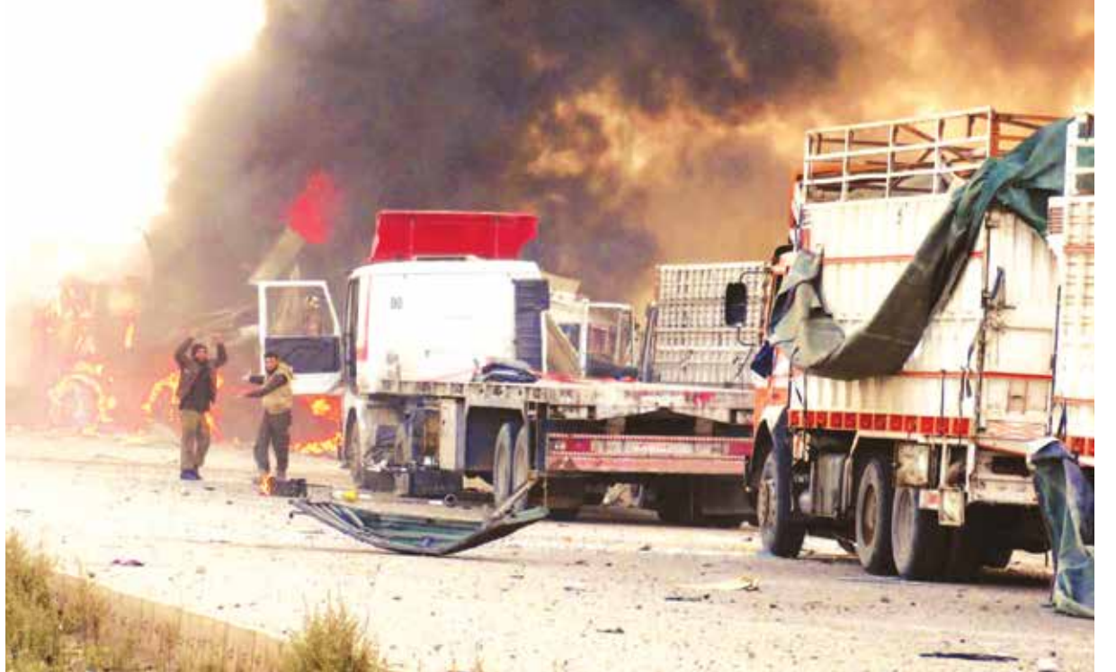
لم تتوقف روسيا عن استهداف الأحياء السكنية والمرافق الخدمية والحوية (الانترنت)

إنه يتوقع روسيا عن استهداف الأحياء السكنية والمرافق الخدمية والحوية للمدنيين السوريين. إذ أن فشل الحملة البرية التي شنتها قوات النظام، بالتزامن مع بدء الغارات الروسية، ومن ثم سقوط «سوخوي ٢٤»، ترجمته القوات الروسية من خلال انتقامها من المدنيين.