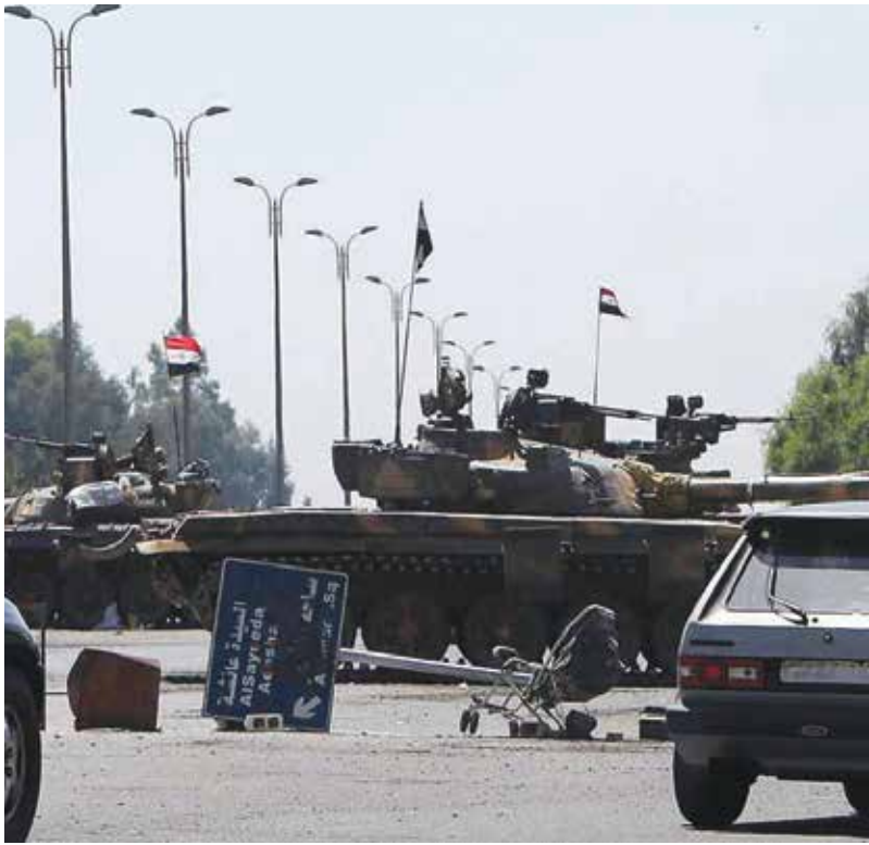
حواجز النظام (الإنترنت)

حينها، لحظة هي الأسعد في حياتي. ولكن منذ طلبت للخدمة الاحتياطية انقلبت حياتي رأساً على عقب، أقيمت فكرة الزواج، فمن بزواج ابنته لشخص قد يساق إلى جبهة ما ليوموت! حتى علمي غير مستقر، فحين مطالبون ببيان وضعنا العسكري كل عدة أشهر، ومن حظي السعيد أني مشمل بعفو، فكننت أحصل على هذا البيان، لكنني اليوم لا أشعر بالأمان بأي شكل، لذلك قررت السفر».