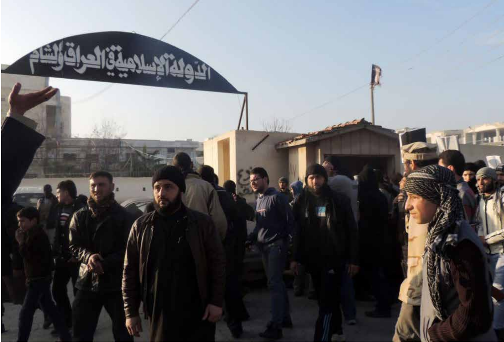
سجون ومعتقلات داعش.. صروح لبناء الظلم

العشوائية إلى اكتظاظ السجون بالمعتقلين، لاسيما في النقطة الأمنية الأخطر التابعة للتنظيم والمعروفة باسم النقطة «11». وقد أشارت حملة «الرقعة تذيب بصمت» إلى أن «التنظيم ارتكب العديد من الانتهاكات بحق أبناء مدينة الرقة ترتقي إلى مستوى جرائم حرب بحق الإنسانية، لا سيما بحق أبناء المناطق التي يسيطر عليها، ليمارس شتى أنواع الجرائم، علناً ودون حساب. بل على عكس ذلك، فهو يسعى لنشر ثقافة الإرهاب حول العالم، معتزلاً بها كونها أحد أهم الأسباب التي مكنت حكمه، فخصص لها شقاً قوياً من إعلامه، يعمل على تقديمها بكل اللغات والطرق، من قطع الرؤوس والأطراف والجلد والرزمي من شاطئ، جميعها طُبقت أمام الكاميرات وبُنِت للعالم لتعكس حقيقة الوضع تحت سيطرته، إلا أن الوضع داخل معتقلاته يسوء يوماً بعد يوم، بحسب شهادة معتقلين أفرج عنهم، وآخرين استطاعوا الهرب من سجونهم».