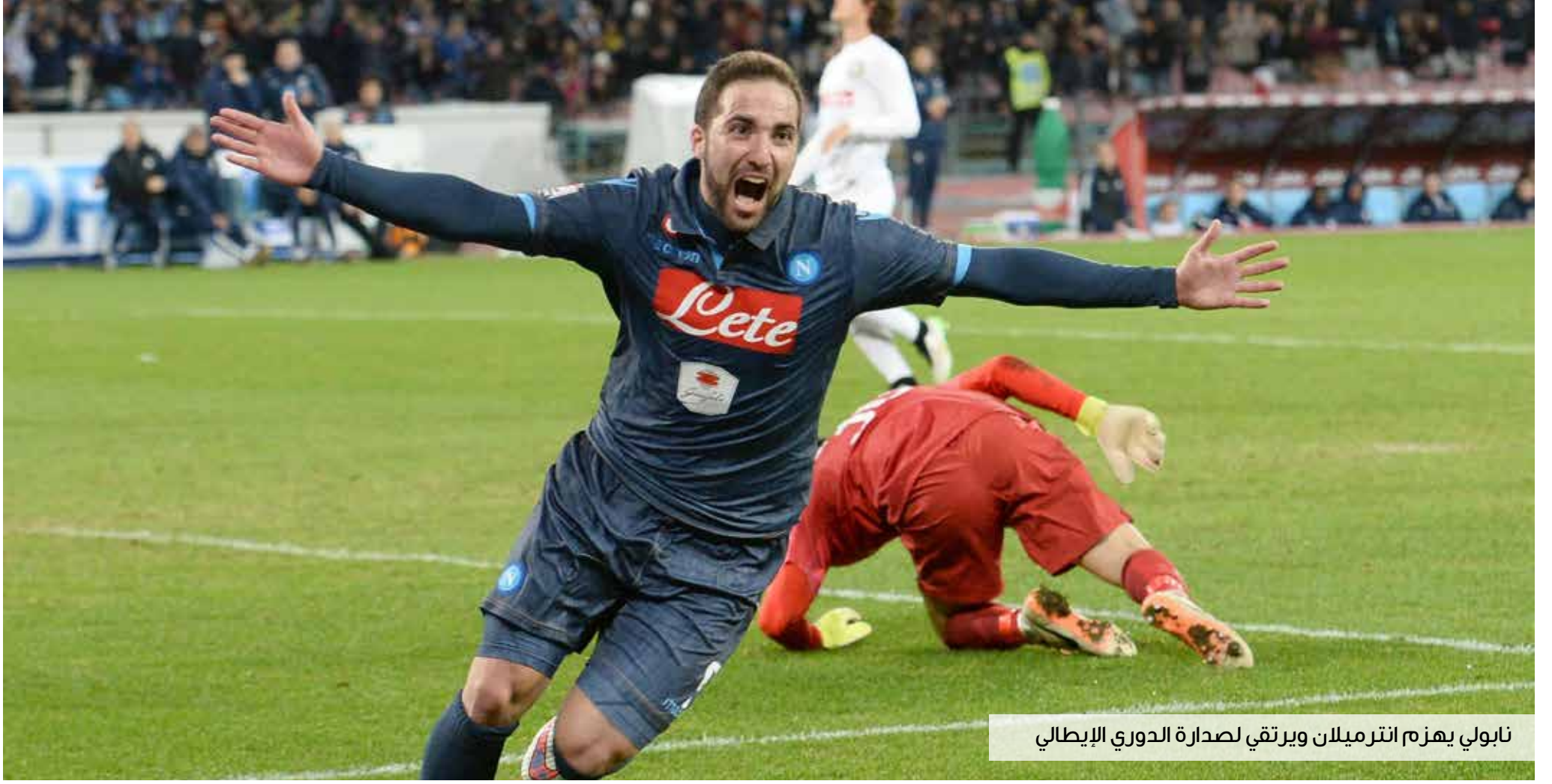
نابولي يهزم انترميلان ويرتقي لصدارة الدوري الإيطالي

أحرز اللاعب ستيفن كوري ٤١ نقطة ليقود فريقه غولدن سيتيت وريورز حامل اللقب، لتعزيز مسيرته الخالية من الهزيمة منذ بداية الموسم الحالي، لدوري كرة السلة الأمريكي للمحترفين. وعزز وريورز رقمه القياسي بتحقيق انتصاره رقم ١٧ على التوالي هذا الموسم، بالفوز على مضيفة فينكس صنز ١١٦-١٣٥. ونجح كوري، حامل لقب أفضل لاعب في الدوري، في تنفيذ تسع رميات ثلاثية، كما سيطر على ست كرات مرتدة.