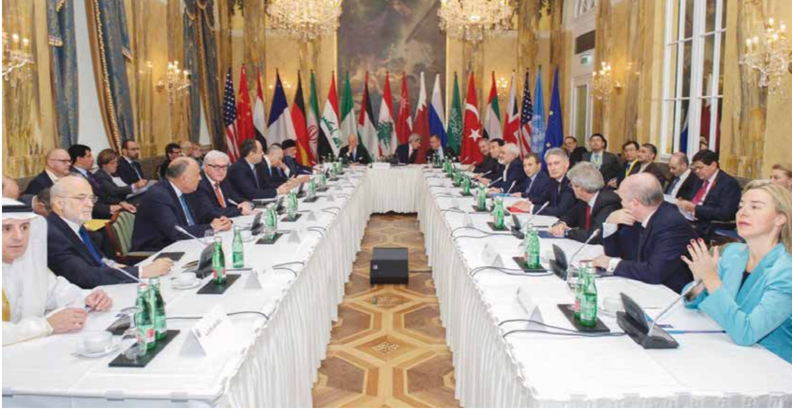
سورية كانت عنوان اجتماع فيينا، لكن الطريق إلى التسوية السياسية ما زال طويلاً