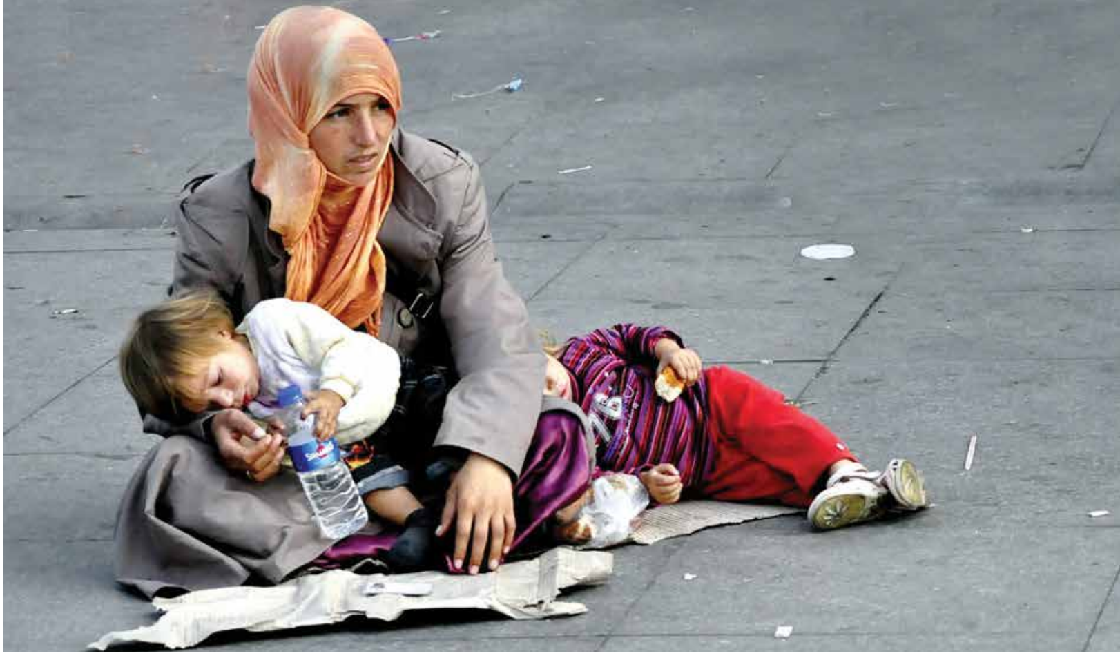
ظاهرة التسول تنتشر وتزدهر تحت عين مؤسسات النظام الاجتماعية

نعم السوريين الأموات هم أكثر من يستخدم الفيس بوك في هذا العالم التافه، ويجب أن يقدم العالم جوائز إضافية للشخص الذي اخترعه، فقد وصل اخترعه هذا عند السوريين إلى القبور، ويجب أن يدخلهم في موسسته التافهة غينس، لأنهم أول من أنطق بالشهداء وأكثر الأموات المستخدمين للفيس، وأكثر الأموات المتحاورين في هذا العالم.