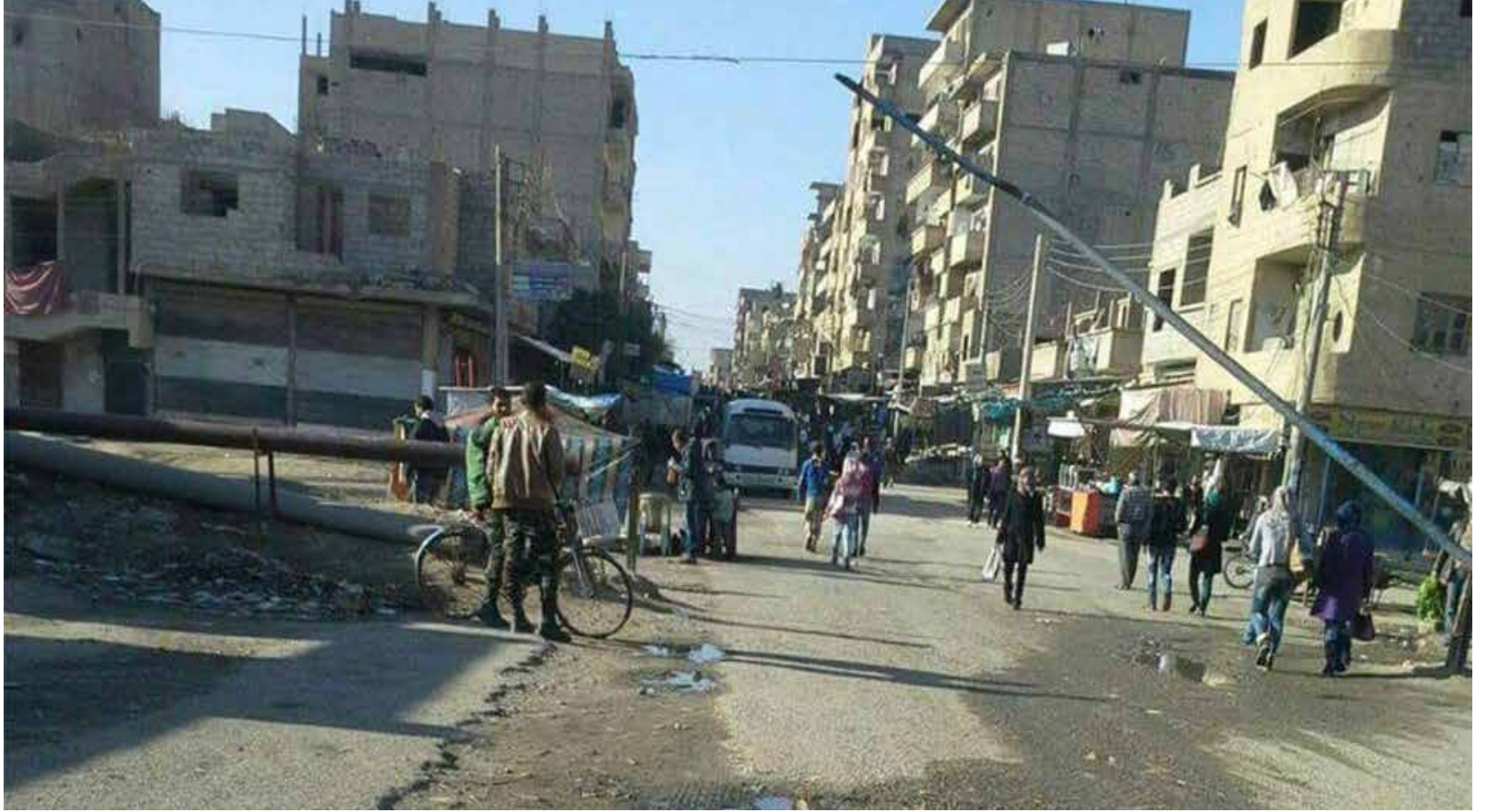
عام كامل على حصار داعش لأحياء دير الزور (خاص - صدي الشام)

تعتبر مسألة حصار الأحياء السكنية وتجويع المدنيين من أكثر تجليات المأساة السورية طوال فترة الثورة، حيث استُخدم كسلاح لكسر إرادة الشعب الأثر في جريمة لا تقبل بشاعة عن القصف والدمار الذي تلحقه القذائف والصواريخ والبراميل المتفجرة بهذا الشعب الأعزل، فمن أحياء حمص الثائرة، إلى غوطتي دمشق الشرقية والغربية، بالإضافة إلى جنوب دمشق، تفنن النظام في تجويع شعبه الأثر، وهو ما تابعه داعش، تلميذ النظام النجيب في الإجرام، فراح ينتقم من المدنيين العزل من خلال حصار الأحياء التي يسيطر عليها النظام في دير الزور.