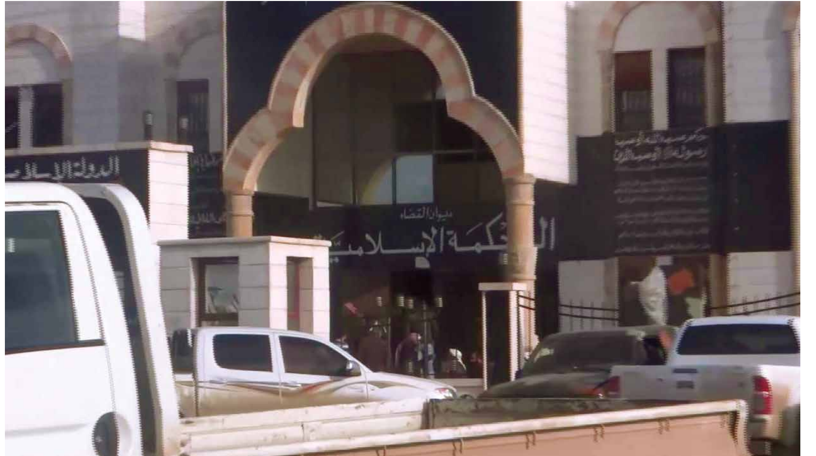
لم يسلم أحد من عقوبات التنظيم القاسية... حتى القضاة العاملين في محاكمه