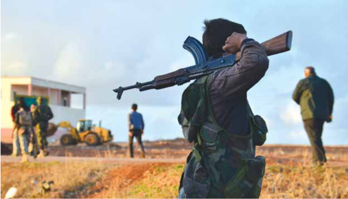
مقاتلو المعارضة على خط الاشتباك مع وحدات الحماية الكردية في محيط قرية أناب بريف حلب الشمالي

المتحدث باسم «الجبهة الشامية»: هدفاً مرحلياً لاستعادة السيطرة على الحاضر والعيس لإفشال خطة النظام وروسيا