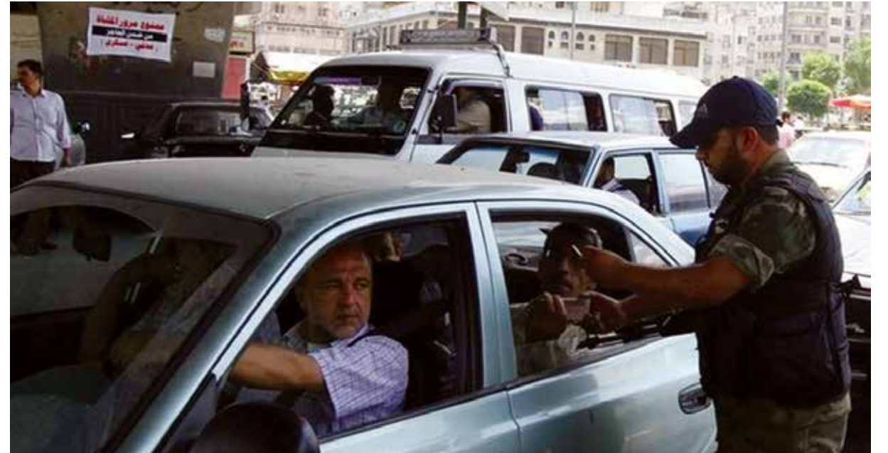
حملة التجنيد الأخيرة تهدد الشباب السوري وتعيق حركته

بدأت الشرطة العسكرية وشعبة الأمن العسكري التابعة للنظام، منذ ١٥ يوما، بنشر دورياتها داخل المدن وعلى الطرقات اللوية، حيث اعتقلت آلاف الشباب الذين تتراوح أعمارهم بين ١٩ إلى ٤٢ عاما. وتفيد التسريبات بأن هذه الحملة قامت بناء على توجيه من القصر الجمهوري يقضي بالتعبئة العامة غير المعلنه، في وقت لم تُدعم هذه الحملة بنشاطات إعلامية أو جماهيرية لتوضيح أهدافها وأهدافها،