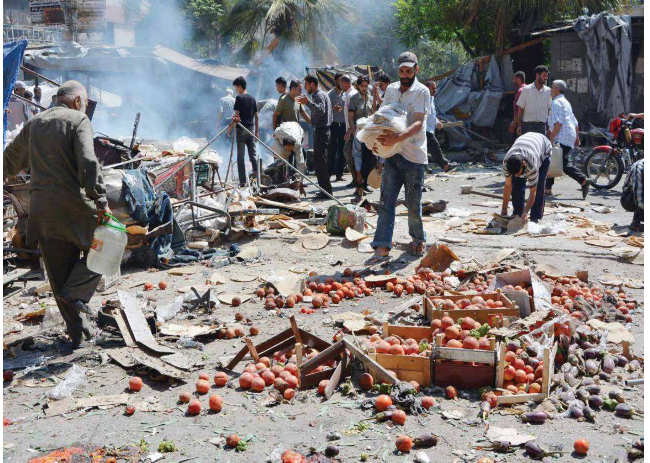
روسيا تحاول إنهاء مظاهر الحياة في مناطق سيطرة المعارضة

حلب... المعارضة تقترب من «الهدف المرحلي» في الريف الجنوبي وتردد «وحدات الحماية» في الريف الشمالي