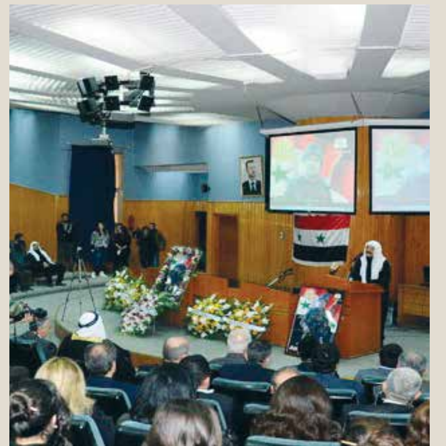
حضور رسمي حاشد وغياب تام للطلاب