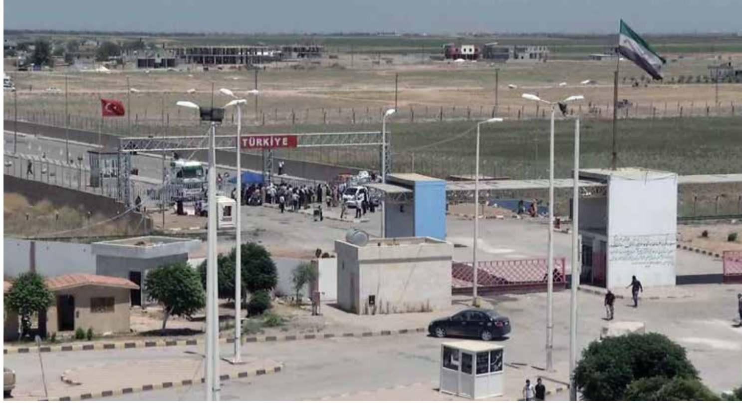
المعابر الحدودية مع تركيا.. أبواب تخلق في وجه السوريين